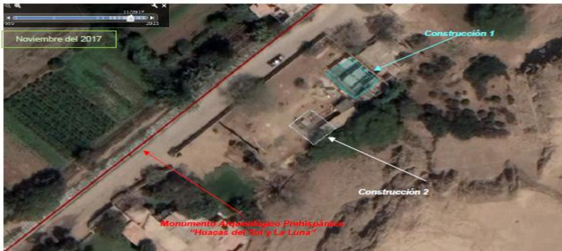
Fig. Imagen satelital de fecha Noviembre del 2017, donde ya se observan en las imágenes satelitales de Google Earth, el cambio en la topografía del terreno del área intervenida, por lo que, se visualiza el inicio de los trabajos de construcción de dos ambientes elaborados de material noble.