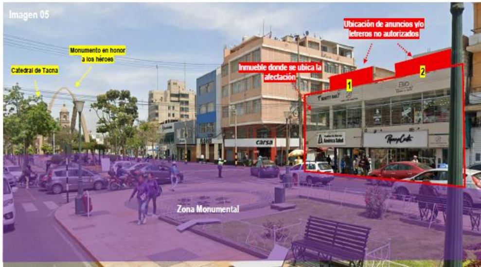
Imagen extraída del Informe Técnico Pericial, en la cual se aprecia la ubicación de los anuncios en el inmueble en cuestión y su impacto en la Z.M de Tacna