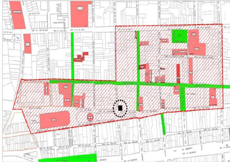
Imagen N.º 1 del Informe Técnico N.º 000004: Ubicación del inmueble en relación al plano de delimitación de la Z.M de Tacna