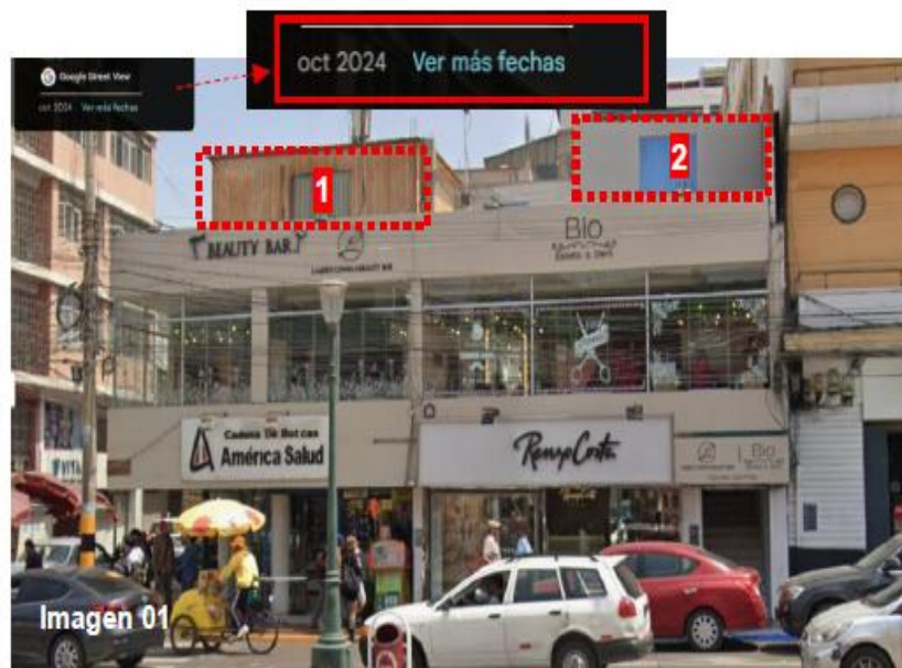
Imagen 01 del Informe Técnico N.º 000009, correspondiente al mes de octubre del año 2024, donde se aprecia el inmueble antes de la colocación de los carteles y/o anuncios