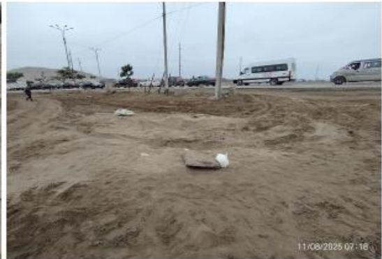
Fotos 3 y 4: Imágenes de fecha 11 de agosto del 2025, con el detalle de la afectación.

2.17. De acuerdo al Informe Técnico Pericial tenemos que la afectación se ha realizado en el interior de la poligonal intangible, la cual cuenta con muros informativos, conforme se muestra a continuación: