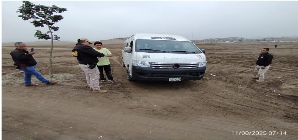
Foto 1: Imagen de fecha 11 de agosto del 2025, en ella se aprecia el momento en que se interviene a la movilidad de transporte publico de marca Foton con placa de redaje ABV-809

aproximada de 0.50 m. Del resultado de esta acción se evidencia material arqueológico en superficie, como es material malacológico y óseo.