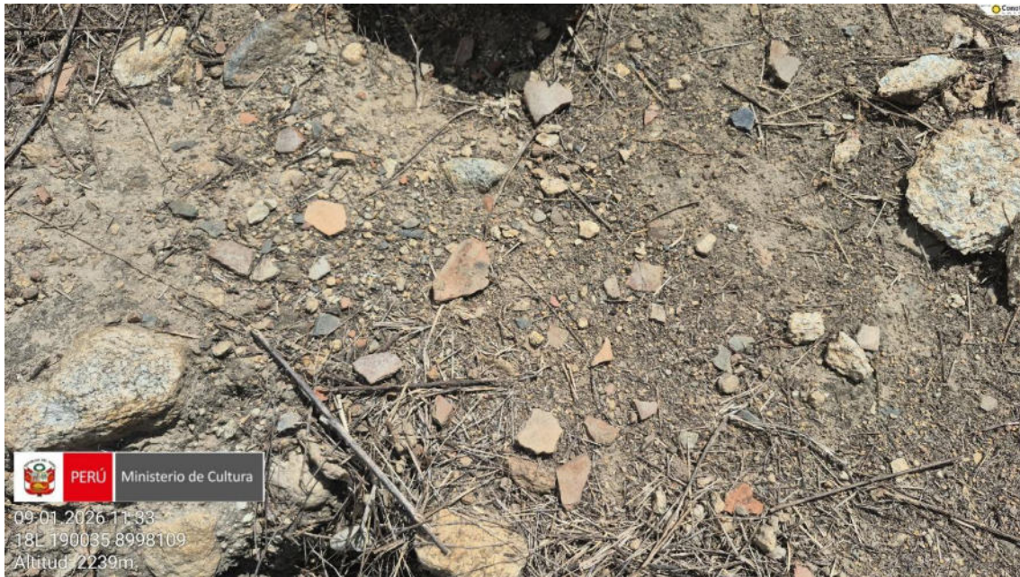
Imagen 05: vista de la dispersión de fragmentos de cerámica.

SUBDIRECCIÓN DE PATRIMONIO CULTURAL E INDUSTRIAS CULTURALES E INTERCULTURALIDAD