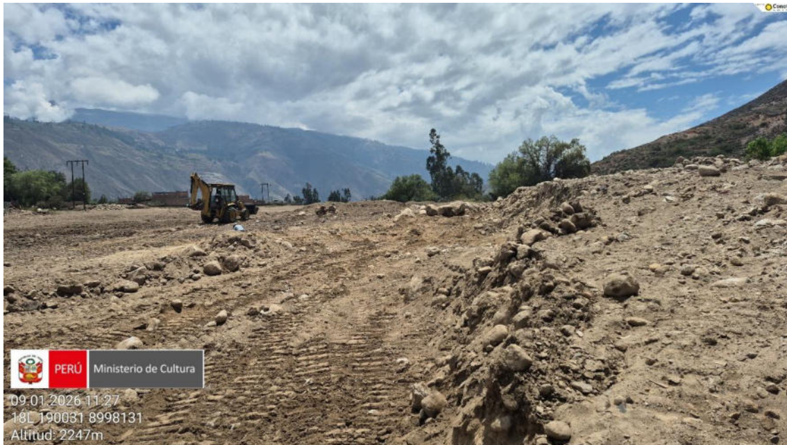
Imagen 01: trabajos de remoción de suelo con maquinaria pesada.