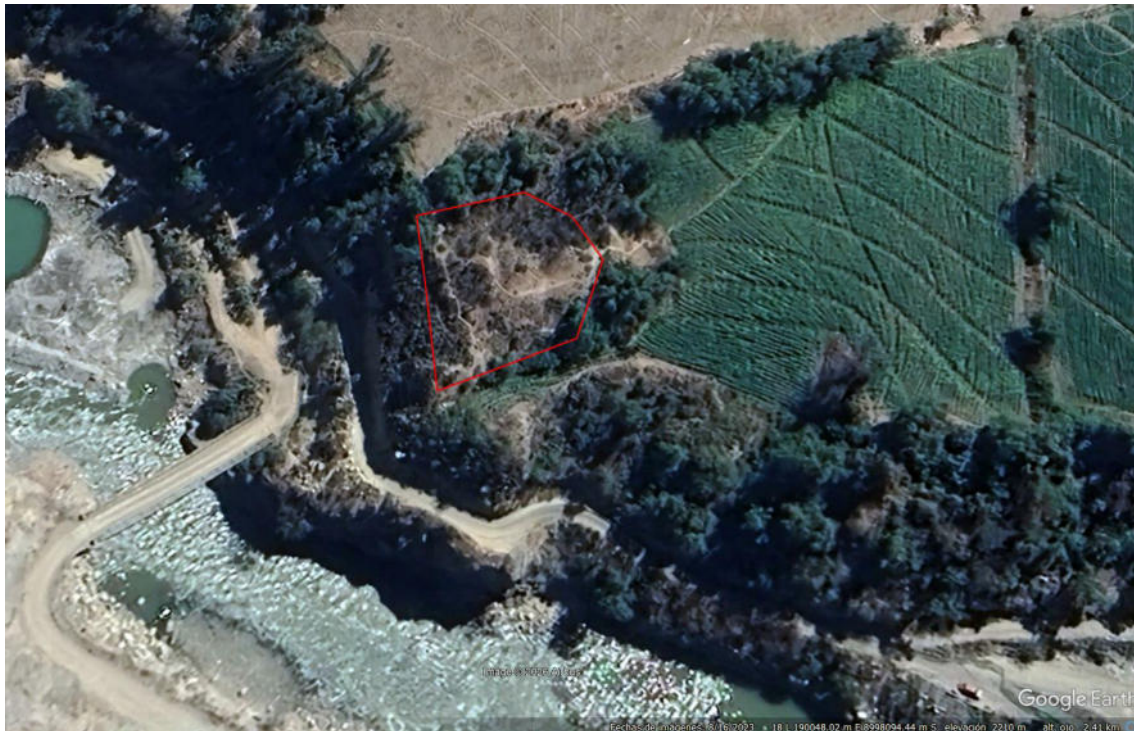
Vista satelital de sitio arqueológico.

SUBDIRECCIÓN DE PATRIMONIO CULTURAL E INDUSTRIAS CULTURALES E INTERCULTURALIDAD