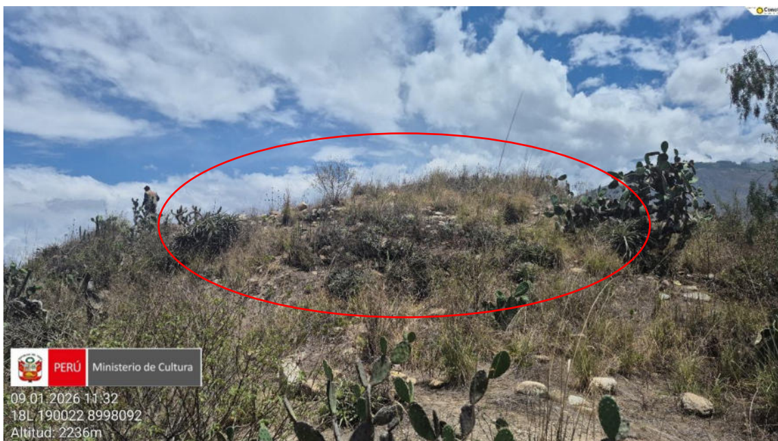
Imagen 04: vista panorámica del lado sur de parte de muros arquitectónicos cubierto de malezas del lugar.