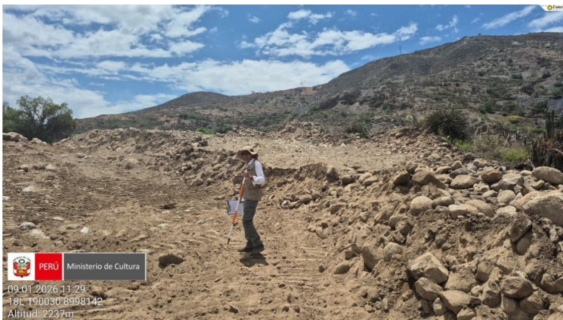
Imagen 02: vista panorámica de excavación del suelo generando afectación parte del del sitio arqueológico.