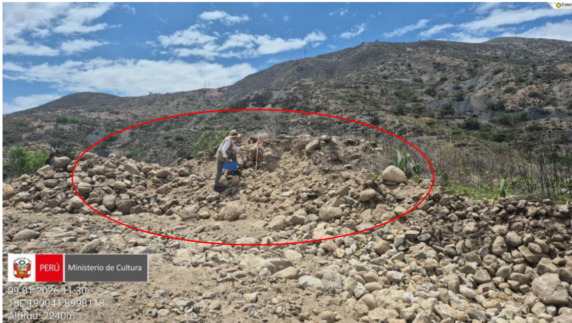
Imagen 03: vista panorámica de restos arquitectónicos afectados a raíz de la excavación y remoción del suelo.

SUBDIRECCIÓN DE PATRIMONIO CULTURAL E INDUSTRIAS CULTURALES E INTERCULTURALIDAD