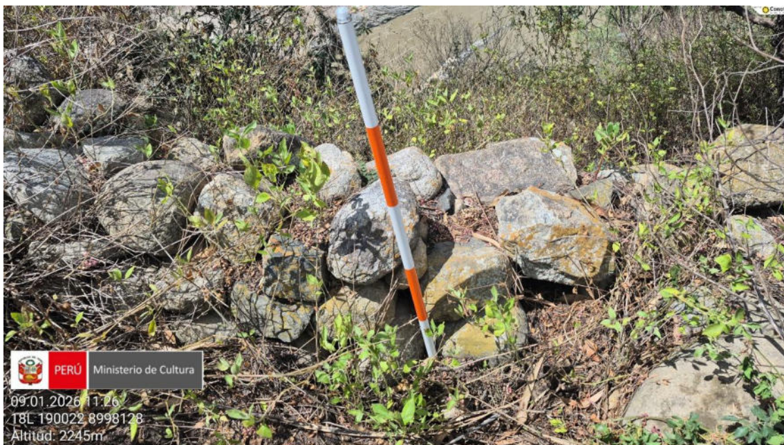
Imagen 06: vista a detalle de muros prehispánicos del sitio arqueológico.