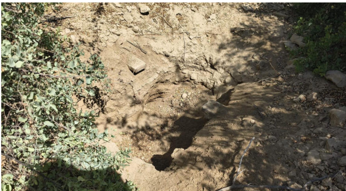
FOTO 05: VISTA DE POZOS HUAQUEO EN EL SITIO ARQUEOLOGICO CASA BLANCA-CATACAOS

DIRECCIÓN DESCONCENTRADA DE CULTURA PIURA