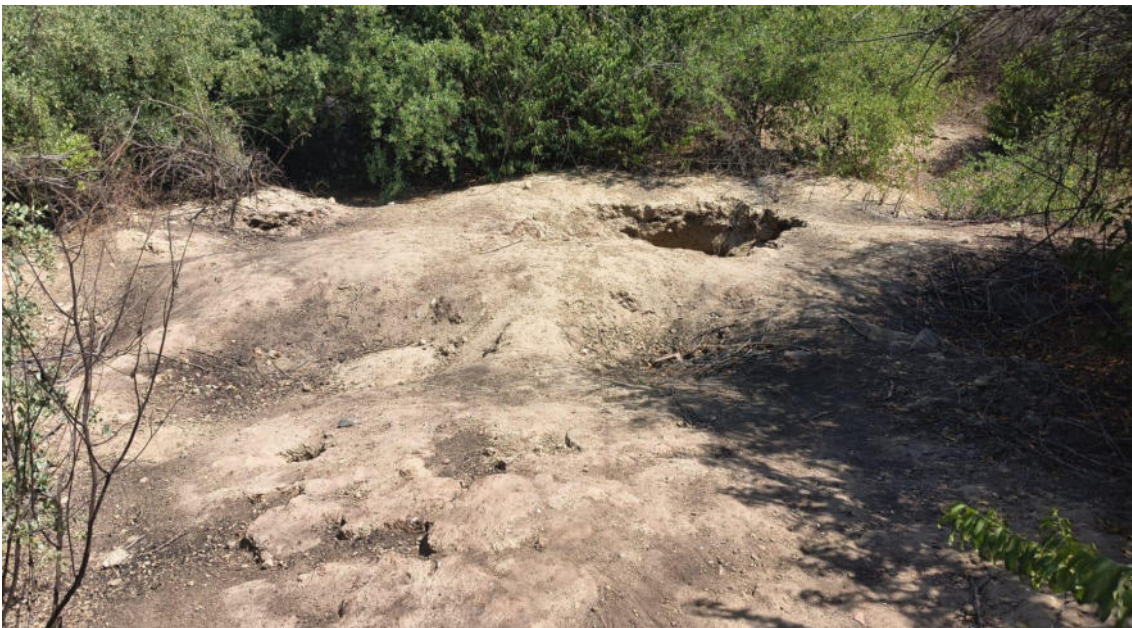
FOTO 04: VISTA DE POZOS HUAQUEO EN EL SITIO ARQUEOLOGICO CASA BLANCA-CATACAOS