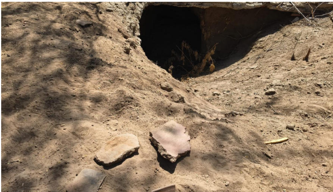
FOTO 10: VISTA DE DETALLE DE MATERIAL ARQUEOLÓGICO (CERÁMICA) ASOCIADO A POZO DE HUAQUERO EN EL SITIO ARQUEOLOGICO CASA BLANCA-CATACAOS