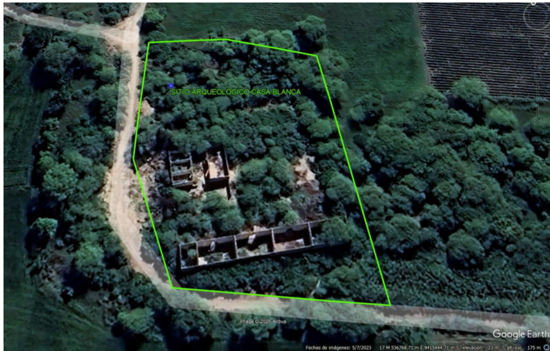
Imagen 01: CAPTURA DE PANTALLA DEL GOOGLE EARTH, INDICADO LA PROPUESTA DE POLÍGONO DEL SITIO ARQUEOLÓGICO CASA BLANCA-CATACAOS