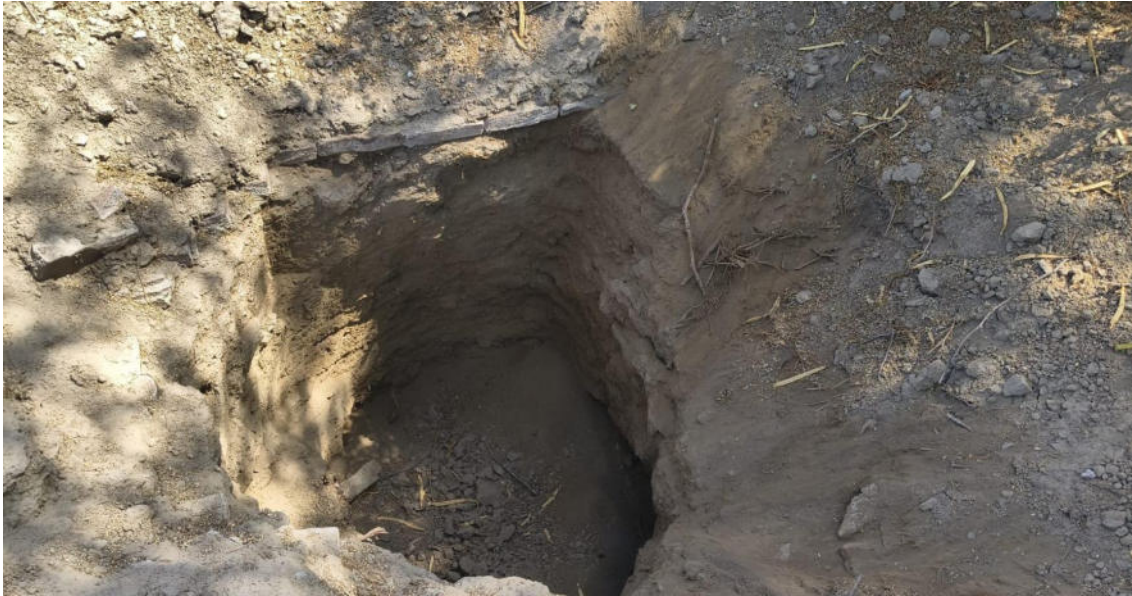
FOTO 07: VISTA DE POZOS HUAQUEO EN EL SITIO ARQUEOLOGICO CASA BLANCA-CATACAOS

DIRECCIÓN DESCONCENTRADA DE CULTURA PIURA