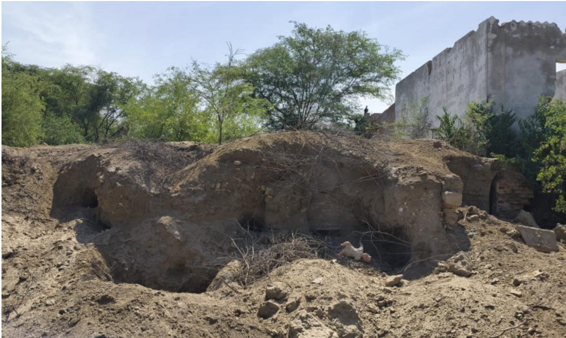
FOTO 01: VISTA DE ESTRUCTURA ANTIGUA QUE CORRESPONDE A UNA CASA HACIENDA CONSTRUIDA SOBRE EL SITIO ARQUEOLÓGICO CASA BLANCA-CATACAOS