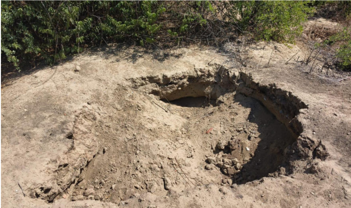
FOTO 03: VISTA DE POZOS HUAQUEO EN EL SITIO ARQUEOLOGICO CASA BLANCA-CATACAOS

DIRECCIÓN DESCONCENTRADA DE CULTURA PIURA