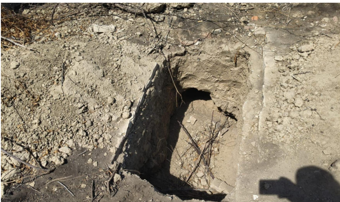
FOTO 06: VISTA DE POZOS HUAQUEO EN EL SITIO ARQUEOLOGICO CASA BLANCA-CATACAOS