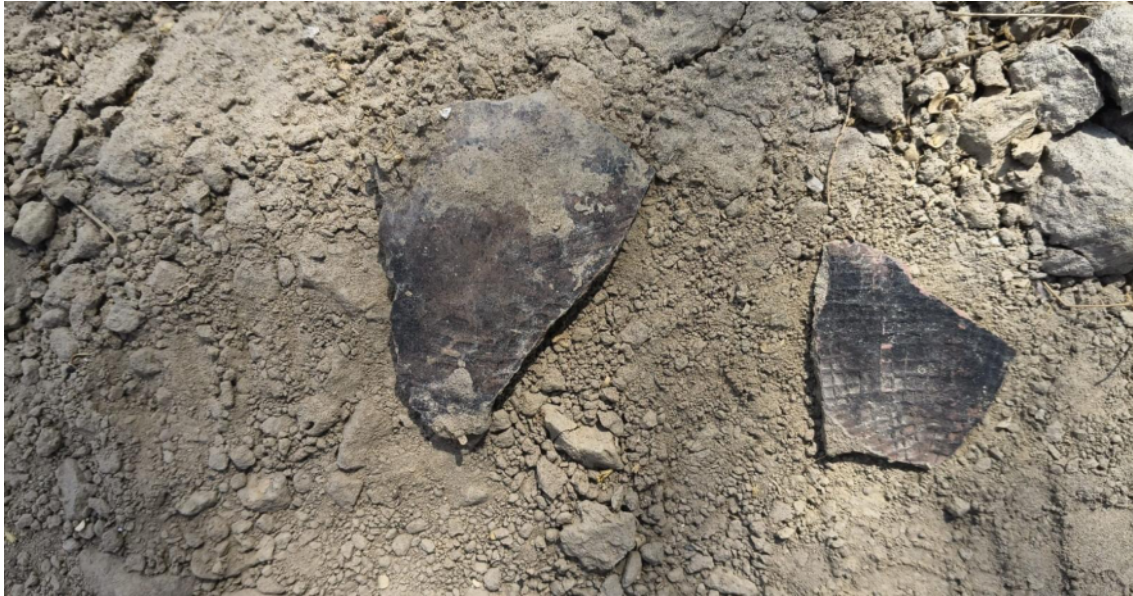
FOTO 09: VISTA DE DETALLE DE MATERIAL ARQUEOLÓGICO (CERÁMICA) EN EL SITIO ARQUEOLOGICO CASA BLANCA-CATACAOS

DIRECCIÓN DESCONCENTRADA DE CULTURA PIURA