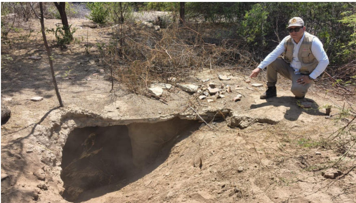
FOTO 02: VISTA DE INSPECCIÓN OCULAR AL SITIO ARQUEOLOGICO CASA BLANCA-CATACAOS