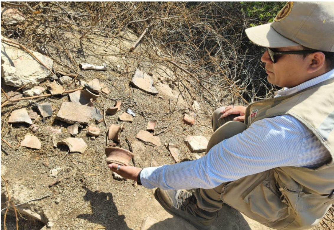
FOTO 08: VISTA DE DETALLE DE MATERIAL ARQUEOLÓGICO (CERÁMICA) EN EL SITIO ARQUEOLOGICO CASA BLANCA-CATACAOS