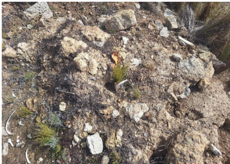
Foto 5. Vista en detalle del área huaqueada donde se evidencia la exposición de restos óseos humanos de un contexto funerario del sitio arqueológico Chuychu.