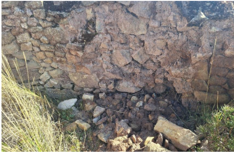
Foto 3. Vista en detalle del muro de la estructura arquitectónica de planta circular del sitio arqueológico Chuychu. En mal estado de conservación.