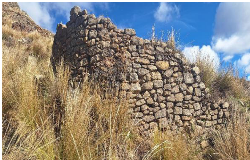
Foto 2. Vista en detalle del muro de la estructura arquitectónica de planta circular del sitio arqueológico Chuychu.