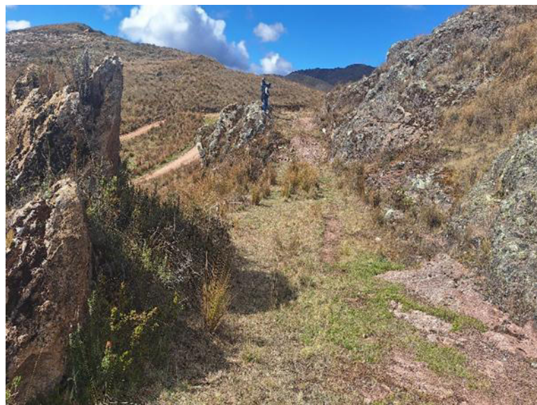
Foto 8. Vista del camino prehispánico que se ubica en la parte oeste del sitio arqueológico Chuychu.