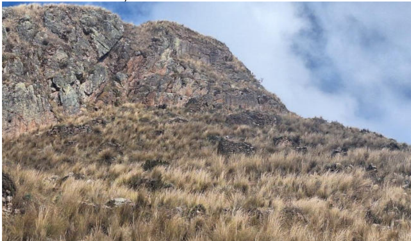
Foto 1. Vista panorámica de las estructuras arquitectónicas de planta circular del sitio arqueológico Chuychu.