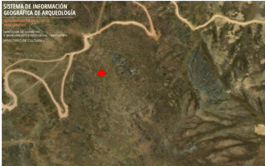
Imagen 1. Área de ubicación del sitio arqueológico Chuychu. (Punto de color rojo) (Fuente: SIGDA Ministerio de Cultura del Perú).

Las fotos deberán mostrar lo indicado en la valoración cultural (debe observarse de manera evidente la condición de sitio arqueológico del bien):