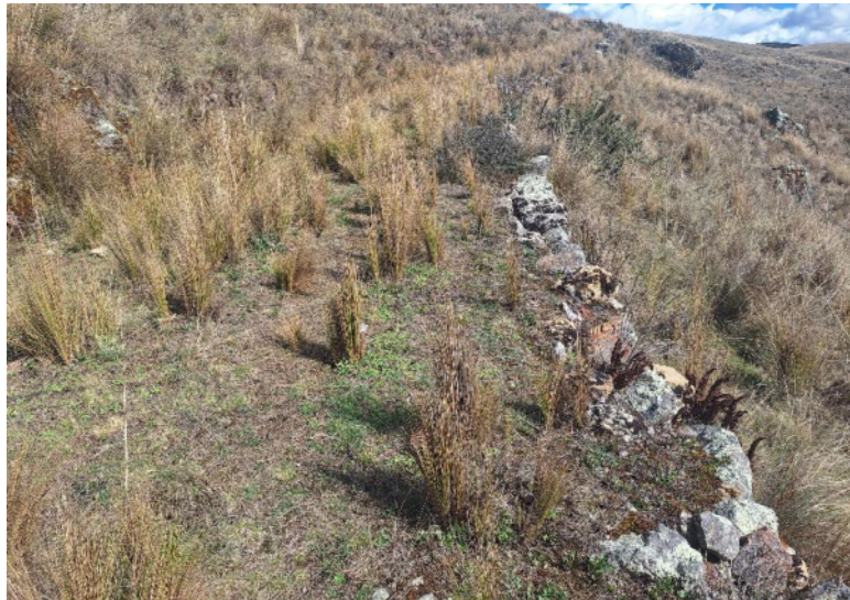
Foto 7. Vista del camino prehispánico que se ubica en la parte oeste del sitio arqueológico Chuychu.