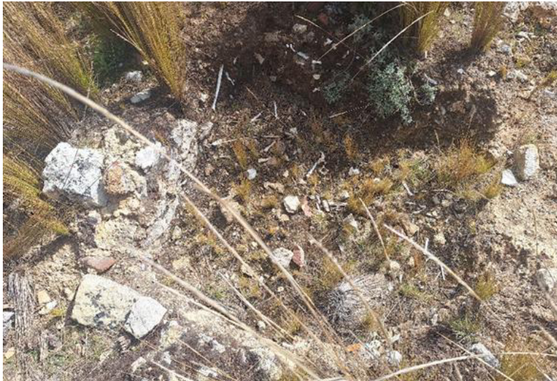
Foto 4. Vista en detalle del área huaqueada donde se evidencia la exposición de restos óseos humanos de un contexto funerario del sitio arqueológico.