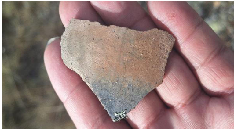
Foto 6. Vista en detalle de fragmento de cerámica parte del contexto funerario (huaqueado) del sitio arqueológico Chuychu.