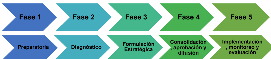
Gráfico N° 2: Fases para la elaboración de un plan de cultura

Las primeras cuatro fases corresponden a la elaboración y aprobación del Plan, mientras que la última integra la implementación, monitoreo y evaluación, con el propósito de promover la mejora continua: