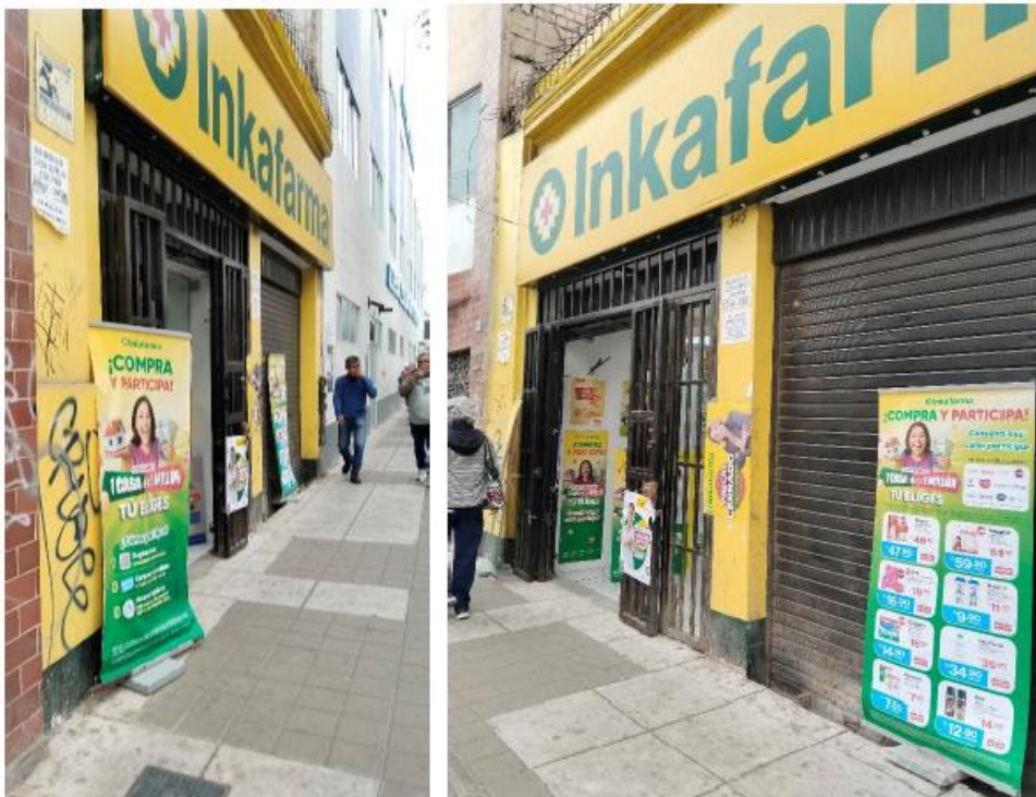
Imagen de setiembre de 2025