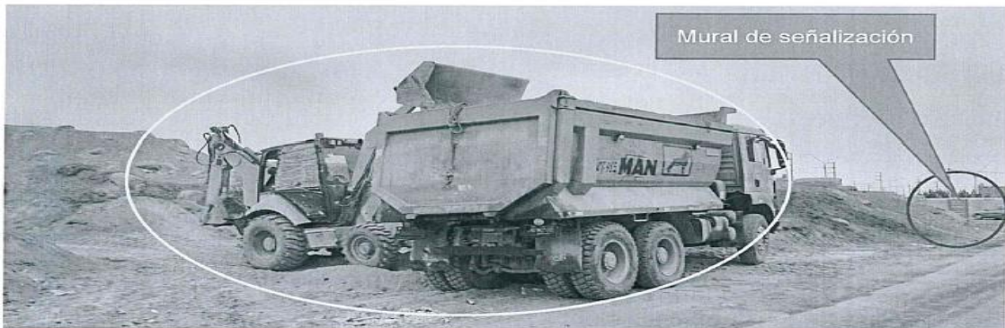
Imagen 03: vista panorámica del momento en que la maquinaria pesada carga al camión de volquete producto de la excavación. De la misma manera a 40 metros aprox., se visualiza un mural de señalización donde indica la intangibilidad. (fuente: imagen de la denuncia).