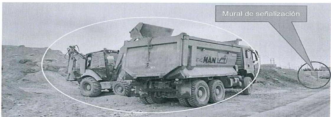
Imagen 03: vista panorámica del momento en que la maquinaria pesada carga al camión de volquete producto de la excavación. De la misma manera a 40 metros aprox., se visualiza un mural de señalización donde indica la intangibilidad. (fuente: imagen de la denuncia).

Respecto a lo señalado por el administrado sobre que actuó de buena fe, siguiendo las instrucciones de la propietaria del predio, Sra. Felicita Victoria Casanova Pachas, sin conocimiento de la presunta superposición con la zona intangible y con el único objetivo de realizar labores de limpieza y acondicionamiento del terreno, tenemos que a 30 metros del área donde se realizaron los trabajos de afectación, en el lado sur, se ubica un mural de señalización que indica la intangibilidad del sitio arqueológico, por lo tanto, el administrado sí tenía conocimiento de la intangibilidad del área, pero aun así realizó los trabajos de remoción, excavación y corte con maquinaria pesada generando una afectación directa del sitio arqueológico Huaca Grande sector B.