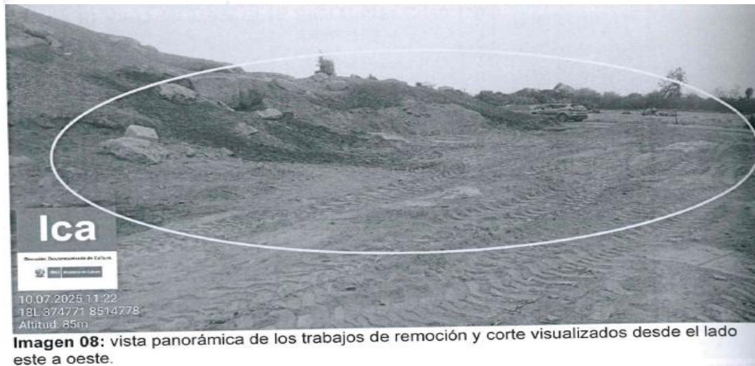
Imagen 08: vista panorámica de los trabajos de remoción y corte visualizados desde el lado este a oeste.