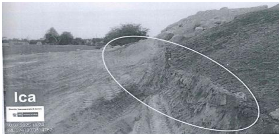
Imagen 07: nótese como el corte del terreno dejó expuestos perfiles de elementos arqueológicos.

Decenio de la Igualdad de Oportunidades para Mujeres y Hombres Año de la Esperanza y el Fortalecimiento de la Democracia