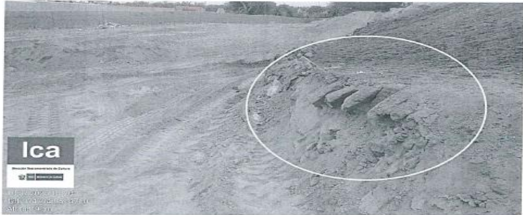
Imagen 04: vista en detalle del perfil expuesto producto del corte. Se observan elementos constructivos de la pirámide principal del sector B: adobes rectangulares.

pirámide principal del lado noroeste sector B, construidos en adobe/tapia, del referido bien cultural. Asimismo, se ha evidenciado la presencia de fragmentos de cerámica prehispánica como resultado de dichos trabajos no autorizados en el área intervenida.