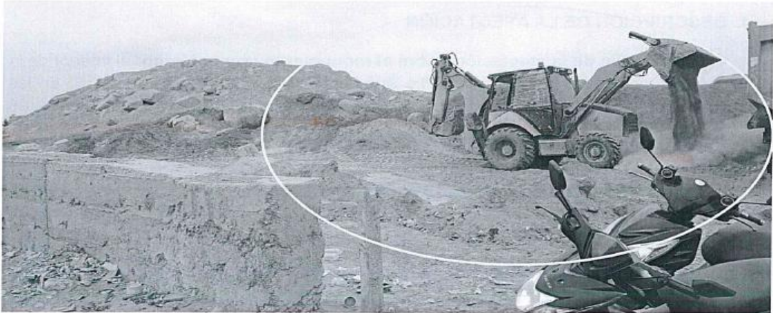
Imagen 02: nótese que la maquinaria pesada realizando trabajos de excavación al interior del sitio arqueológico.

Decenio de la Igualdad de Oportunidades para Mujeres y Hombres Año de la Esperanza y el Fortalecimiento de la Democracia