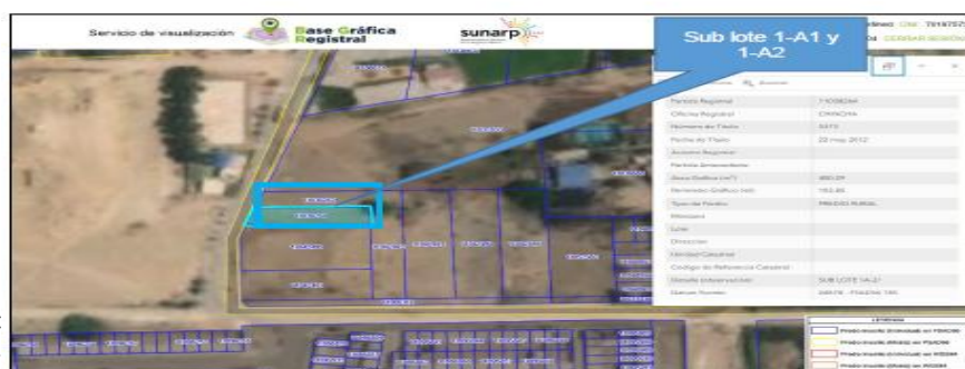
Imagen 03: vista satelital según base grafica de SUNARP, donde se ubica Sub lote 1-A1 y Sub lote 1-A2.