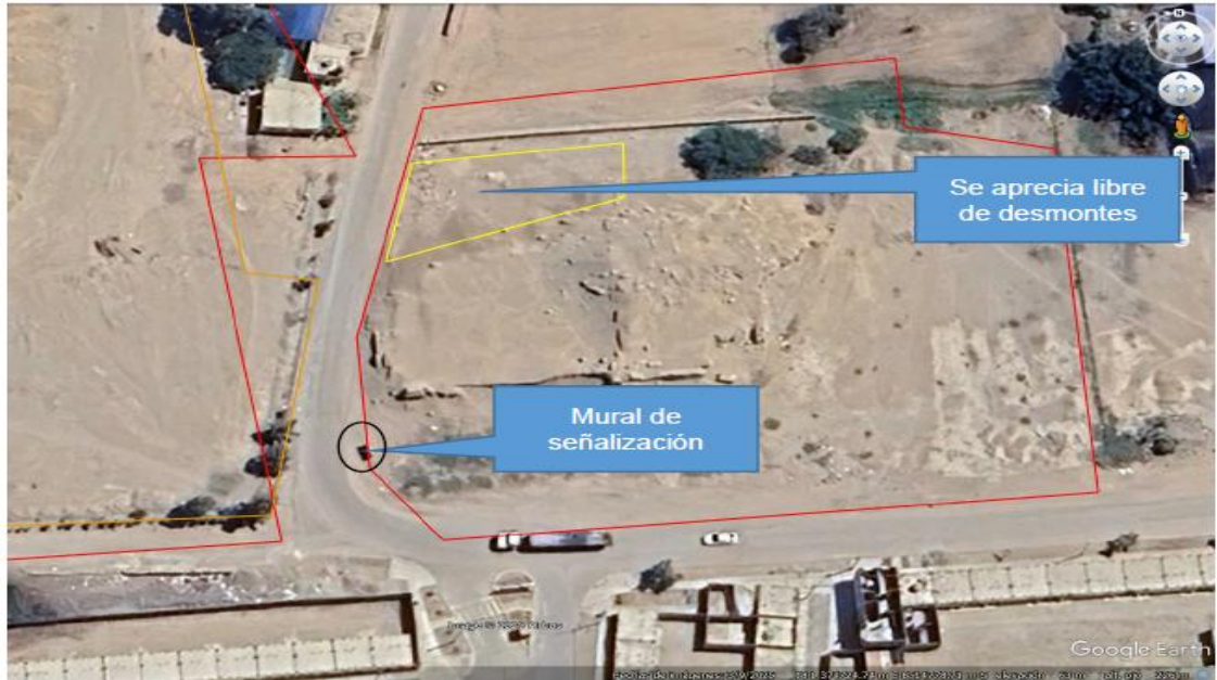
Imagen 01: vista satelital donde el área de polígono amarillo corresponde a la zona de afectación donde no existe desmonte; asimismo a aprox. 30 metros se observa la ubicación del mural de señalización.

Por otra parte, el referido sitio arqueológico se encuentra correctamente señalizado mediante un mural de señalización que indica su intangibilidad e hitos de delimitación.