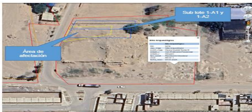
Imagen 02: vista satelital donde se observa lo siguiente: polígono azul predio de la administrada; polígono amarillo área de la afectación; polígono rojo límite del sitio arqueológico Huaca Grande sector B.

De dicha verificación se corroboró que tanto el Sub-Lote 1-A1 como el Sub-Lote 1-A2 se superponen en su totalidad con la poligonal del sitio arqueológico Huaca Grande, sector B. En consecuencia, los trabajos de excavación y remoción con maquinaria pesada fueron realizados al interior del predio de la administrada, en un área que se encuentra comprendida dentro de la zona intangible, conforme a lo dispuesto por la Ley N° 28296, Ley General del Patrimonio Cultural de la Nación, modificada por la Ley N° 31770, la cual establece la intangibilidad de los bienes inmuebles prehispánicos y prohíbe cualquier tipo de intervención sin autorización previa del Ministerio de Cultura.