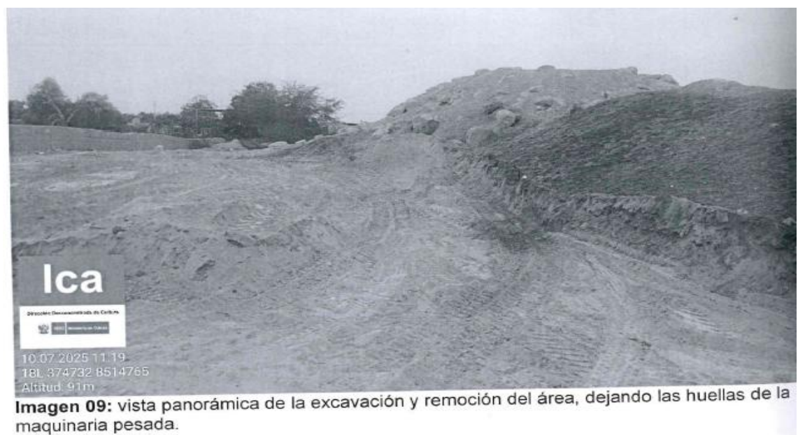
Imagen 09: vista panorámica de la excavación y remoción del área, dejando las huellas de la maquinaria pesada.