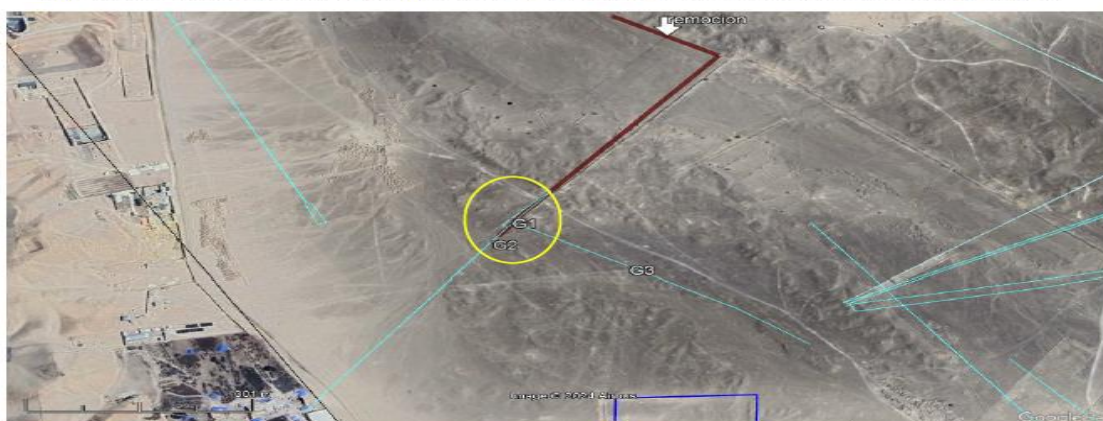
Fig. 9: Vista de Google Earth. Las líneas celestes indican los geoglifos (G1, G2 y G3) existentes de la parcela 3. La línea marrón indica remoción con maquinaria pesada a manera de bordo. El círculo amarillo indica los geoglifos desaparecidos.