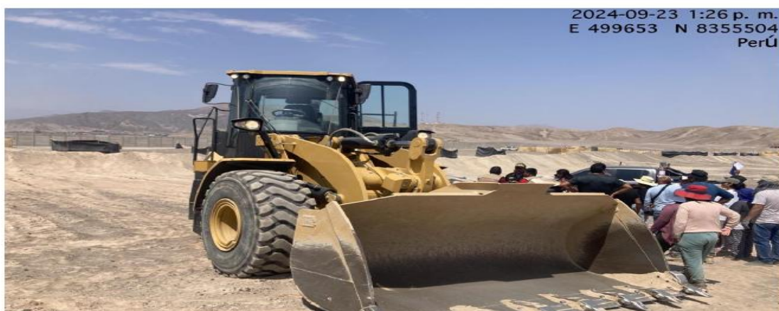
Fig. 04: Vista de la maquinaria donde estuvo haciendo remoción de tierra en las coordenadas vistas en la imagen.