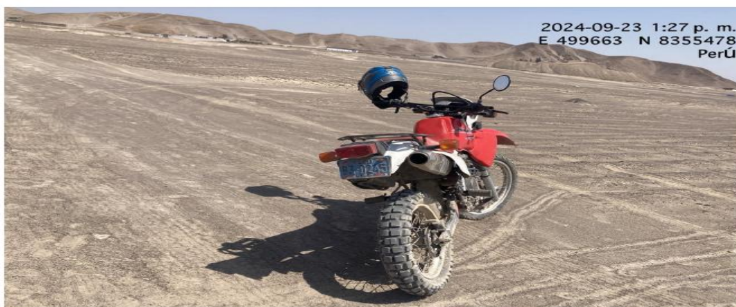
Fig. 06: Vista de la moto lineal donde ingreso al interior del polígono de la parcela 3 coordenadas vistas en la imagen