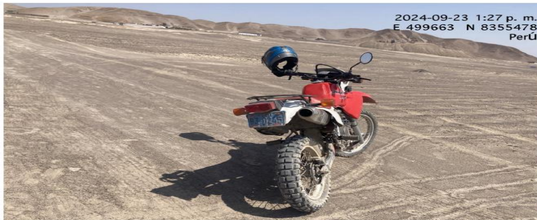
Fig. 06: Vista de la moto lineal donde ingreso al interior del polígono de la parcela 3 coordenadas vistas en la imagen

En ningún momento se le imputa al administrado las acciones realizadas con la maquinaria tipo cargador frontal, sino el ingreso de los vehículos, Camioneta 4X4 con placa de rodaje N° ADE 889 y la moto lineal con placa de rodaje N° B30245, conforme se observan en las fotografías que obran en el expediente: