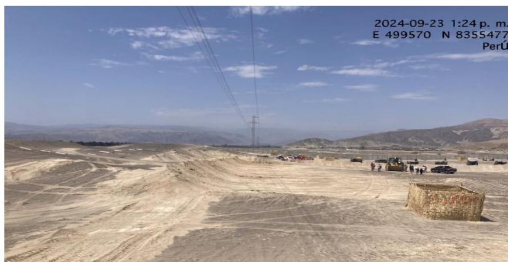
Fig. 05: Vista panorámica de la remoción de tierra que realizó la maquinaria pesada coordenadas vistas en la imagen