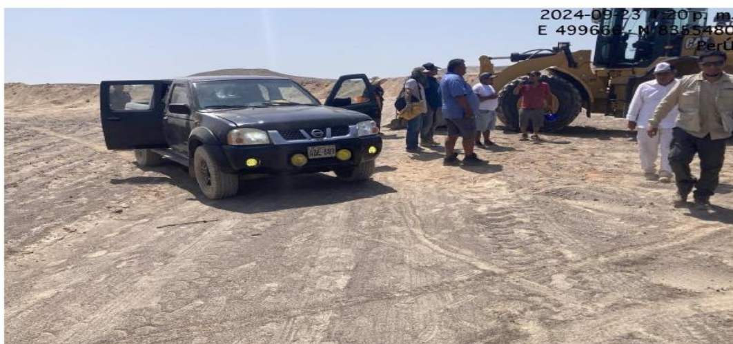
Fig. 07: Vista del vehículo de placa ADE 889 que ingreso al interior del polígono de la parcela 3 coordenadas vistas en la imagen

Asimismo, el Sr Elías Aymar, tenía pleno conocimiento de la condición del área, tal es así que, mediante Expediente N°2023-0102065, solicitó; “opinión técnica del Fundo Espartano”, con fines de proyecto agrícola, no obstante mediante Oficio N° 1938-2023-DDC ICA/MC de fecha 01 de setiembre de 2023, la Dirección Desconcentrada de Cultura de Ica, brinda la respuesta precisando, que el área materia de solicitud se superposición con el sitios y paisajes arqueológicos “Líneas y Geoglifos de Nasca, Sector Parcela 3” y el área de Reserva Arqueológica Líneas y Geoglifos de Nasca, por lo tanto, no fue viable el pedido de opinión técnica.