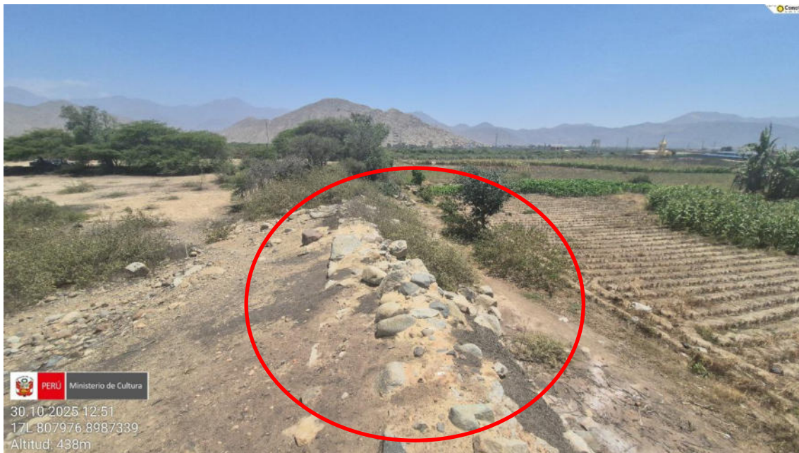
Imagen 03: vista panorámica del lado oeste en las cuales es evidente la expansión.

SUBDIRECCIÓN DE PATRIMONIO CULTURAL E INDUSTRIAS CULTURALES E INTERCULTURALIDAD