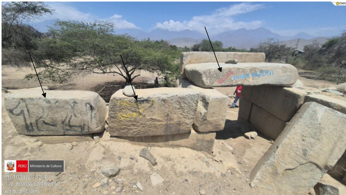
Imagen 05: se observa grafitis en las mismas piedras líticas.

SUBDIRECCIÓN DE PATRIMONIO CULTURAL E INDUSTRIAS CULTURALES E INTERCULTURALIDAD