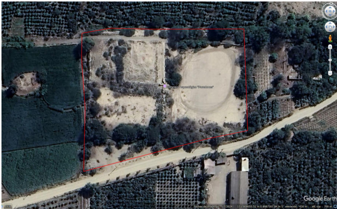
Vista satelital del polígono del sitio arqueológico Paredones.

SUBDIRECCIÓN DE PATRIMONIO CULTURAL E INDUSTRIAS CULTURALES E INTERCULTURALIDAD