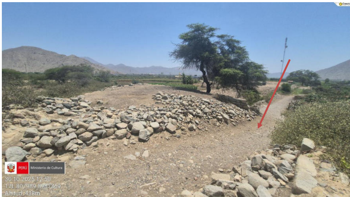
Imagen 04: se observa la apertura de una vía carrozable.