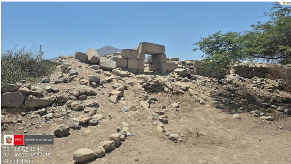
Imagen 06: vista panorámica del pórtico principal en forma trapezoidal con grandes bloques líticas.