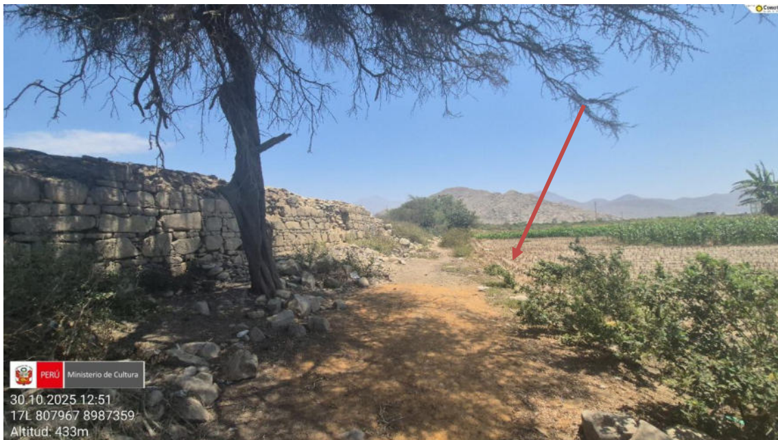
Imagen 02: vista panorámica del lado oeste del sitio, donde que el área agrícola va invadiendo.

Imagen 01: vista detalle del lado norte donde las áreas agrícolas están menoscabando directamente a los muros arquitectónicos prehispánicos.