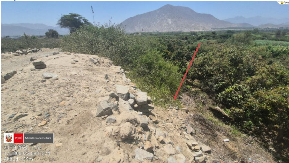
Imagen 01: vista detalle del lado norte donde las áreas agrícolas están menoscabando directamente a los muros arquitectónicos prehispánicos.