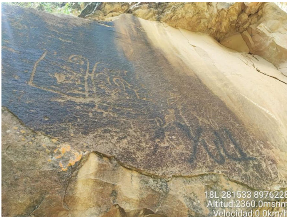
Imagen 04: vista a detalle de los petroglifos con diseños antropomorfos.