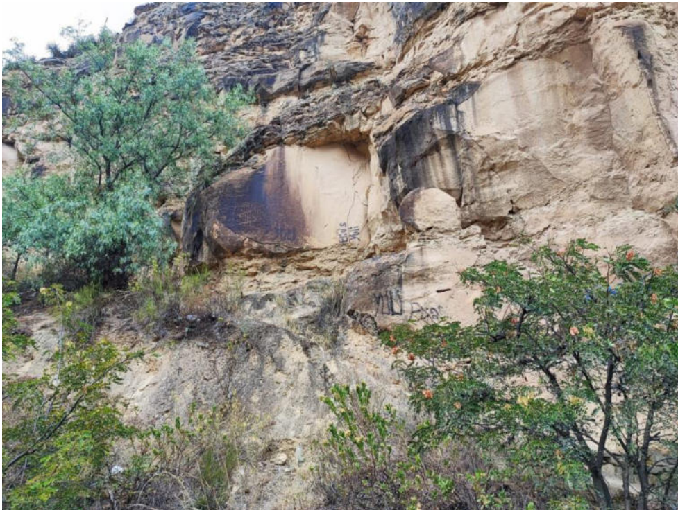
Imagen 05: vista panorámica del paisaje arqueológico.

SUBDIRECCIÓN DE PATRIMONIO CULTURAL E INDUSTRIAS CULTURALES E INTERCULTURALIDAD