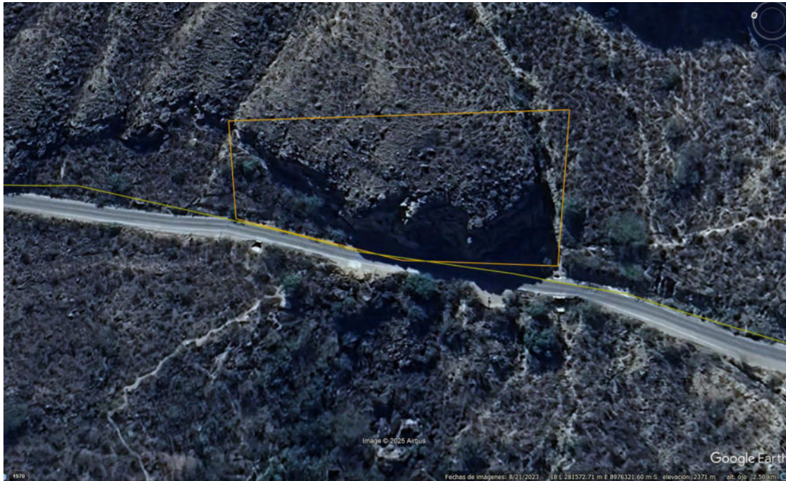
Imagen 07: vista satelital del polígono del paisaje arqueológico Petroglifos de Yunguilla.

SUBDIRECCIÓN DE PATRIMONIO CULTURAL E INDUSTRIAS CULTURALES E INTERCULTURALIDAD