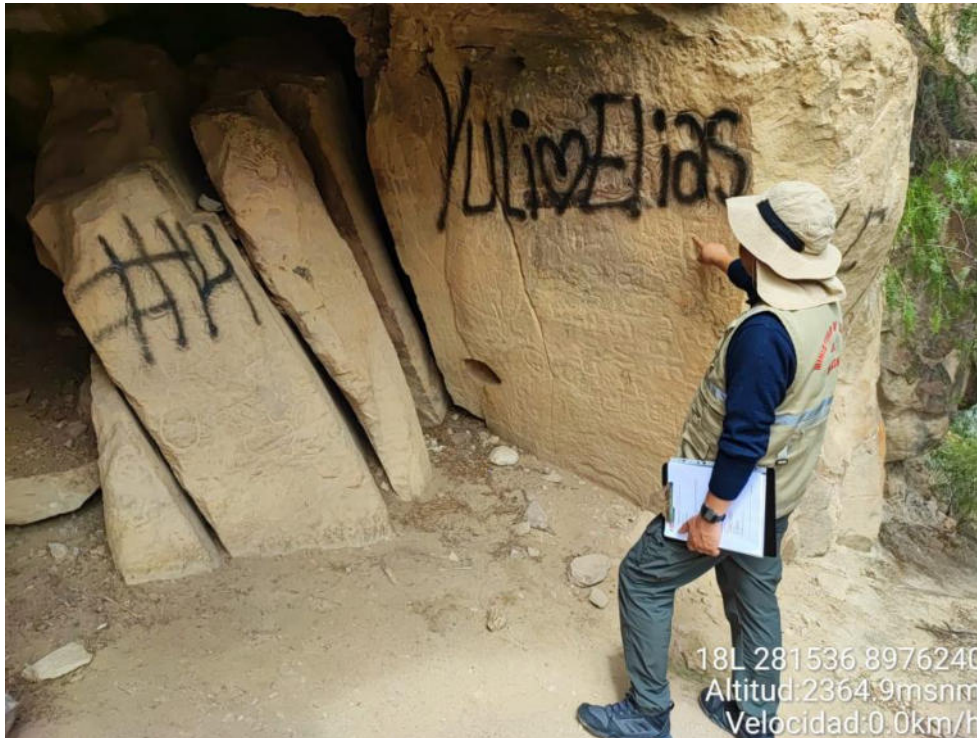
Imagen 03: vista panorámica de los grafitis al interior de la cueva afectando directamente a los petroglifos.

SUBDIRECCIÓN DE PATRIMONIO CULTURAL E INDUSTRIAS CULTURALES E INTERCULTURALIDAD