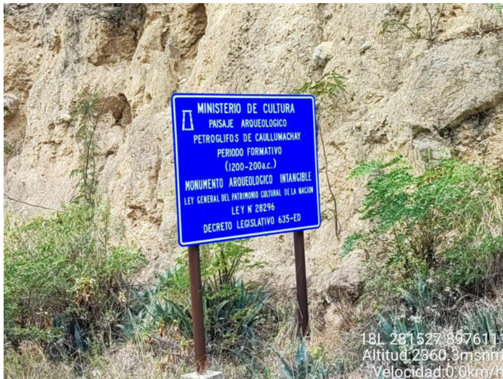
Imagen 06: panel aéreo donde indica la intangibilidad del área.