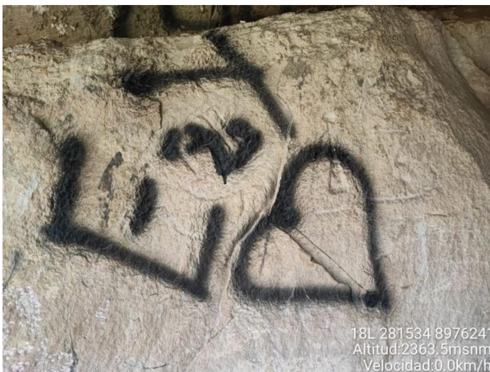
Imagen 02: vista a detalle de pinturas con de aerosol.