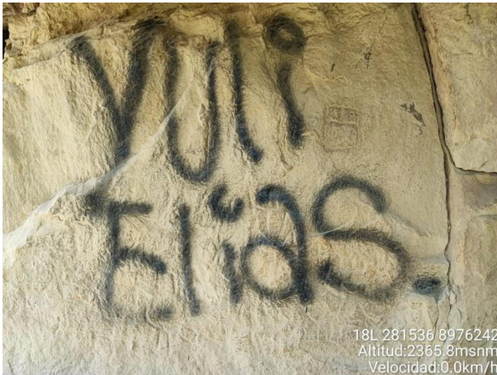
Imagen 01: vista a detalle de grafitis sobre los petroglifos.