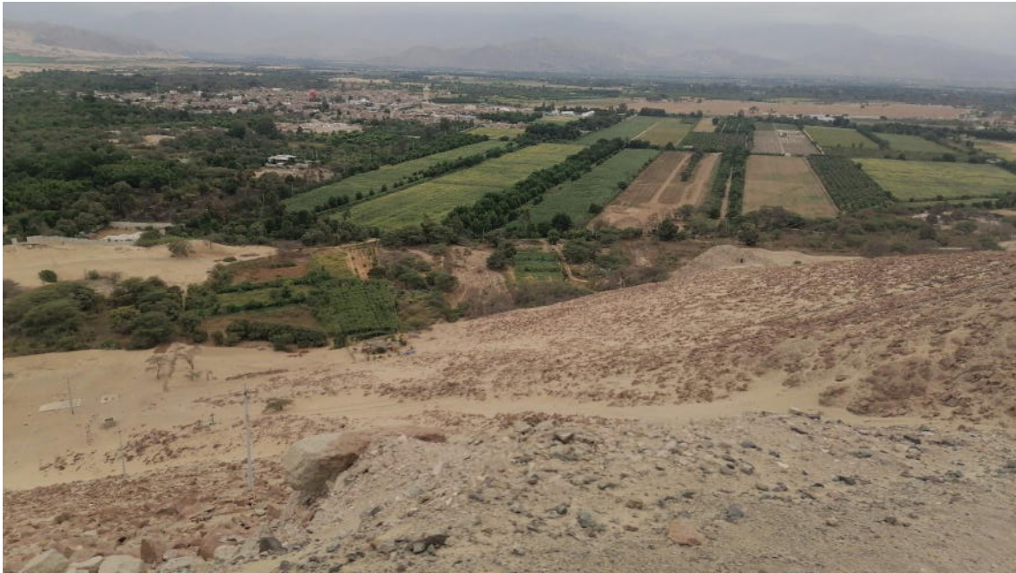
Foto 2: vista panorámica de la expansión agrícola donde han plantado árboles para delimitar un área de terreno.