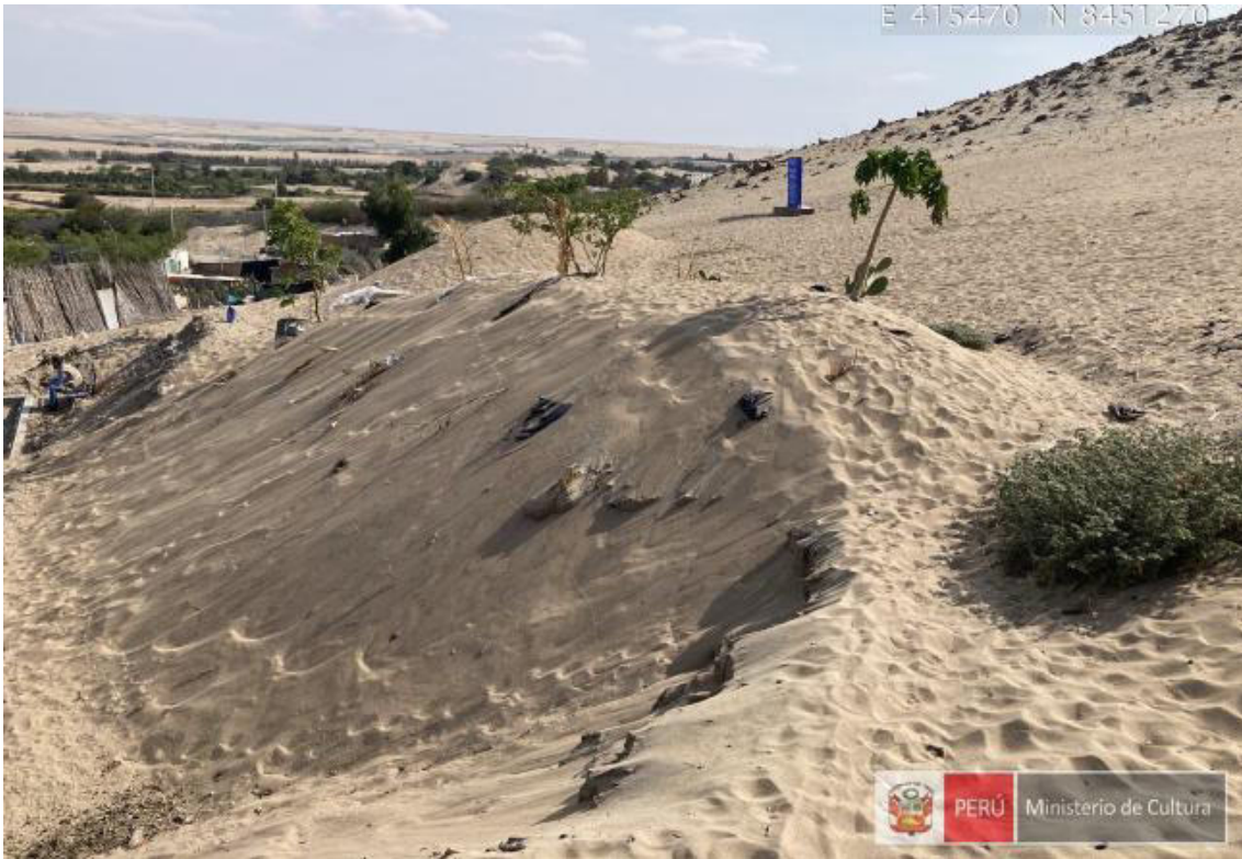
Foto 4. vista de la afectación por invasión donde han destruido hitos.