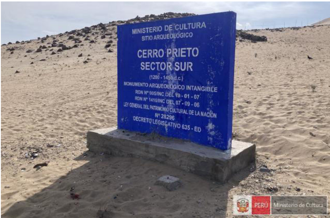
Foto 05. Vista de detalle de uno de los paneles de concreto donde indica su intangibilidad del sitio arqueológico Cerro Prieto.