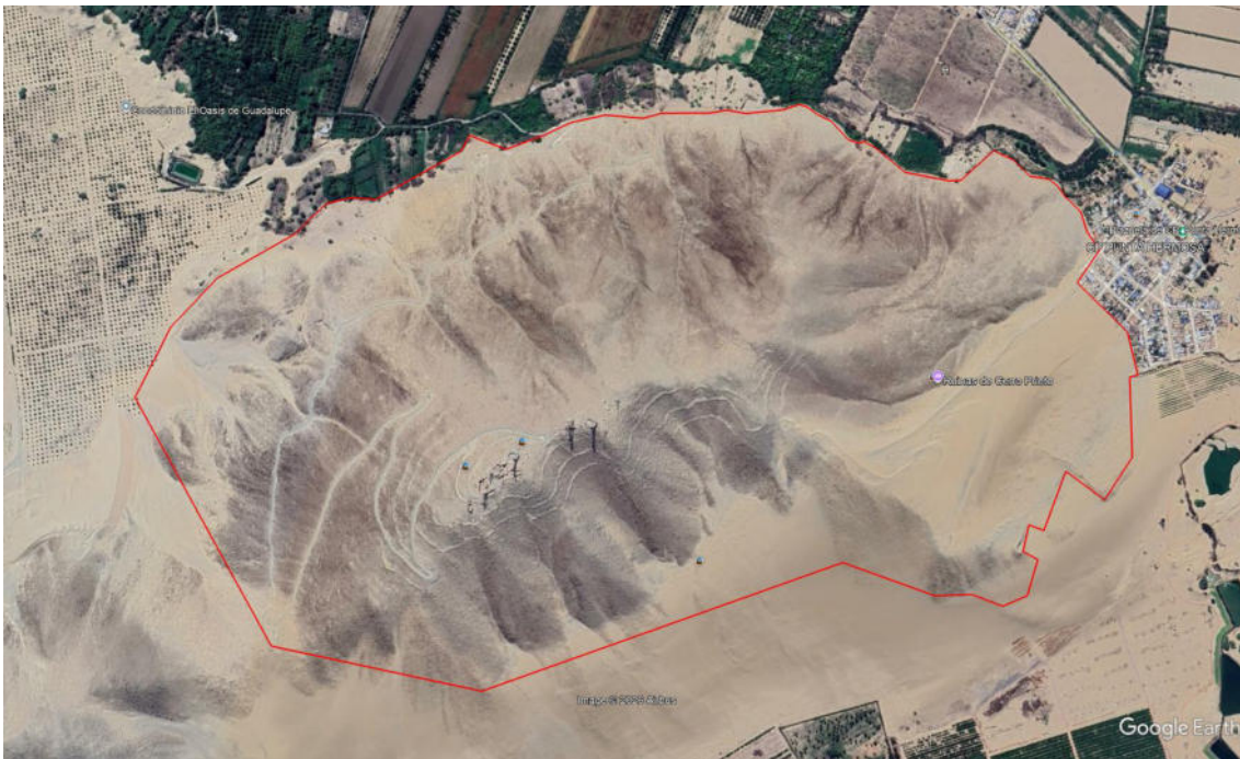
Foto 07. Vista Google Earth. El polígono rojo indica la propuesta para protección provisional del Sitio Arqueológico Cerro Prieto.