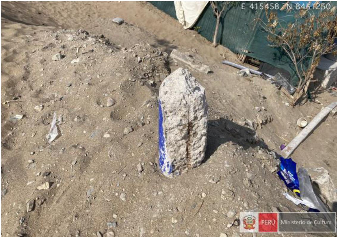
Foto 06. Vista de detalle de uno de los hitos que han sido sacados y otros que han sido destruidos.