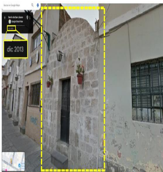
Imagen de Google Earth de diciembre del año 2013, en la cual se aprecia el estado del inmueble, previo a los trabajos ejecutados