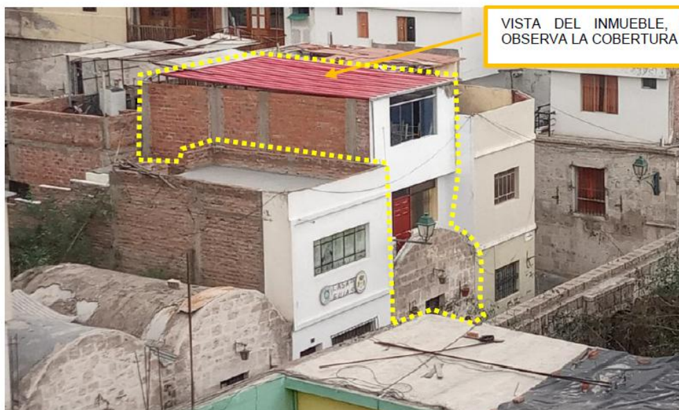
Imagen del inmueble, donde se observa la cobertura metálica de calaminón, sobre el tercer nivel, que genera una desconexión material con el entorno histórico del sector

VISTA DEL INMUEBLE, DONDE SE OBSERVA LA COBERTURA METALICA.