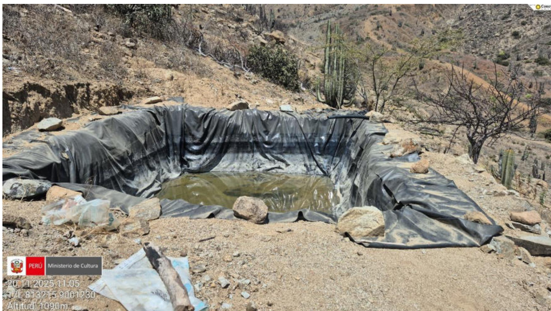
Imagen 01: vista a detalle de construcción de reservorio de agua de material geomembrana.

SUBDIRECCIÓN DE PATRIMONIO CULTURAL E INDUSTRIAS CULTURALES E INTERCULTURALIDAD