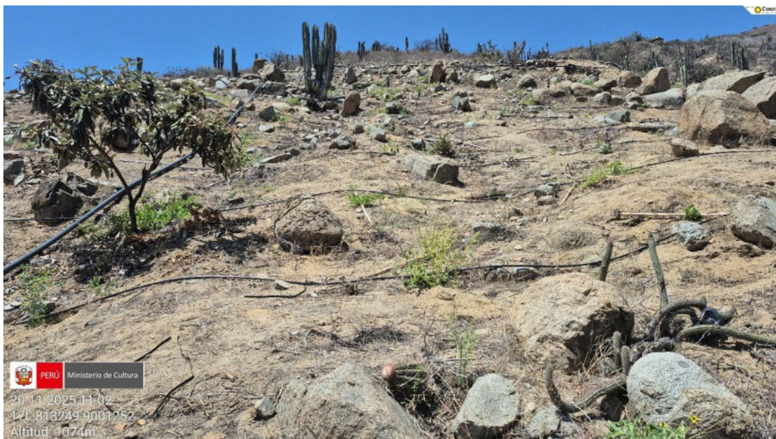
Imagen 03: se observa trabajos de arado de suelo entre ellas plantaciones y el tendido de manguera.