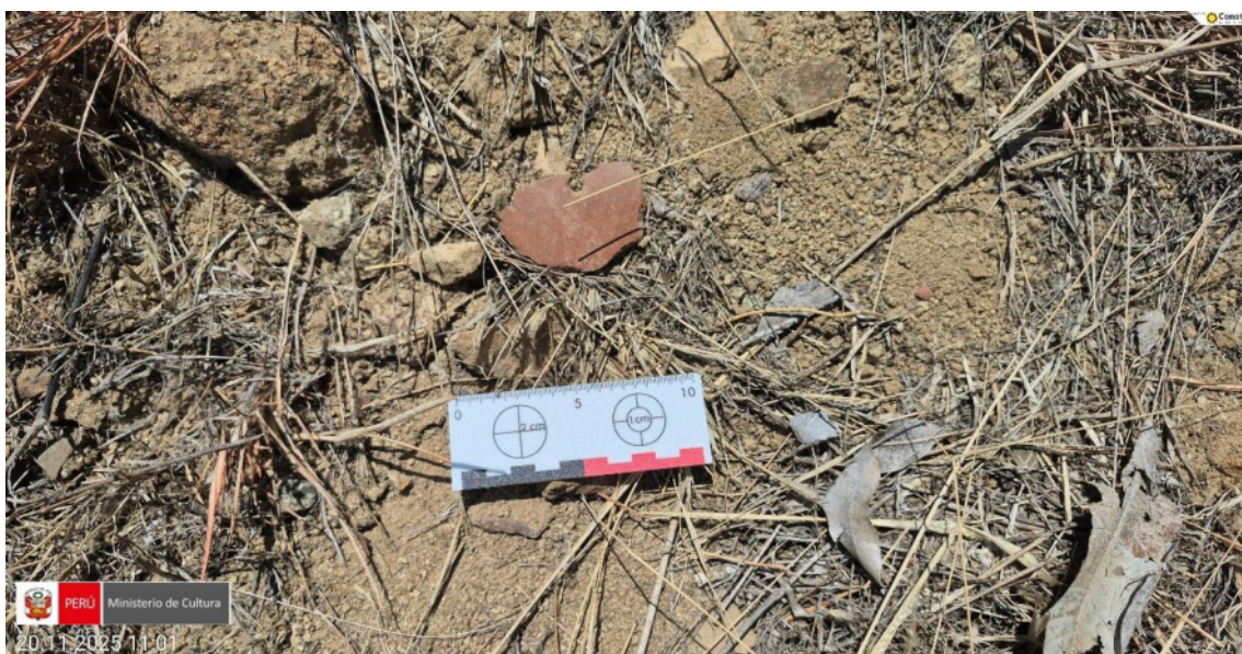
Imagen 04: vista a detalle de fragmento de cerámica con un incisión al borde del cuerpo