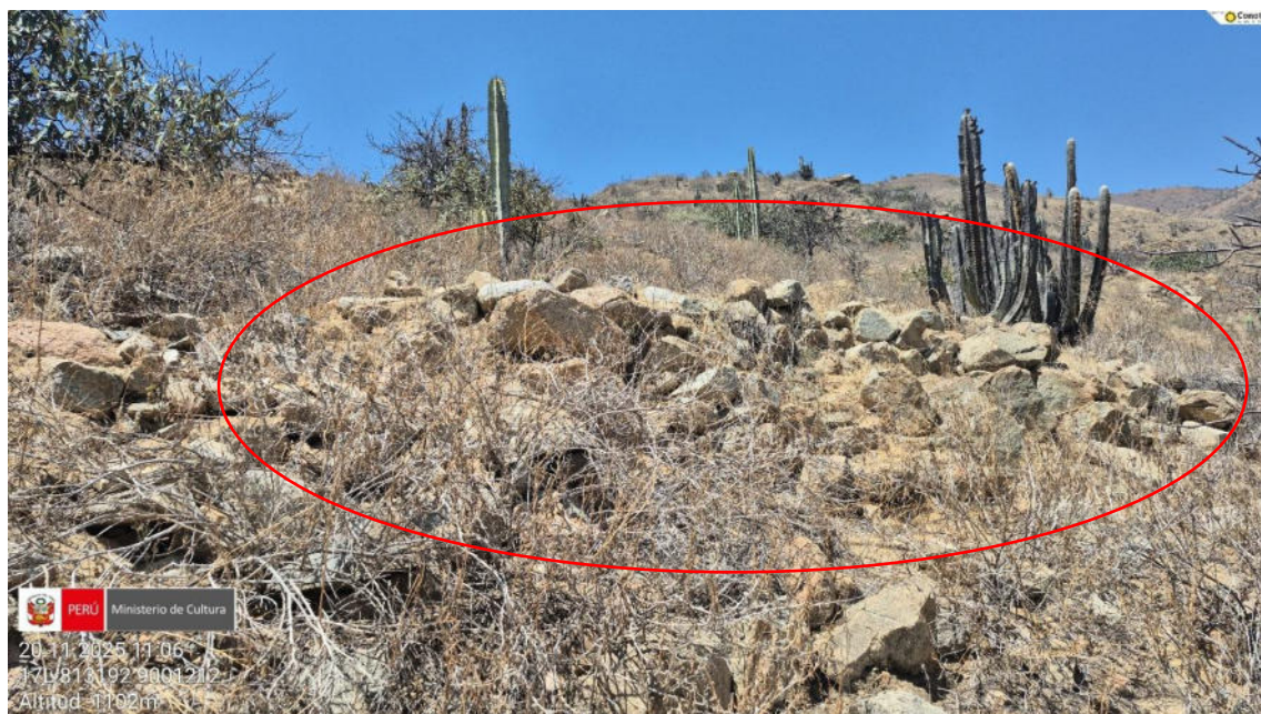
Imagen 05: vista panorámica de muros arquitectónicos emplazado hacia la ladera.

SUBDIRECCIÓN DE PATRIMONIO CULTURAL E INDUSTRIAS CULTURALES E INTERCULTURALIDAD