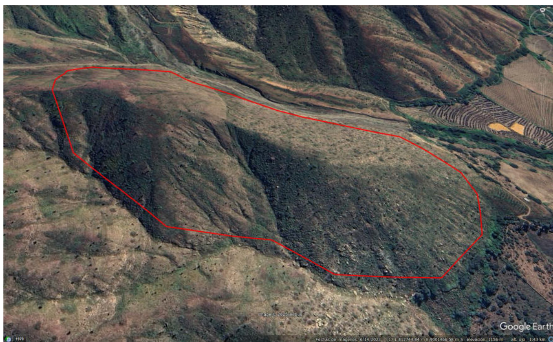
Vista satelital del polígono del sitio arqueológico Cerro Naranjo