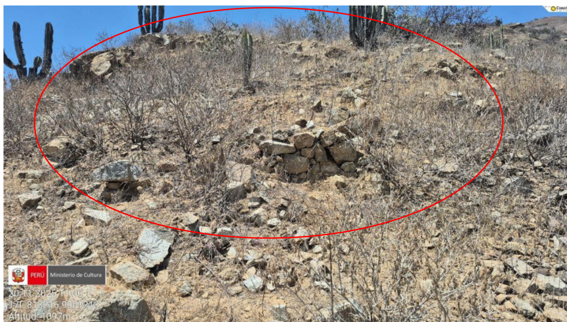
Imagen 06: vista de construcciones a modo de aterrazamientos.