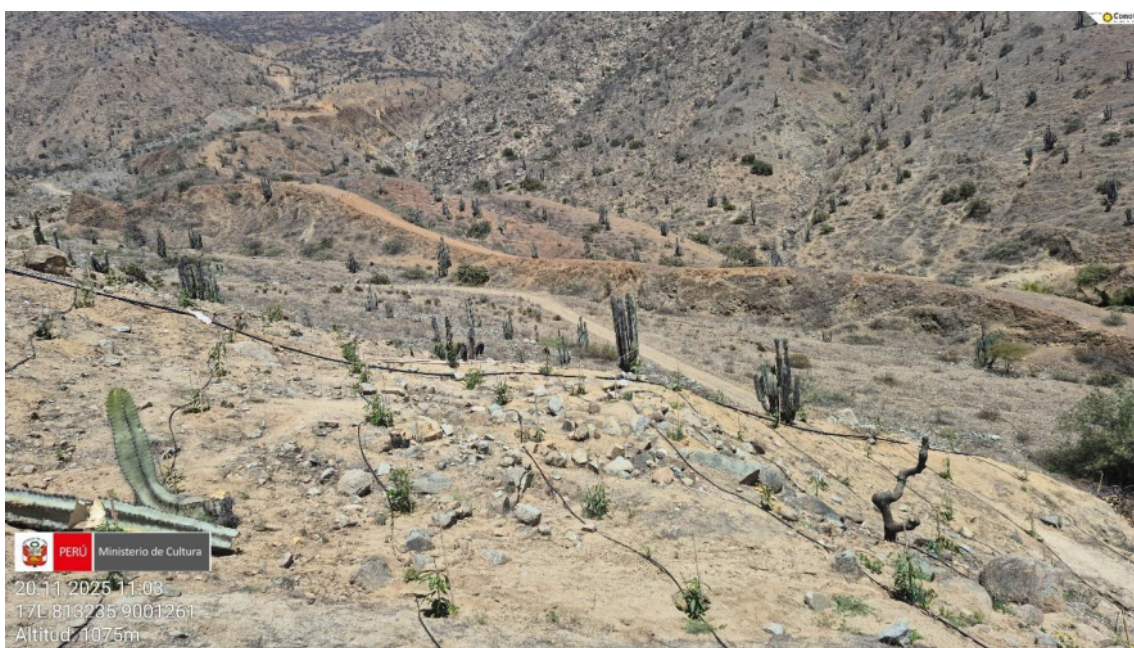
Imagen 02: vista panorámica de plantación de mango y el tendido de manguera de goteo.