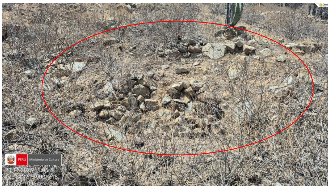
Imagen 07: vista panorámica de restos arquitectónicos en el área.

SUBDIRECCIÓN DE PATRIMONIO CULTURAL E INDUSTRIAS CULTURALES E INTERCULTURALIDAD