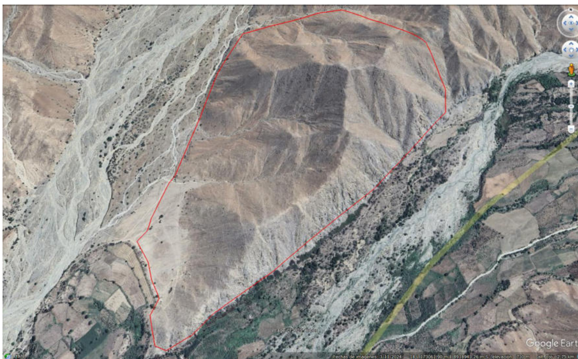
Imagen 08: vista satelital de la ubicación del sitio arqueológico Muchipampa.