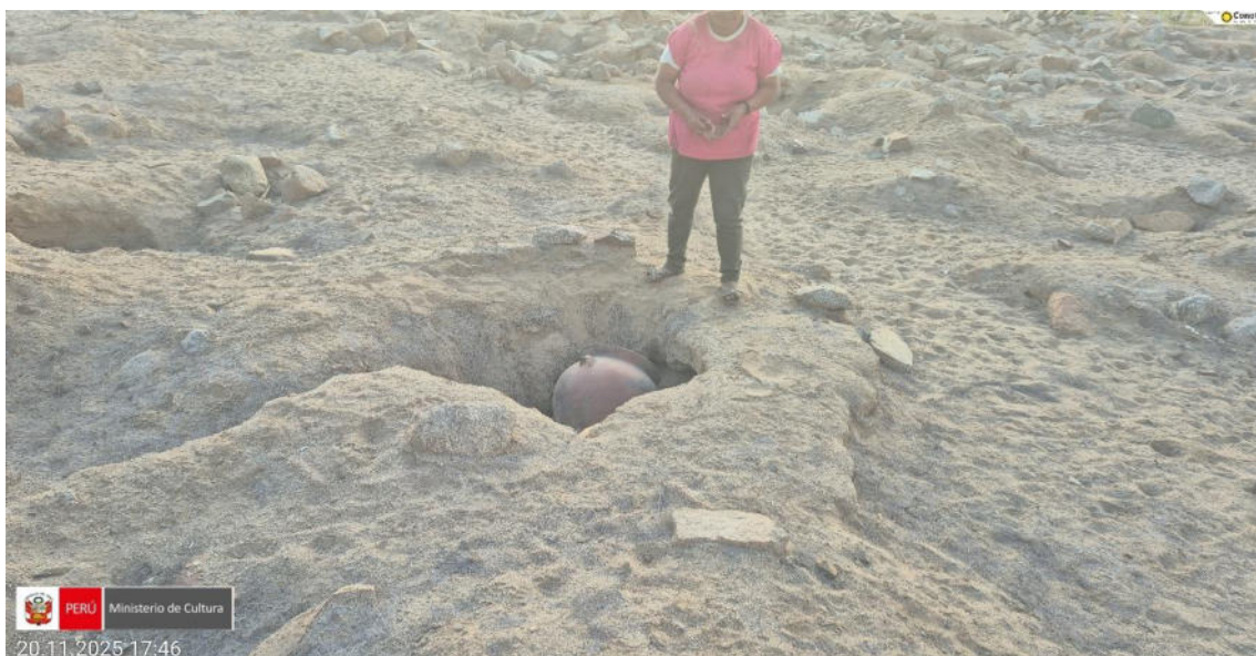
Imagen 06: vista panorámica de una vasija prehispánica producto de huaqueo en la zona arqueológica.