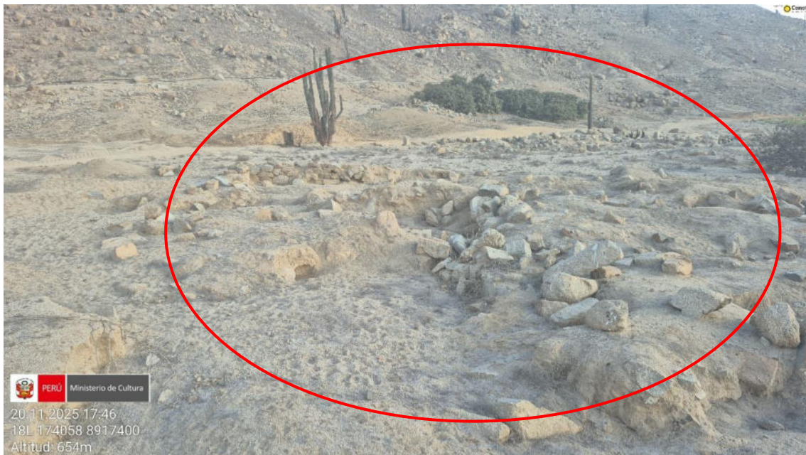
Imagen 03: vista general de la apertura de nueva vía carrozable.

PERÚ Ministerio de Cultura 20.11.2025 17:46 18L 174058 8917400 Altitud: 654m