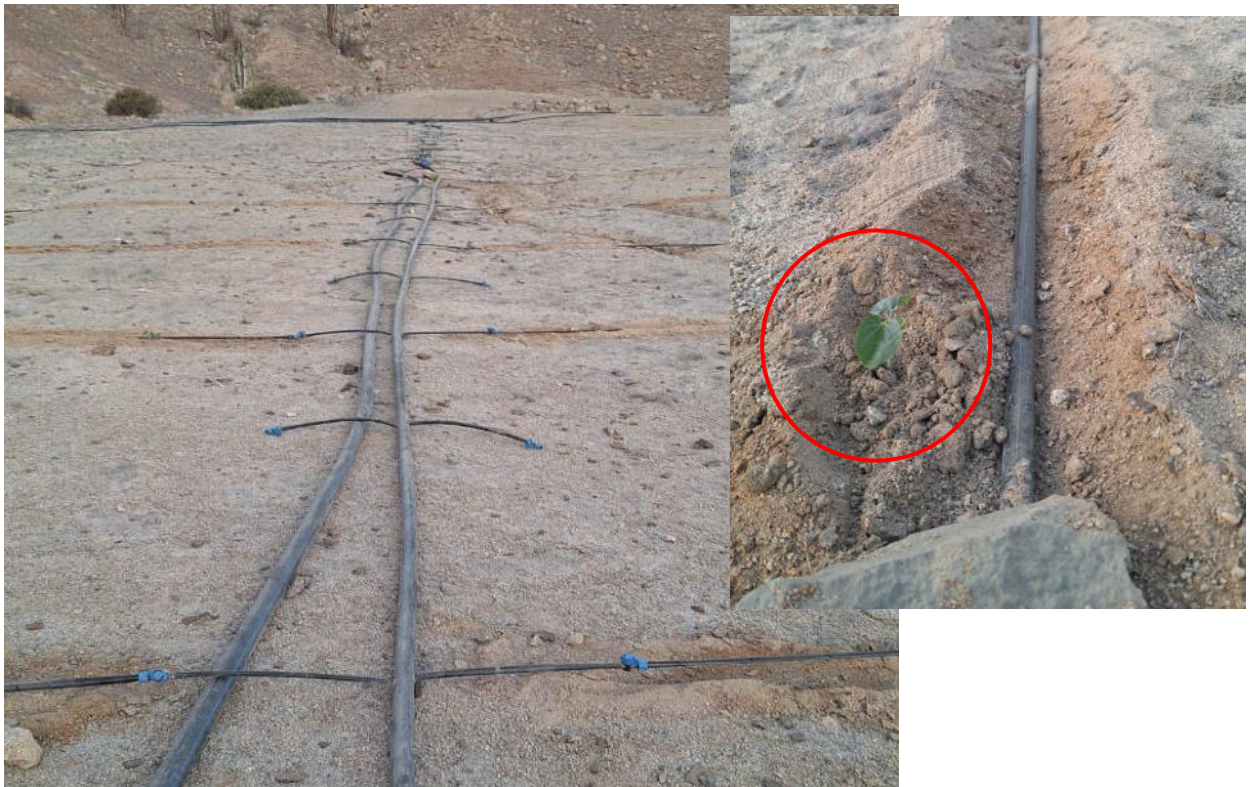
Imagen 02: a detalle de la instalación de manguera de goteo para el regadío de plantaciones temporales.