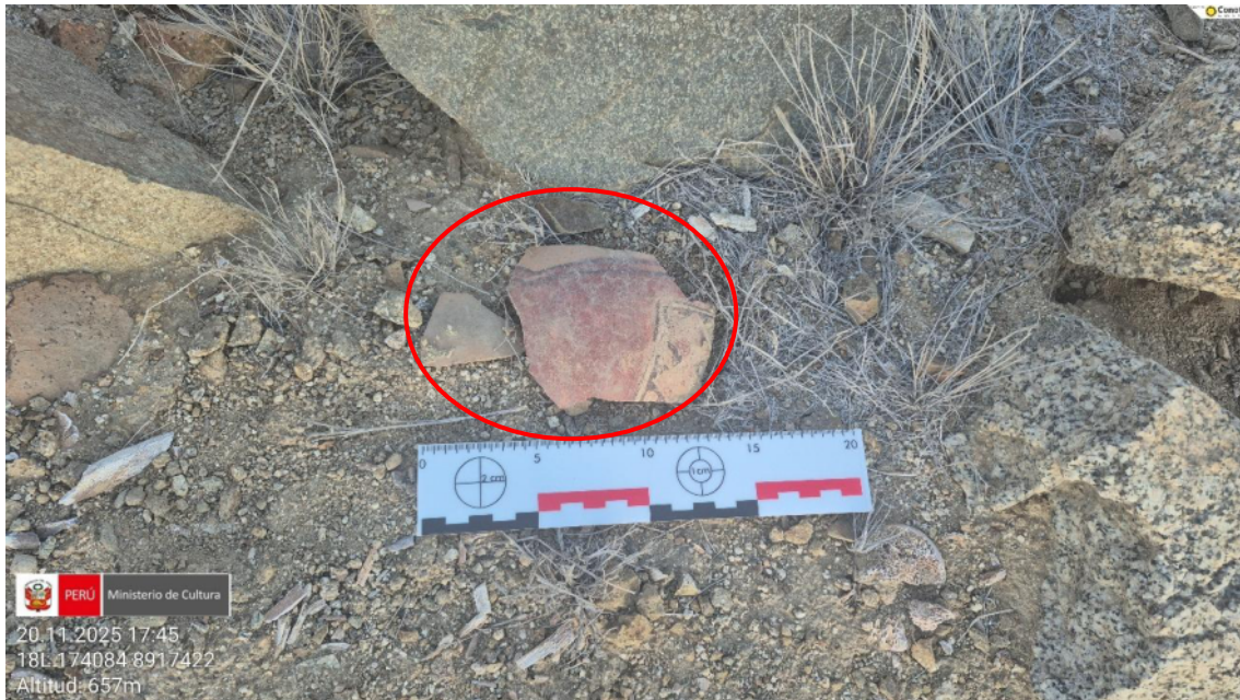
Imagen 07: la dispersión de fragmentos de cerámica en la zona es abundante de manera que presentan figuras y diseños geométricos.

SUBDIRECCIÓN DE PATRIMONIO CULTURAL E INDUSTRIAS CULTURALES E INTERCULTURALIDAD