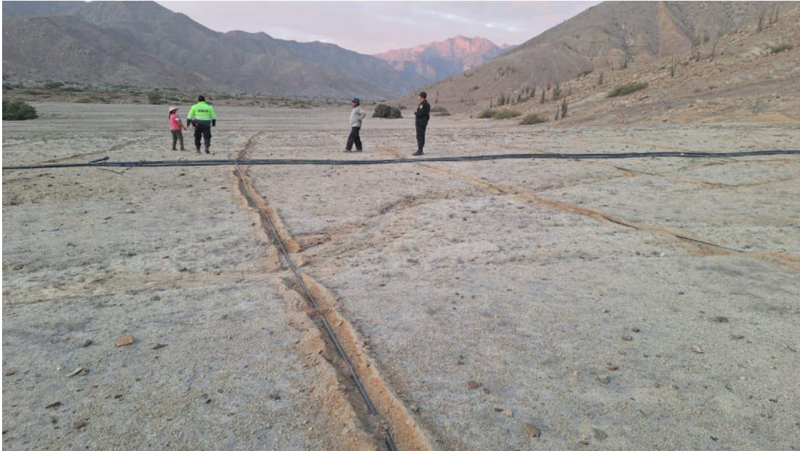
Imagen 01: vista panorámica del arado del suelo y el tendido de manguera.