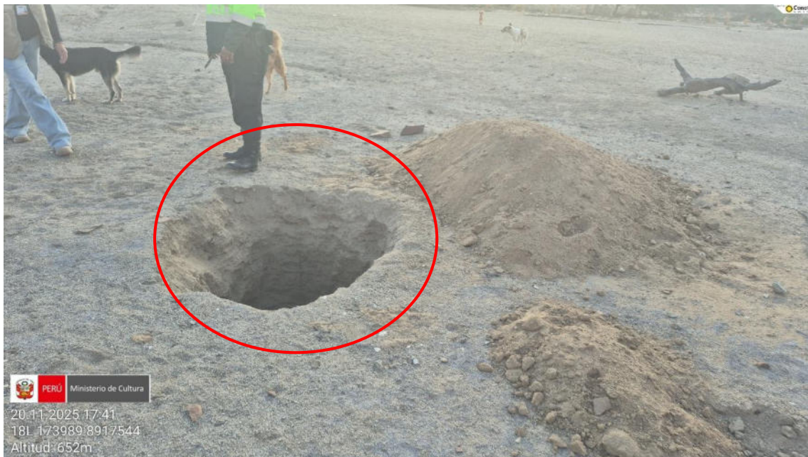
Imagen 05: vista a detalle de excavación del suelo con fines de huaqueo.

SUBDIRECCIÓN DE PATRIMONIO CULTURAL E INDUSTRIAS CULTURALES E INTERCULTURALIDAD