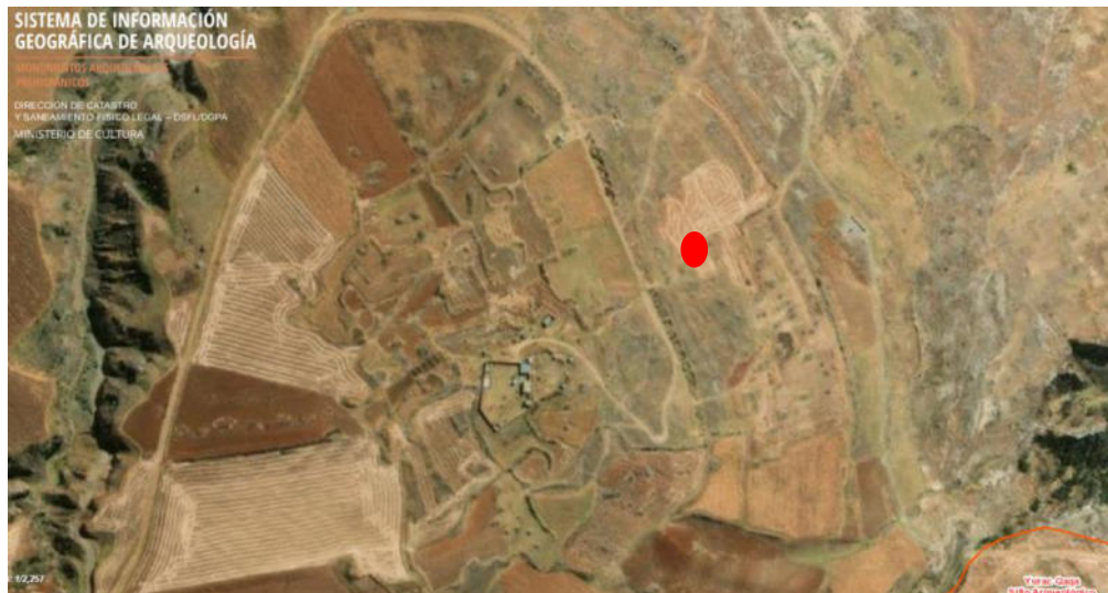
Imagen 1. Área de ubicación del sitio arqueológico Huancas de la Cruz.