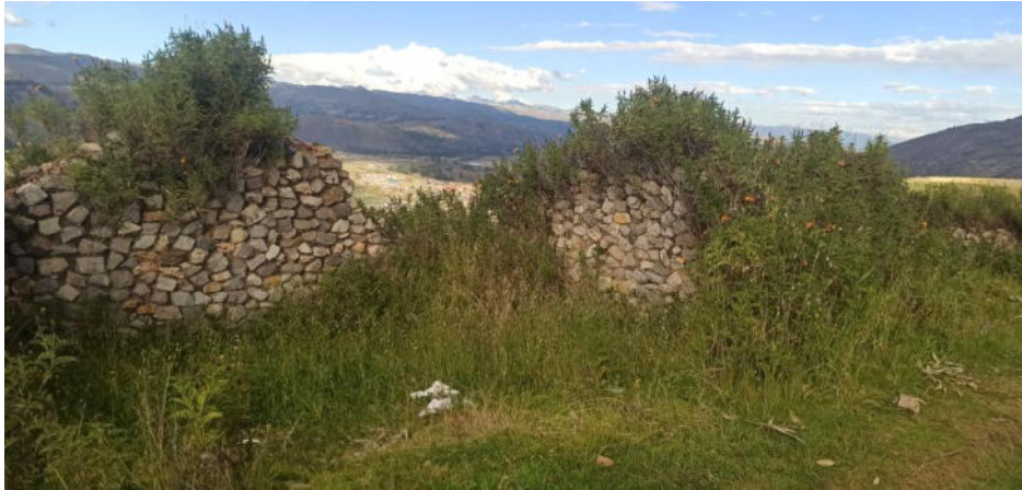
Foto 3. Vista de los muros de las estructuras arquitectónicas de planta rectangular cubierto por maleza.