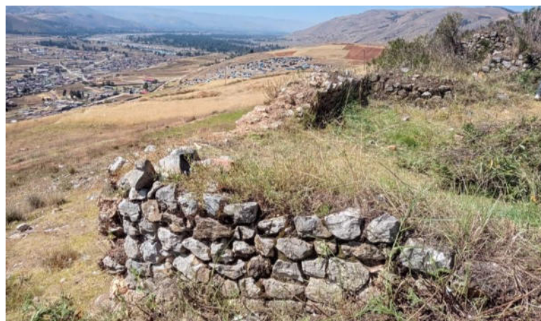
Foto 2. Vista del muro de una estructura arquitectónica de planta rectangular en regular estado de conservación.