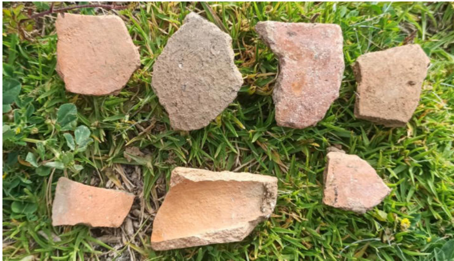
Foto 4. Vista de fragmentos de cerámica superficial del sitio arqueológico de Huancas de la Cruz.