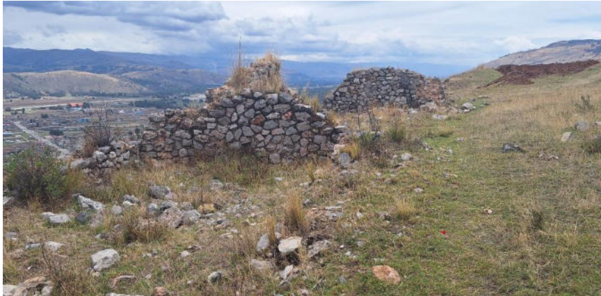
Foto 6. Vista del muro de una estructura arquitectónica de planta rectangular en regular estado de conservación