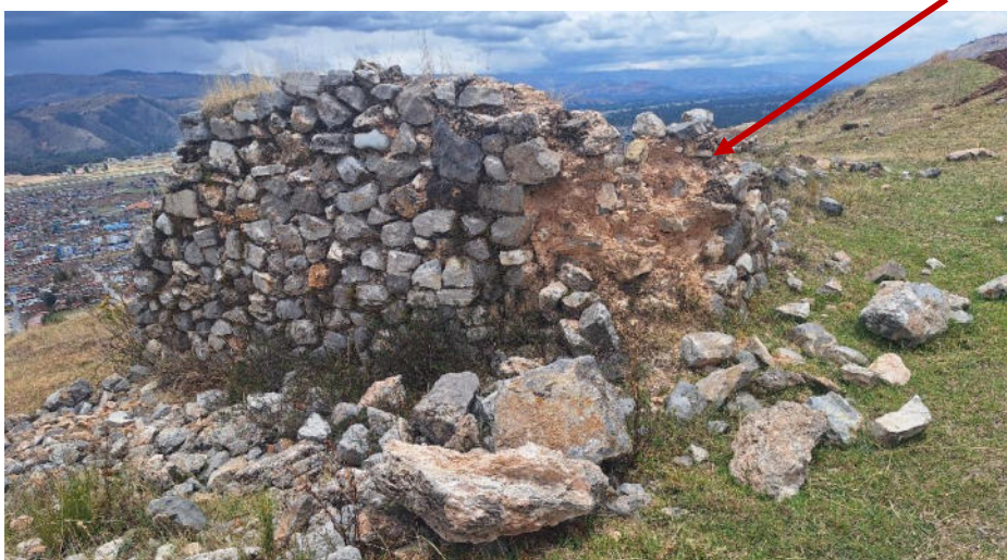
Foto 5. Vista del muro de una estructura arquitectónica de planta rectangular en regular estado de conservación.