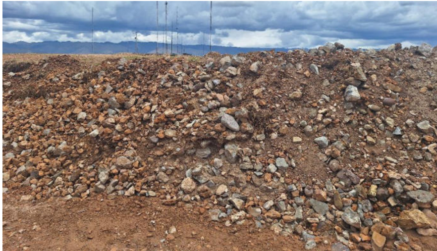
Foto 7. Vista de la remoción de tierra en el área 1 donde se evidencia piedras sueltas.