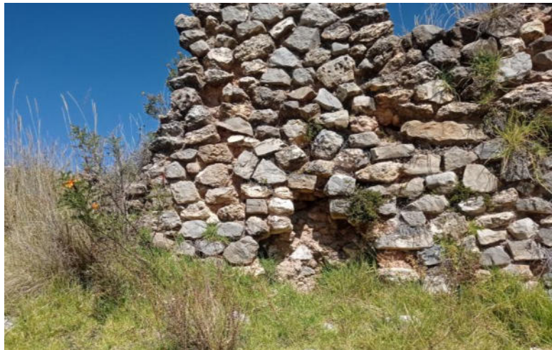
Foto 1. Vista del muro de una estructura arquitectónica de planta rectangular en regular estado de conservación.