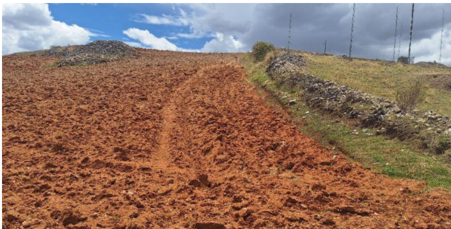
Foto 8. Vista de la remoción de tierra en el área 2 las cuales se encuentran muy próximos a Colcas.