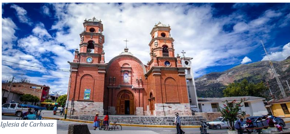
Iglesia de Carhuaz