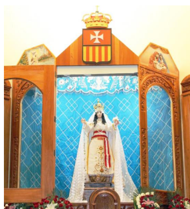
Virgen de las Mercedes