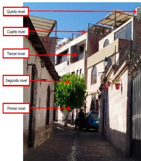
Imagen del 18.02.25, donde se aprecia que, si bien la ampliación del tercer nivel se alinea verticalmente a la fachada, no es homogénea respecto a los niveles inferiores, ya que en los vanos del primer y segundo nivel predominan los llenos, al ser más pequeños respecto de los vanos del tercer nivel, donde predomina el vacío

Imagen del inmueble del 22.05.25, donde se aprecia la alteración no autorizada