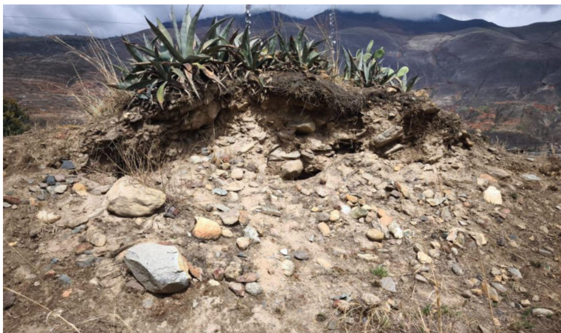
Foto N° 08.- Fotografía panorámica del sitio arqueológico Jancao (Sector I), ubicado en el distrito de Amarilis, provincia de Huánuco de la región Huánuco. Donde se observa el estado en el que se encuentra.