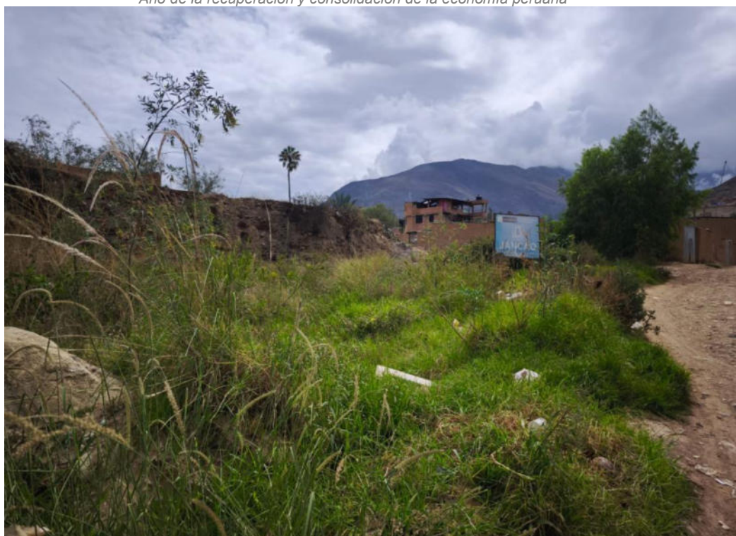
Foto N° 01.- Fotografía panorámica del sitio arqueológico Jancao (Sector I), ubicado en el distrito de Amarilis, provincia de Huánuco de la región Huánuco. Donde se observa el estado en el que se encuentra.

"Decenio de la Igualdad de Oportunidades para Mujeres y Hombres" "Año de la recuperación y consolidación de la economía peruana"