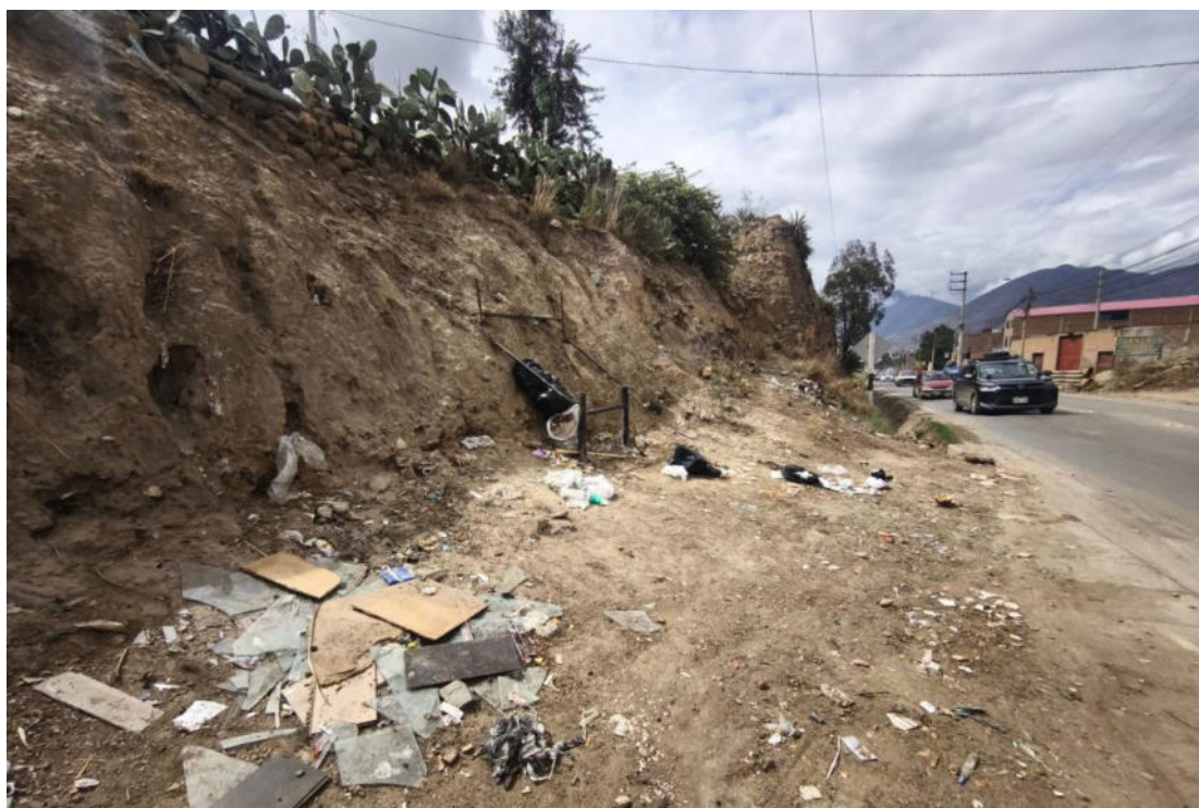
Foto N° 09.- Fotografía panorámica del sitio arqueológico Jancao (Sector I), ubicado en el distrito de Amarilis, provincia de Huánuco de la región Huánuco. Donde se observa el estado en el que se encuentra.

"Decenio de la Igualdad de Oportunidades para Mujeres y Hombres" "Año de la recuperación y consolidación de la economía peruana"