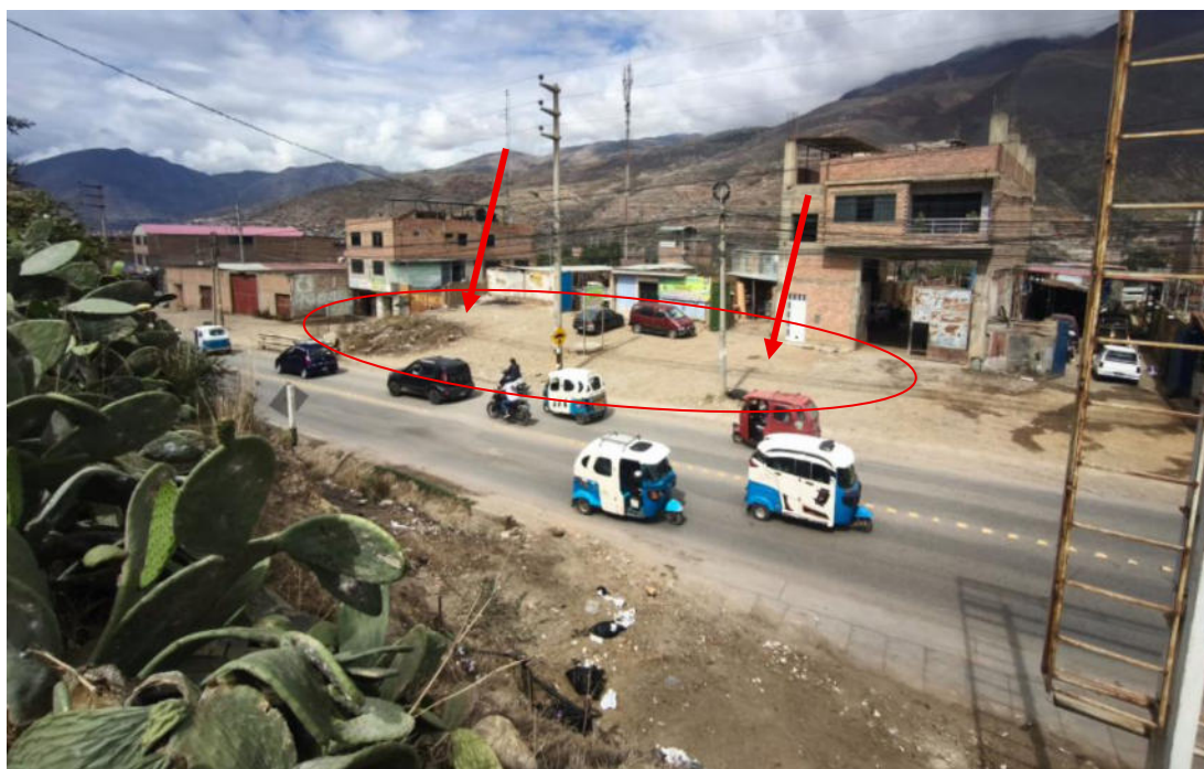
Foto N° 11.- Fotografía panorámica del sitio arqueológico Jancao (Sector II), ubicado en el distrito de Amarilis, provincia de Huánuco de la región Huánuco. Donde se observa el estado en el que se encuentra.

"Decenio de la Igualdad de Oportunidades para Mujeres y Hombres" "Año de la recuperación y consolidación de la economía peruana"