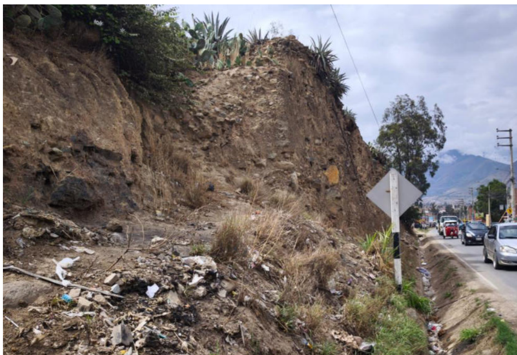
Foto N° 06.- Fotografía panorámica del sitio arqueológico Jancao (Sector I), ubicado en el distrito de