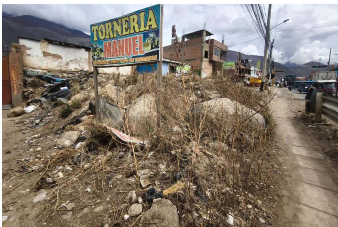
Foto N° 10.- Fotografía panorámica del sitio arqueológico Jancao (Sector II), ubicado en el distrito de Amarilis, provincia de Huánuco de la región Huánuco. Donde se observa el estado en el que se encuentra.