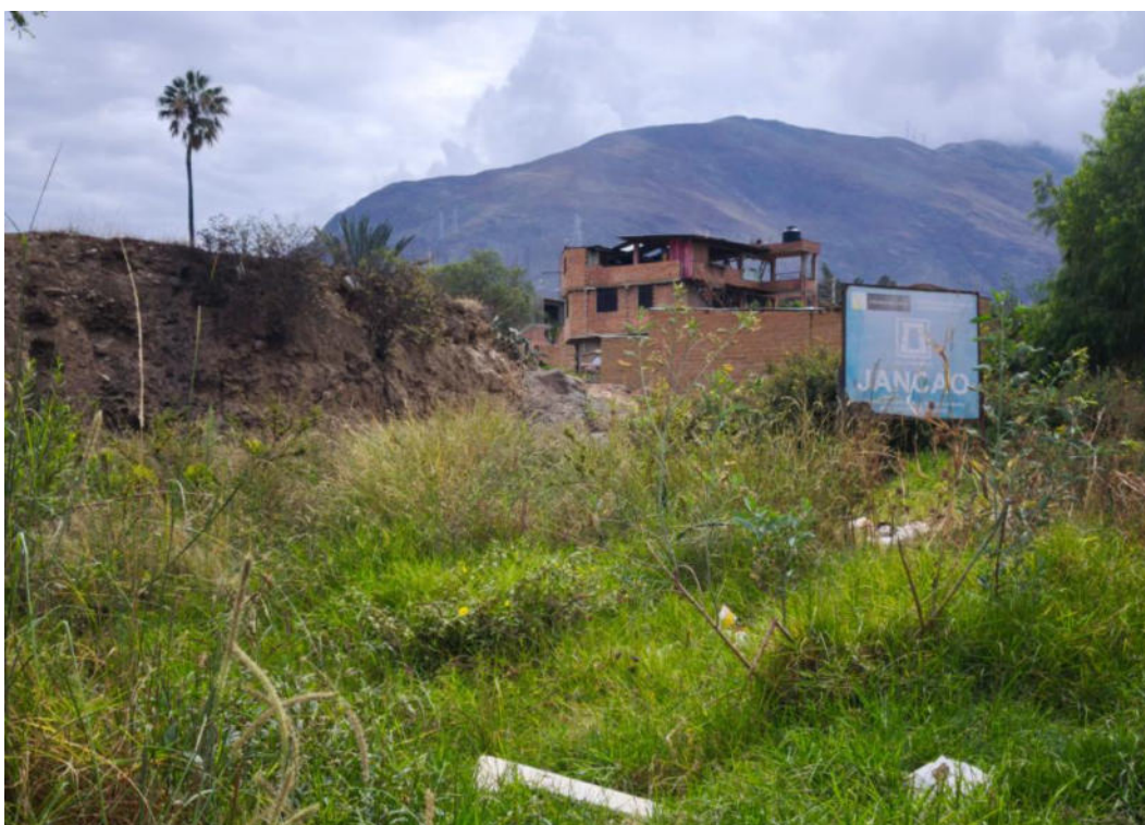
Foto N° 04.- Fotografía panorámica del sitio arqueológico Jancao (Sector I), ubicado en el distrito de Amarilis, provincia de Huánuco de la región Huánuco. Donde se observa el estado en el que se encuentra.