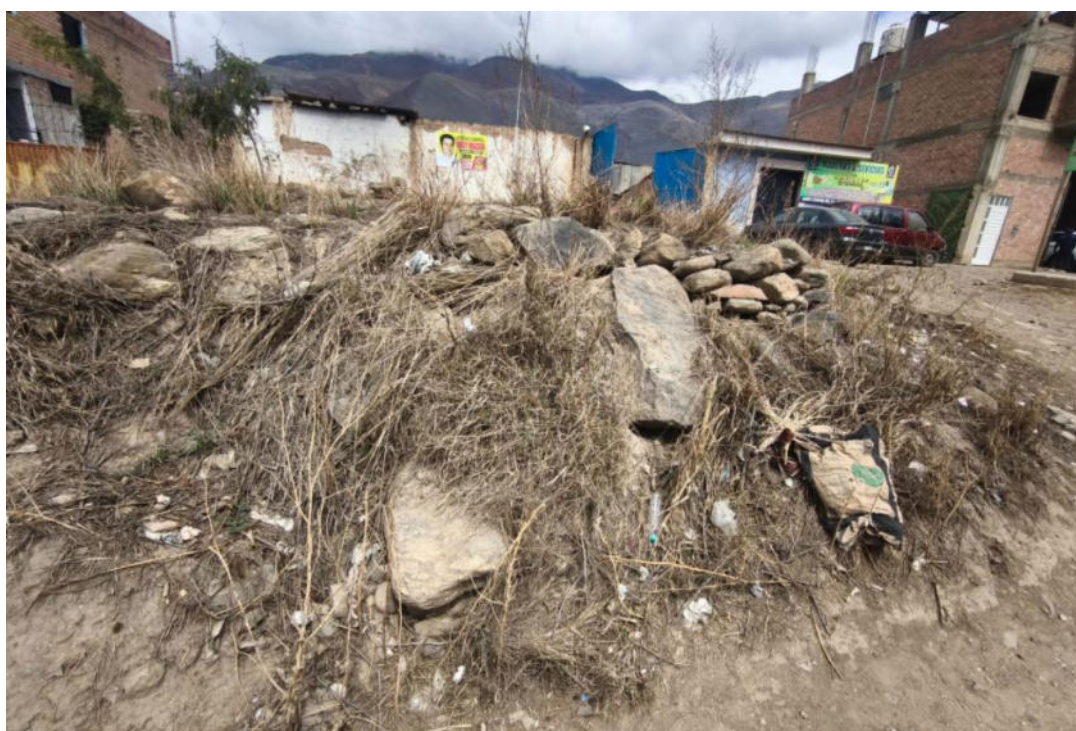
Foto N° 14.- Fotografía panorámica del sitio arqueológico Jancao (Sector II), ubicado en el distrito de Amarilis, provincia de Huánuco de la región Huánuco. Donde se observa el estado en el que se encuentra, el montículo arqueológico.