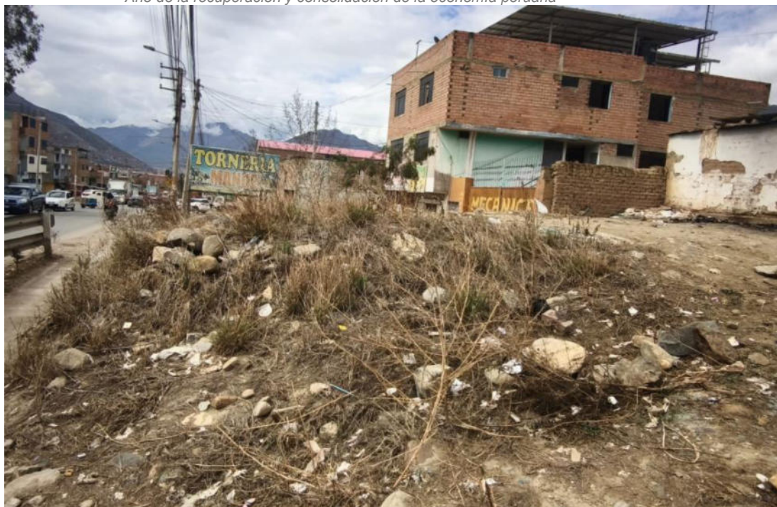
Foto N° 13.- Fotografía panorámica del sitio arqueológico Jancao (Sector II), ubicado en el distrito de Amarilis, provincia de Huánuco de la región Huánuco. Donde se observa el estado en el que se encuentra, el montículo arqueológico.

"Decenio de la Igualdad de Oportunidades para Mujeres y Hombres" "Año de la recuperación y consolidación de la economía peruana"