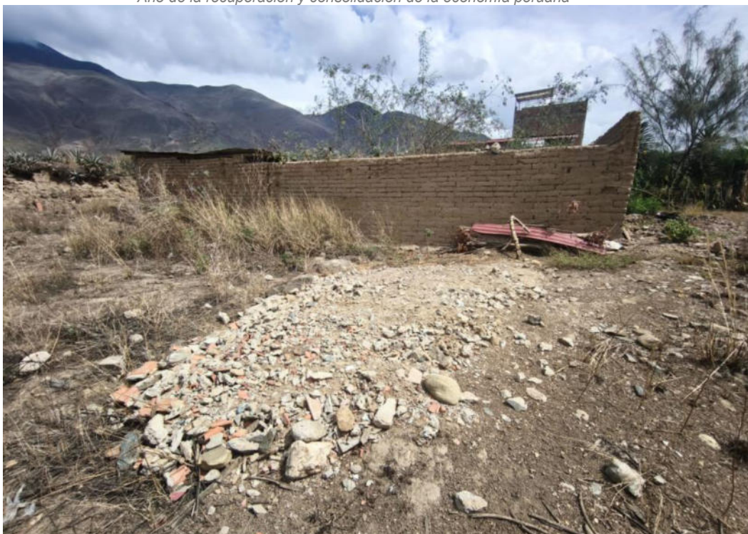
Foto N° 03.- Fotografía panorámica del sitio arqueológico Jancao (Sector I), ubicado en el distrito de Amarilis, provincia de Huánuco de la región Huánuco. Donde se observa que echaron desmante.

"Decenio de la Igualdad de Oportunidades para Mujeres y Hombres" "Año de la recuperación y consolidación de la economía peruana"