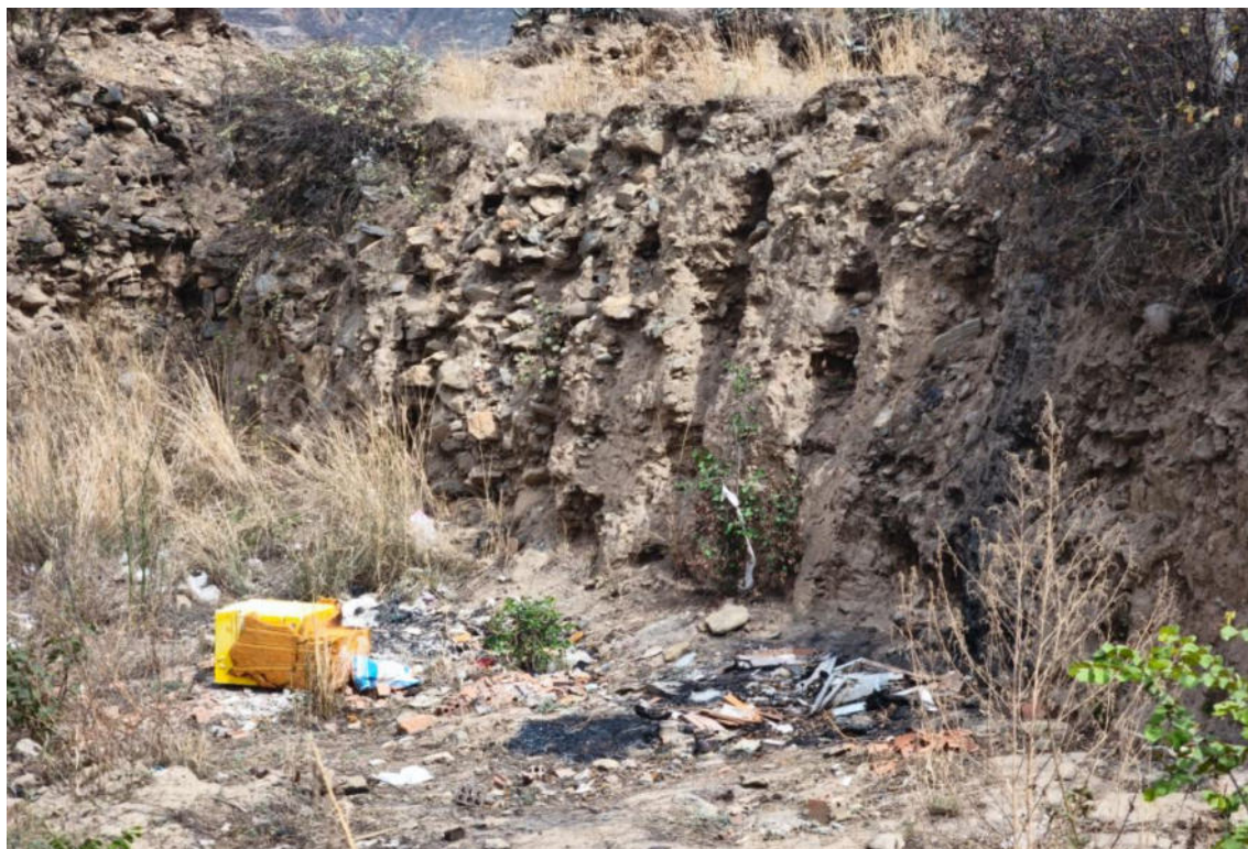
Foto N° 07.- Fotografía panorámica del sitio arqueológico Jancao (Sector I), ubicado en el distrito de Amarilis, provincia de Huánuco de la región Huánuco. Donde se observa el estado en el que se encuentra.

"Decenio de la Igualdad de Oportunidades para Mujeres y Hombres" "Año de la recuperación y consolidación de la economía peruana" Amarilis, provincia de Huánuco de la región Huánuco. Donde se observa el estado en el que se encuentra.