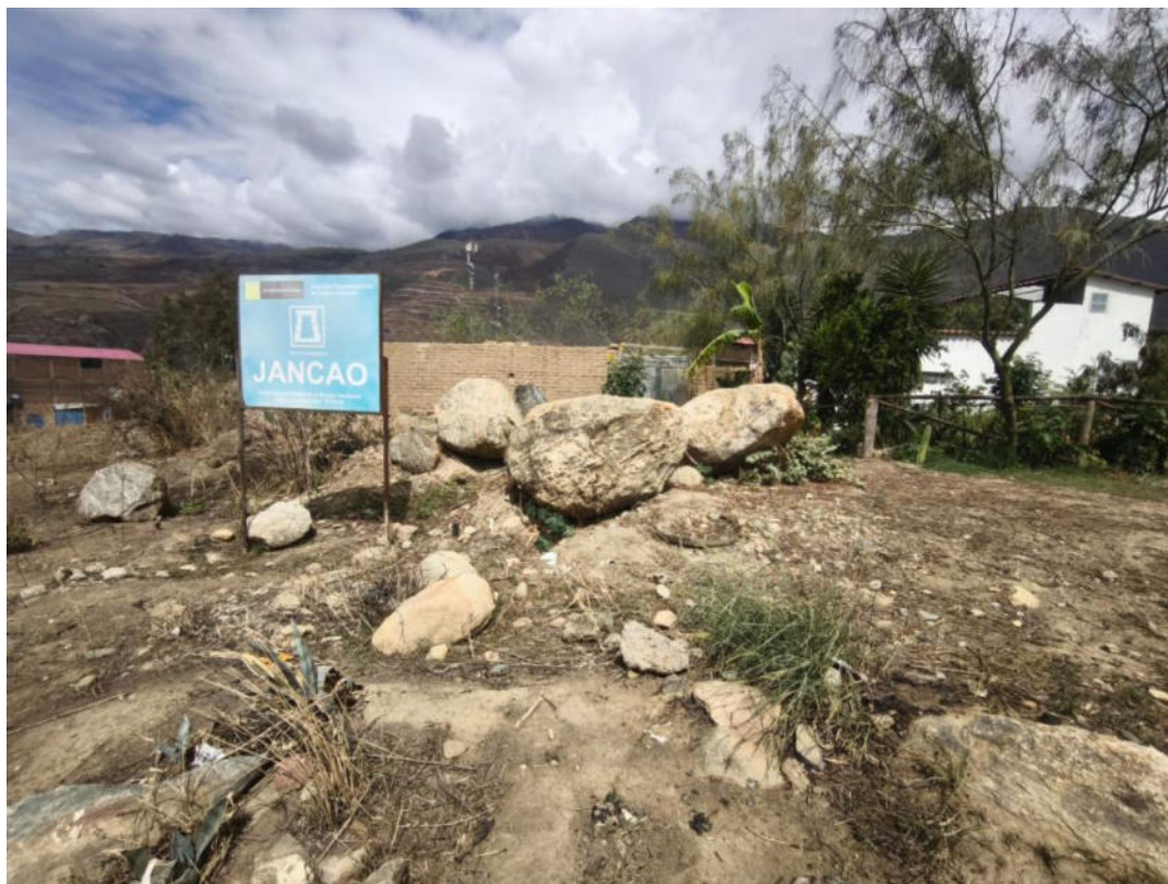
Foto N° 05.- Fotografía panorámica del sitio arqueológico Jancao (Sector I), ubicado en el distrito de Amarilis, provincia de Huánuco de la región Huánuco. Donde se observa el estado en el que se encuentra.

"Decenio de la Igualdad de Oportunidades para Mujeres y Hombres" "Año de la recuperación y consolidación de la economía peruana"