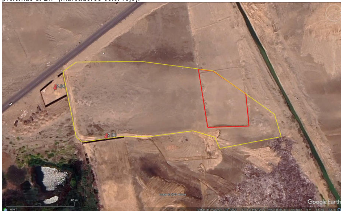
Imagen N°02: fotografía de la afectación 1, por actividades de nivelación y remoción de suelo en el sector noroeste del BIP.

Imagen N°01: fotografía satelital tomada del software Google Earth, mostrando la el polígono del BIP (color amarillo); además, afectación al interior del BIP (color rojo) y asentamiento de estructuras próximas al BIP (marcadores color rojo).