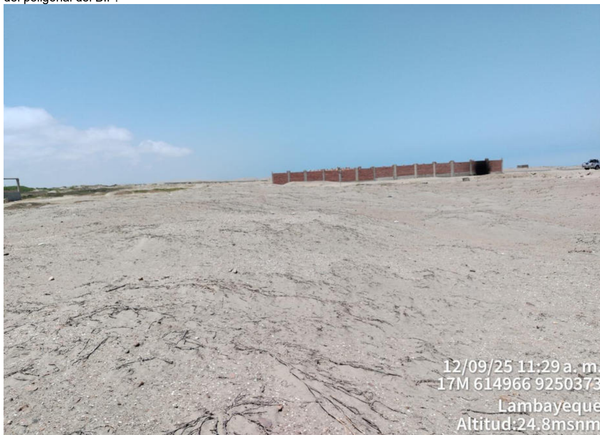
Imagen N°04: fotografía de la afectación 2, Asentamiento de estructuras de material noble en el límite sureste del poligonal del BIP.

Imagen N°03: fotografía de la afectación 2, Asentamiento de estructuras de material noble en el límite sur del poligonal del BIP.