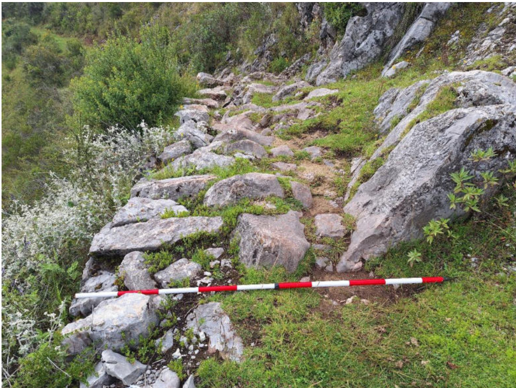
Fotografía 8 vista en detalle de la sección La Esmeralda – Soco del Camino Prehispánico revela su método constructivo. Así, en varios puntos, el ancho se define por el uso de piedras de la zona, las cuales varían en forma y tamaño.