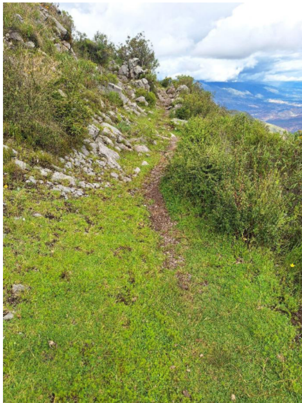
Fotografía 10 vista en detalle de la sección La Esmeralda – Soco del Camino Prehispánico revela su método constructivo. Así, en varios puntos, el ancho se define por el uso de piedras de la zona, las cuales varían en forma y tamaño.