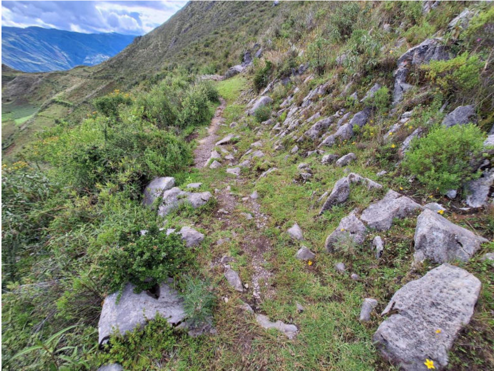
Fotografía 5 vista detallada de la sección La Esmeralda – Soco del Camino Prehispánico revela que su trazado fue cuidadosamente adaptado a la geografía y las características naturales del terreno.