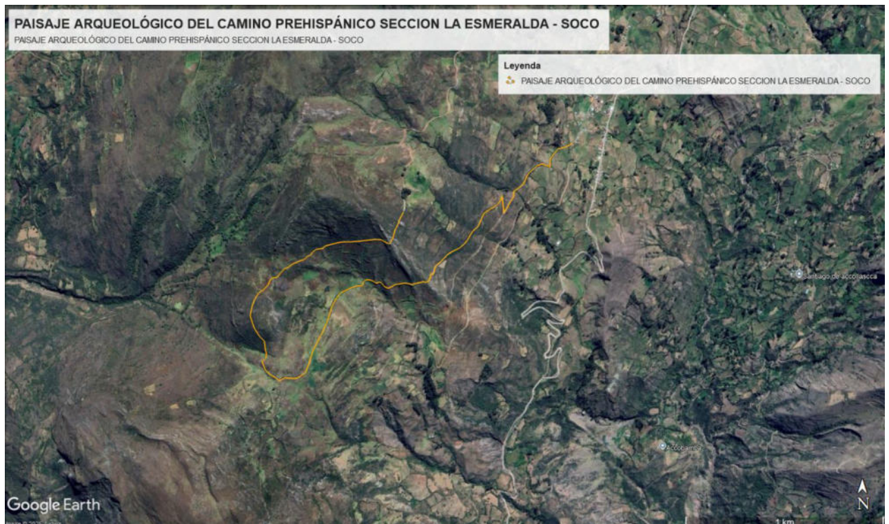
Imagen 1 vista satelital del trazo del Paisaje Arqueologico del Camino Prehispanico Seccion La Esmeralda – Soco