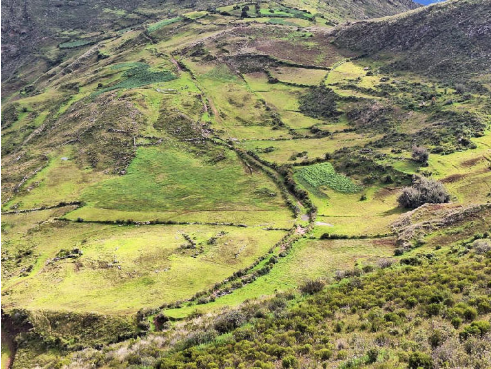
Fotografía 7 vista desde una perspectiva panorámica de la sección La Esmeralda – Soco, se puede apreciar que el Camino Prehispánico posee una doble ubicación: no solo discurre entre terrenos cultivables (chacras), sino que además en otros segmentos se extiende por las laderas de los cerros.