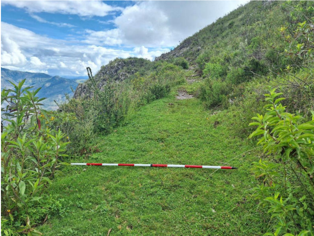
Fotografía 1 vista en detalle del ancho del Paisaje Arqueológico del Camino Prehispánico Sección La Esmeralda – Soco.