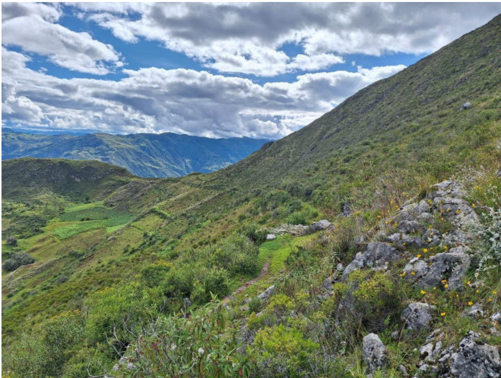
Fotografía 4 vista panorámica de la sección La Esmeralda – Soco del Camino Prehispánico muestra que su trazo bordea la falda del cerro (o ladera).