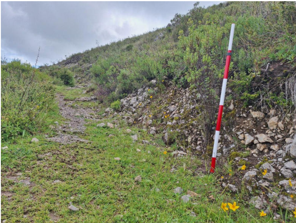
Fotografía 2 La siguiente imagen muestra un tramo bien conservado del Camino Prehispánico Sección La Esmeralda – Soco. En donde se observa el empedrado en la parte lateral, esto se puede observar en varios de los tramos del dicho camino.