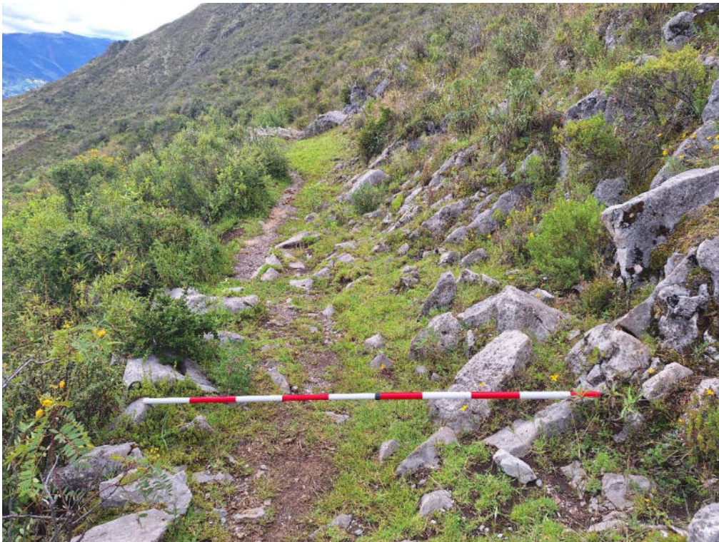
Fotografía 6 vista en detalle del Paisaje Arqueológico del Camino Prehispánico (sección La Esmeralda – Soco), se constata la adaptación del camino al entorno geográfico. Además, se observa que su ancho difiere, oscilando entre 2 y 3 metros en algunos puntos