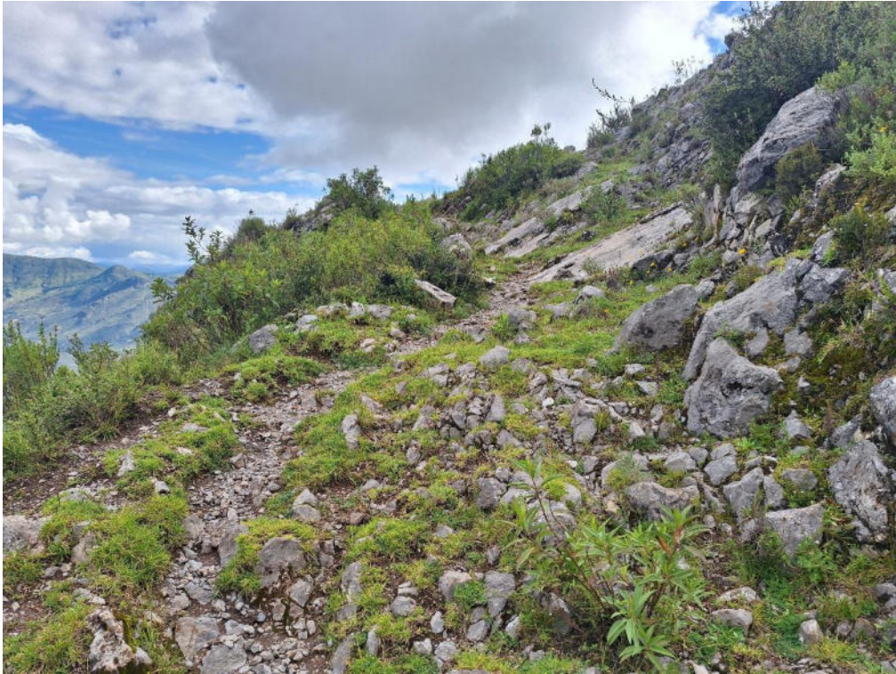
Fotografía 3 vista detallada de la sección La Esmeralda – Soco del Camino Prehispánico revela que su trazado fue cuidadosamente adaptado a la geografía y las características naturales del terreno.