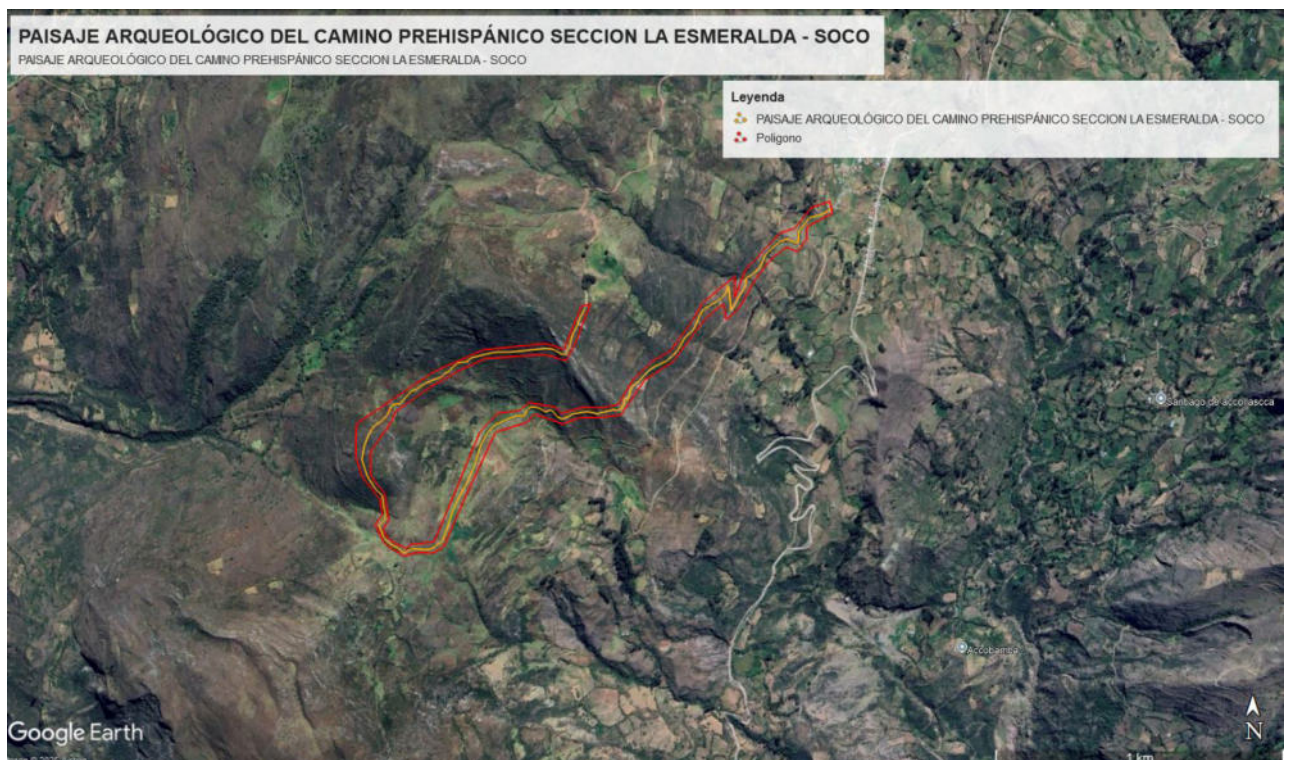
Imagen 2 vista satelital del poligono del Paisaje Arqueologico del Camino Prehispanico Seccion La Esmeralda – Soco