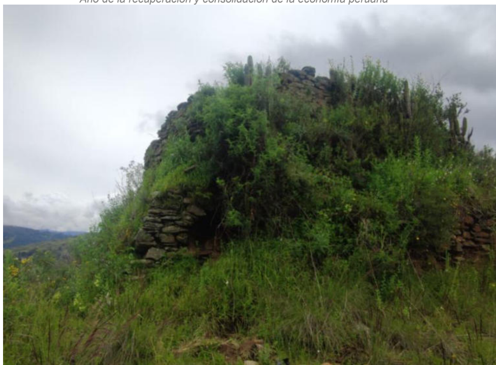
Foto N° 07.- Fotografía panorámica del sitio arqueológico Supay Punku, ubicado en el distrito de Pachas, provincia de Dos de Mayo de la región Huánuco. Se observa que parte de las estructuras arquitectónicas presentan vegetación en superficie.

"Decenio de la Igualdad de Oportunidades para Mujeres y Hombres" "Año de la recuperación y consolidación de la economía peruana"