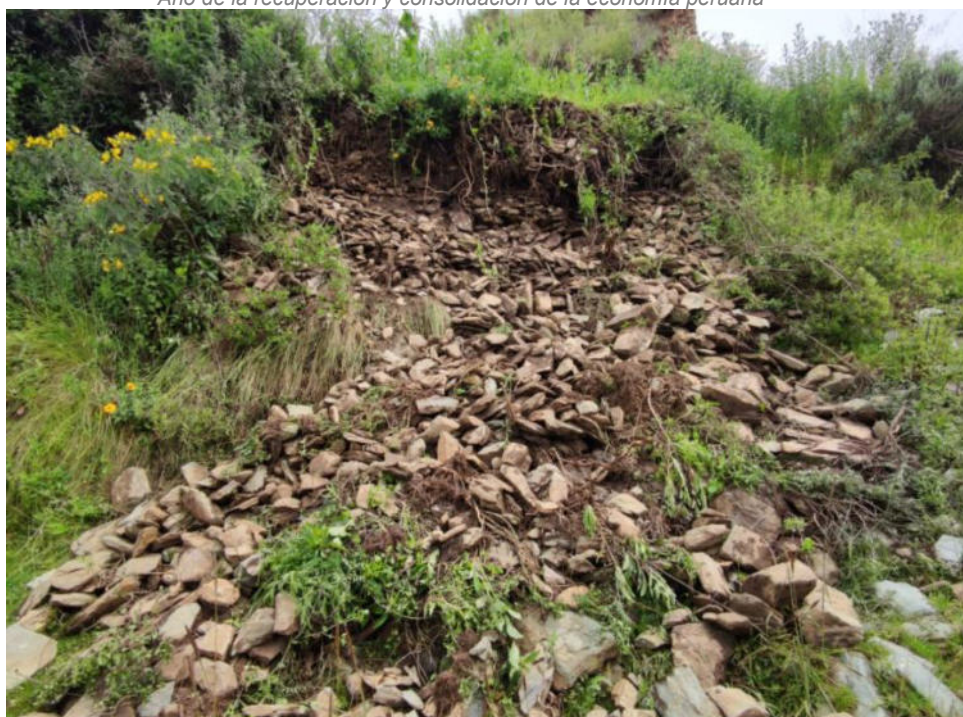
Foto N° 03.- Fotografía panorámica del sitio arqueológico Supay Punku, ubicado en el distrito de Pachas, provincia de Dos de Mayo de la región Huánuco. Se observa la afectación de la estructura.

"Decenio de la Igualdad de Oportunidades para Mujeres y Hombres" "Año de la recuperación y consolidación de la economía peruana"