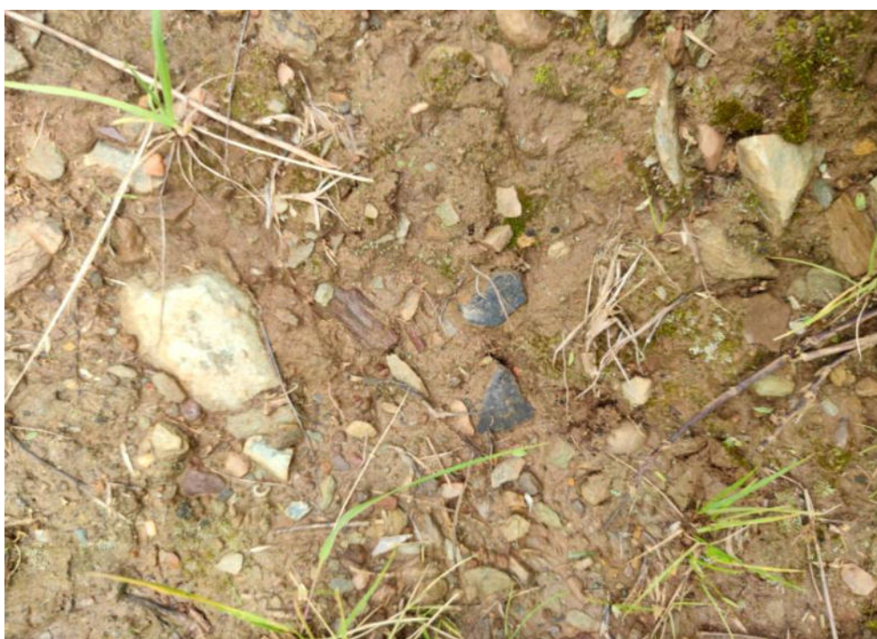
Foto N° 08.- Fotografía de fragmentos de cerámica en superficie que corresponde al sitio arqueológico Supay Punku, ubicado en el distrito de Pachas, provincia de Dos de Mayo de la región Huánuco. Se observa fragmentos de cerámica en superficie.