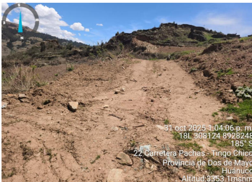
Foto N° 10.- Fotografía panorámica del sitio arqueológico Supay Punku, ubicado en el distrito de Pachas, provincia de Dos de Mayo de la región Huánuco. Se observa huellas de maquinaria pesada.