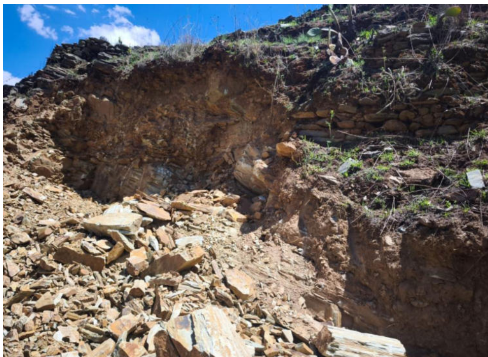
Foto N° 04.- Fotografía panorámica del sitio arqueológico Supay Punku, ubicado en el distrito de Pachas, provincia de Dos de Mayo de la región Huánuco. Se observa la afectación de la estructura.