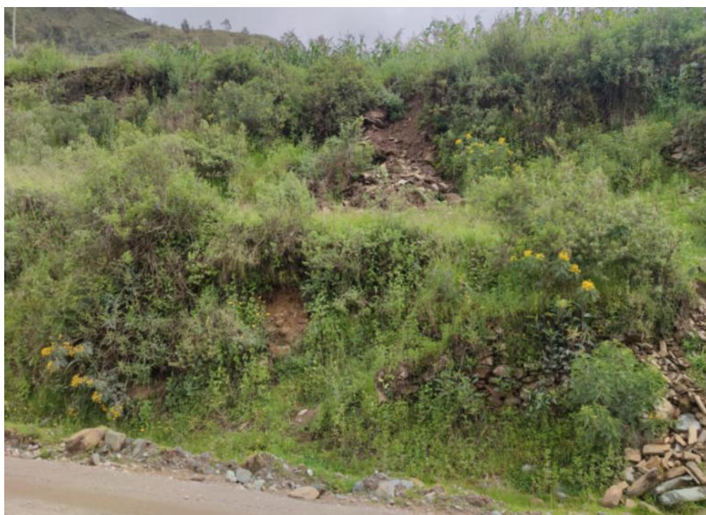
Foto N° 01.- Fotografía panorámica del sitio arqueológico Supay Punku, ubicado en el distrito de Pachas, provincia de Dos de Mayo de la región Huánuco.

"Decenio de la Igualdad de Oportunidades para Mujeres y Hombres" "Año de la recuperación y consolidación de la economía peruana"