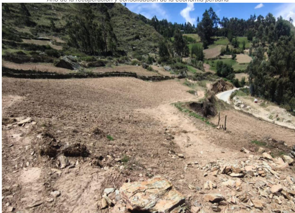
Foto N° 05.- Fotografía panorámica del sitio arqueológico Supay Punku, ubicado en el distrito de Pachas, provincia de Dos de Mayo de la región Huánuco. Se observa los trabajos de cultivo realizados.

"Decenio de la Igualdad de Oportunidades para Mujeres y Hombres" "Año de la recuperación y consolidación de la economía peruana"