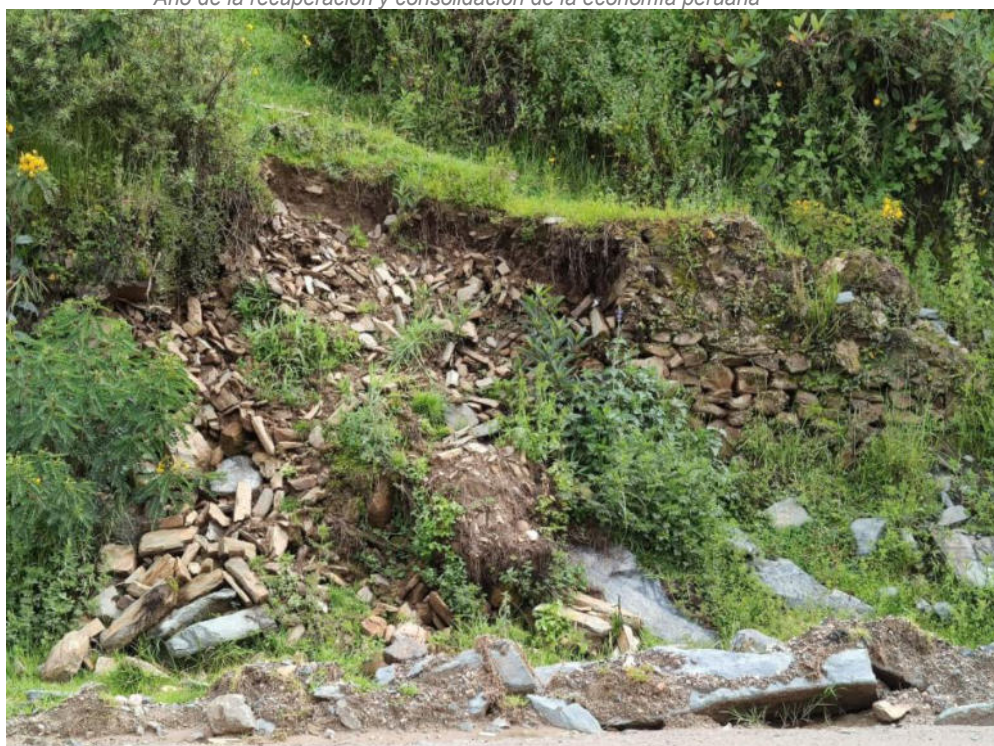
Foto N° 09.- Fotografía panorámica del sitio arqueológico Supay Punku, ubicado en el distrito de Pachas, provincia de Dos de Mayo de la región Huánuco. Se observa la afectación de la estructura.

"Decenio de la Igualdad de Oportunidades para Mujeres y Hombres" "Año de la recuperación y consolidación de la economía peruana"