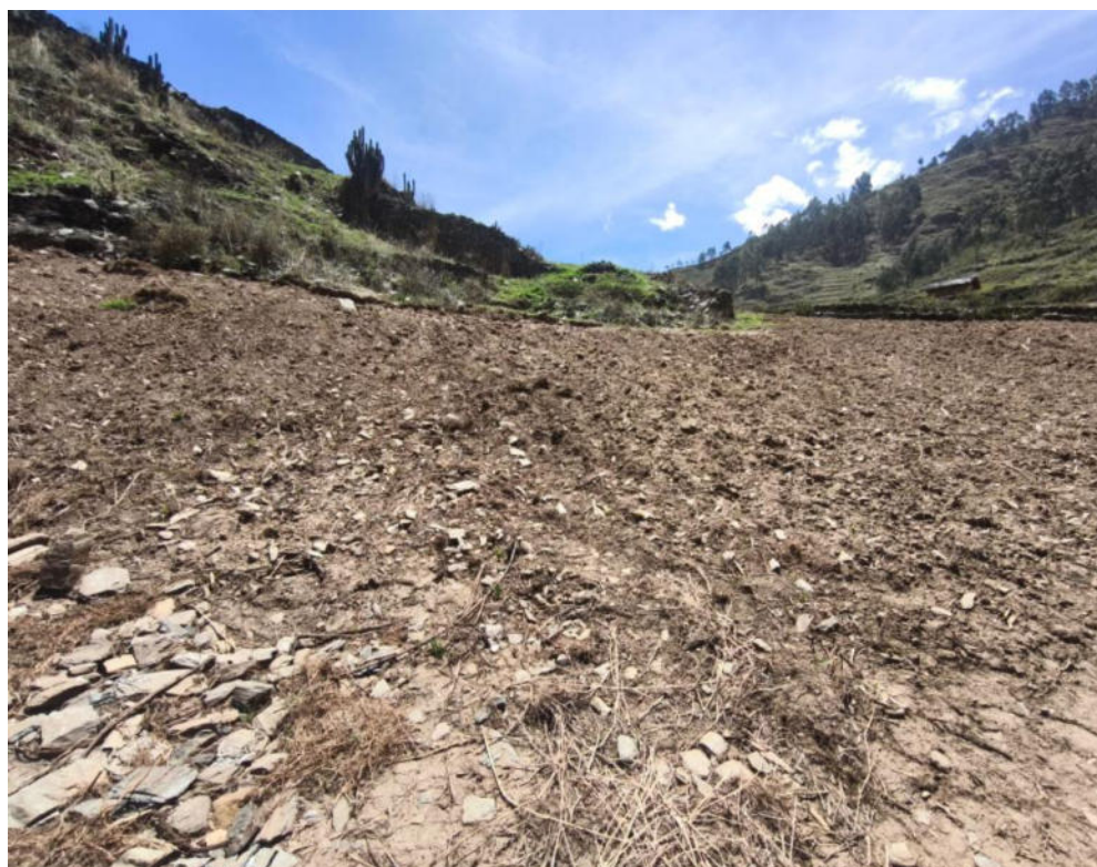
Foto N° 06.- Fotografía panorámica del sitio arqueológico Supay Punku, ubicado en el distrito de Pachas, provincia de Dos de Mayo de la región Huánuco. Se observa los trabajos de cultivo realizados.