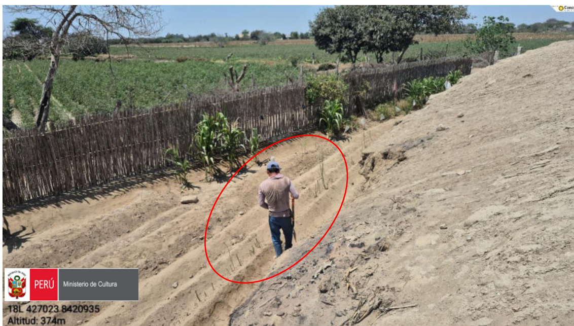
Imagen 07: trabajos agrícolas en el sitio.

SUBDIRECCIÓN DE PATRIMONIO CULTURAL E INDUSTRIAS CULTURALES E INTERCULTURALIDAD DE LA