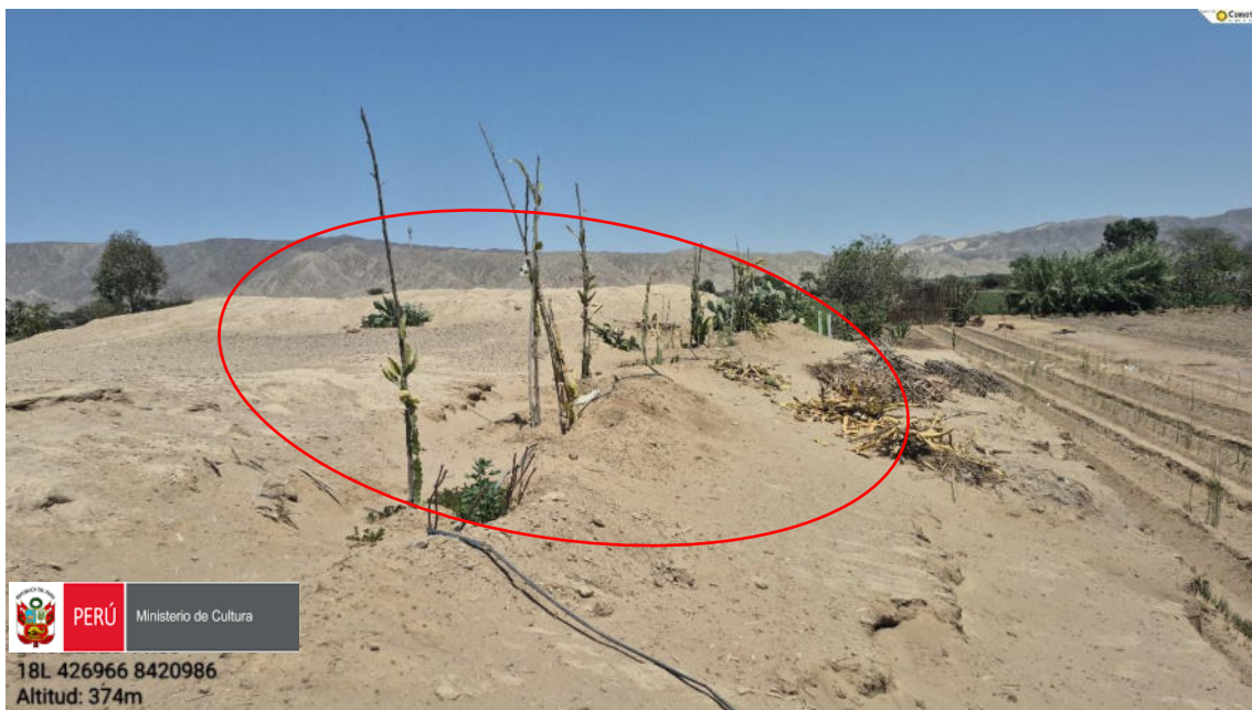
Imagen 04: vista panorámica de plantación de frutales en la cima de la huaca.

Imagen 03: vista panorámica de cómo se realizaron corte del perfil de la huaca y junto ello plantación de parras de uva.