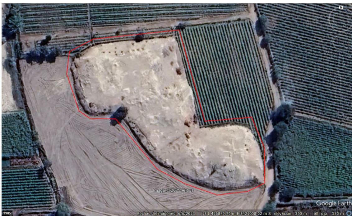
Imagen 08: vista satelital del sitio arqueológico Santa Petronila sector B.