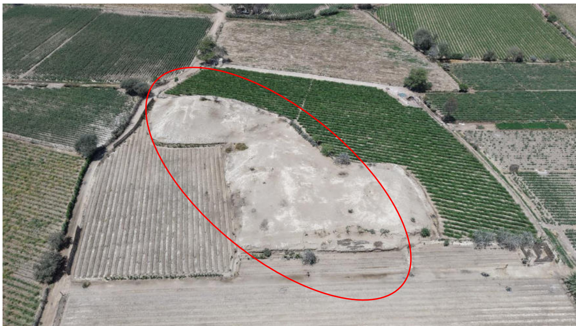
Imagen 02: vista panorámica del avance agrícola hacia el sitio arqueológico