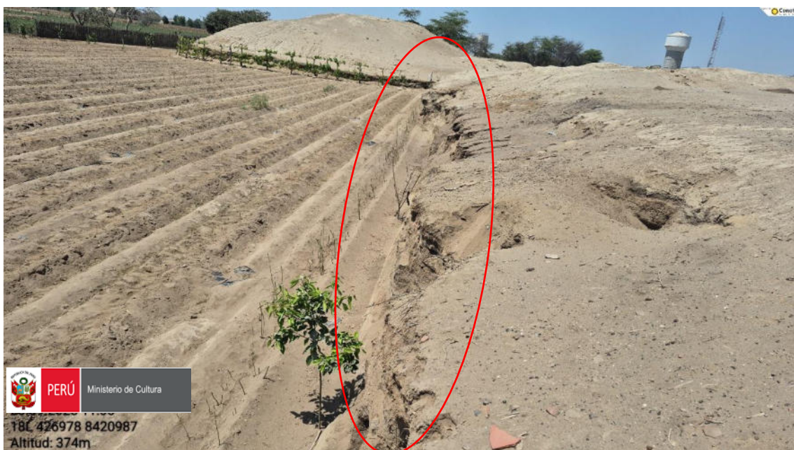
Imagen 05: vista panorámica del corte de perfil de la huaca.

SUBDIRECCIÓN DE PATRIMONIO CULTURAL E INDUSTRIAS CULTURALES E INTERCULTURALIDAD DE LA