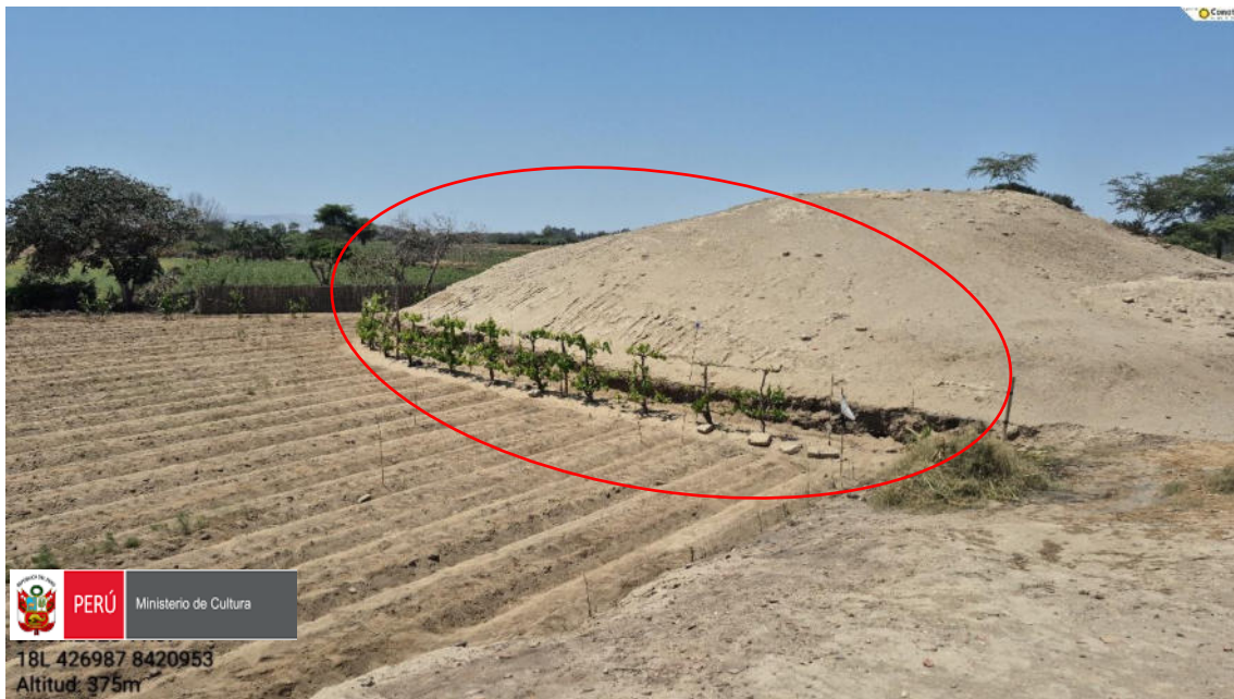
Imagen 03: vista panorámica de cómo se realizaron corte del perfil de la huaca y junto ello plantación de parras de uva.