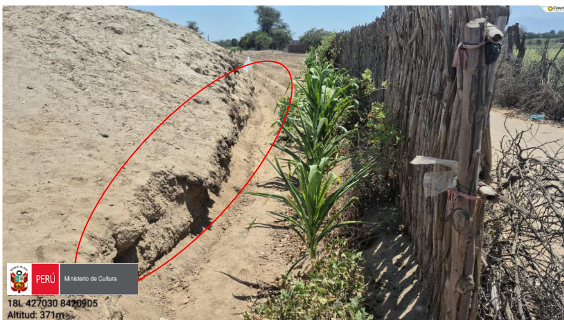
Imagen 06: vista a detalle de perfil de la huaca donde se observa recintos arquitectónicos