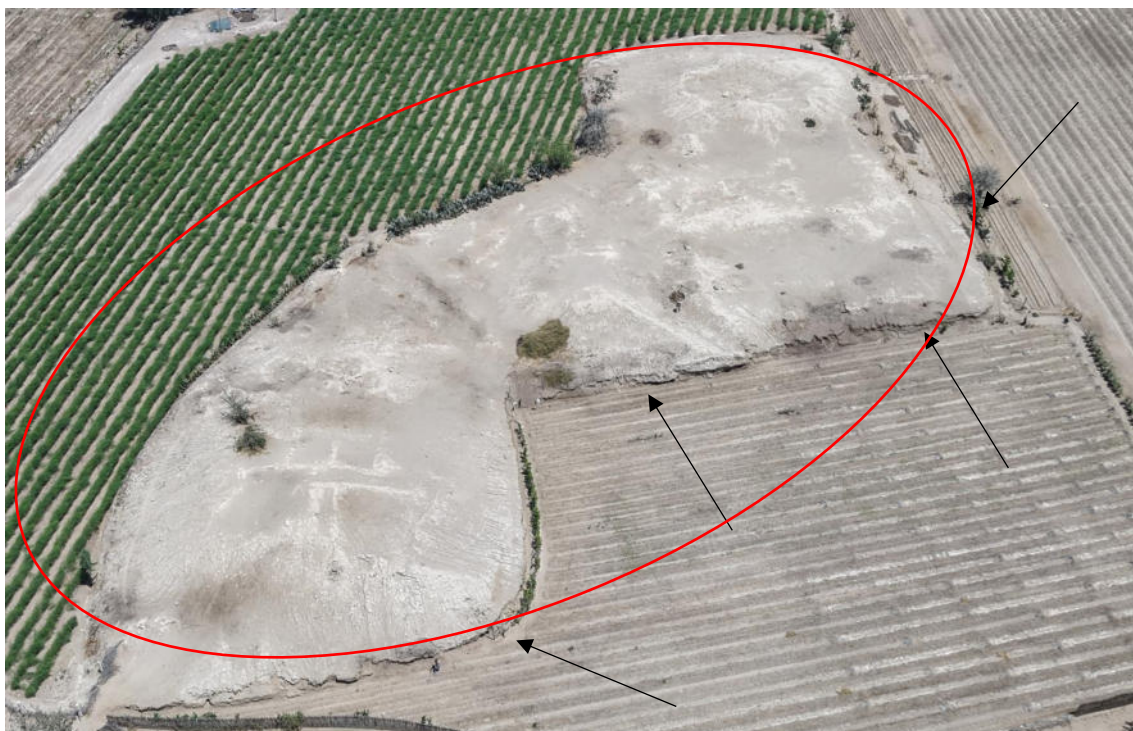
Imagen 01: vista panorámica de la invasión hacia el área arqueológica.