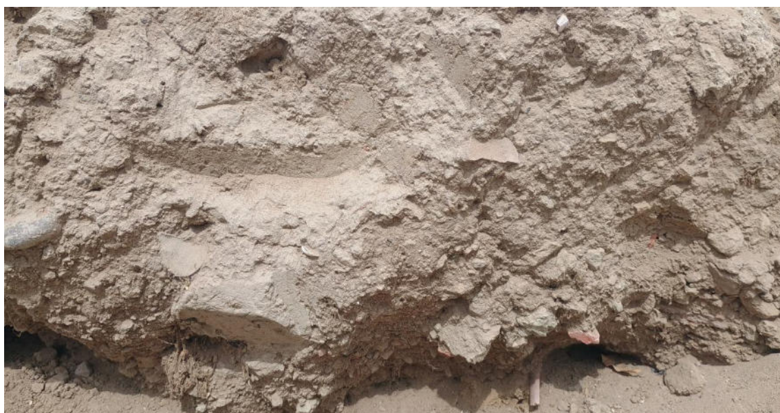
FOTO 14: VISTA DE DETALLE DE PERFIL CON MATERIAL ARQUEOLÓGICO EN EL SITIO ARQUEOLÓGICO LOMA DE LOS CASTILLOS-CATACAOS