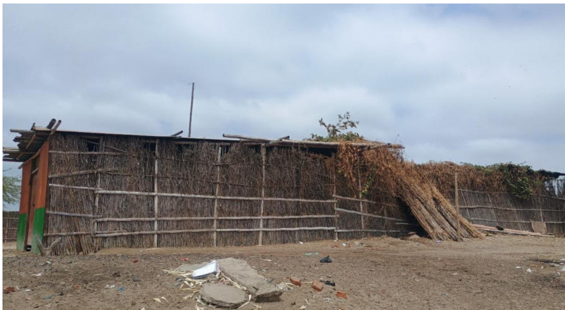
FOTO 05: VISTA DE DETALLE DE VIVIENDA DENTRO DEL SITIO ARQUEOLOGICO LOMA DE LOS CASTILLOS-CATACAOS

DIRECCIÓN DESCONCENTRADA DE CULTURA PIURA