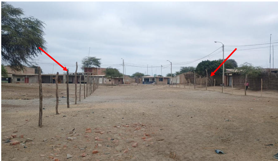
FOTO 01: VISTA DE CERCOS DE PALOS CON PÚAS EN LA EXPLANADA DEL SITIO ARQUEOLOGICO LOMA DE LOS CASTILLOS-CATACAOS