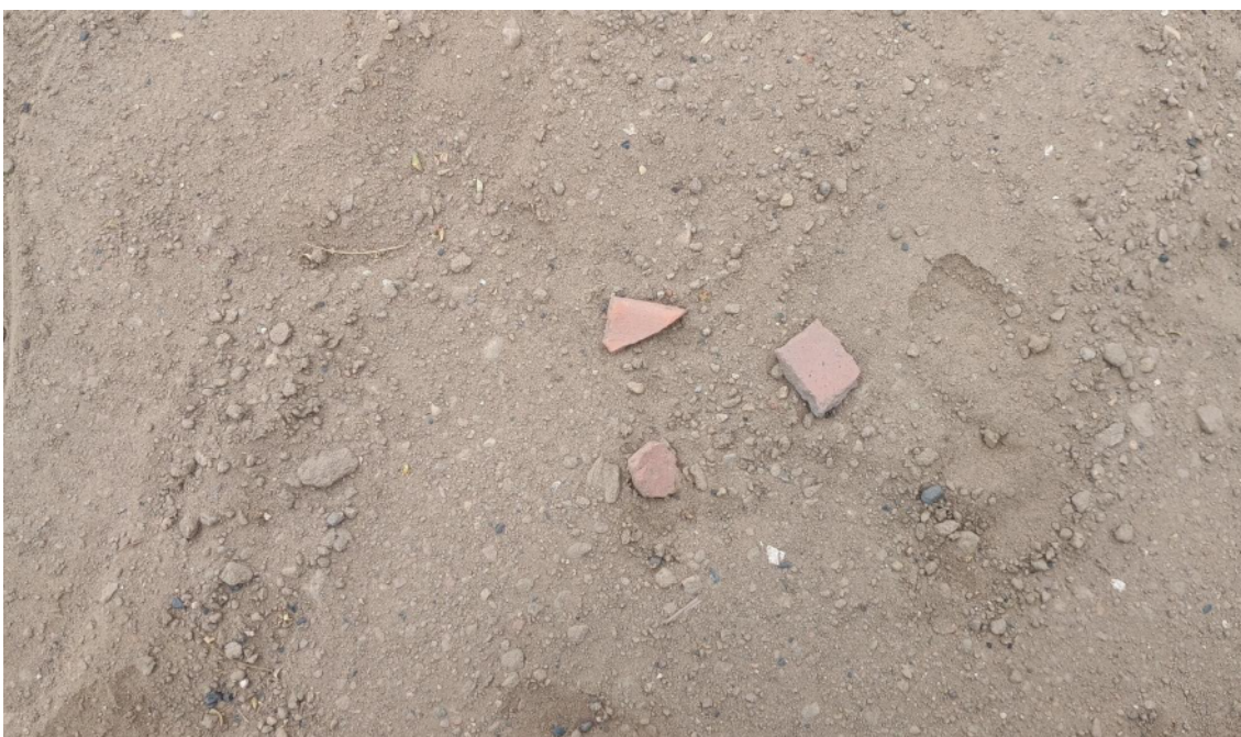
FOTO 08: VISTA DE DETALLE DE RESTOS DE FRAGMENTERÍA DE CERÁMICA EN EL SITIO ARQUEOLÓGICO LOMA DE LOS CASTILLOS-CATACAOS