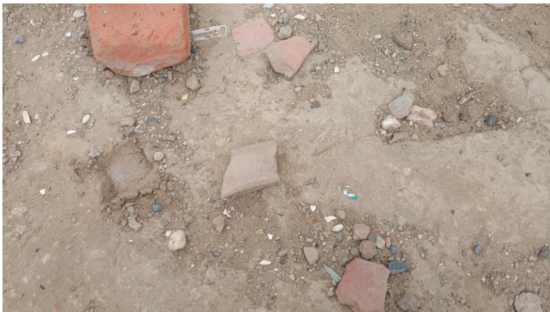
FOTO 11: VISTA DE DETALLE DE RESTOS DE FRAGMENTERÍA DE CERÁMICA Y RESTOS MALACOLÓGICOS EN EL SITIO ARQUEOLÓGICO LOMA DE LOS CASTILLOS-CATACAOS