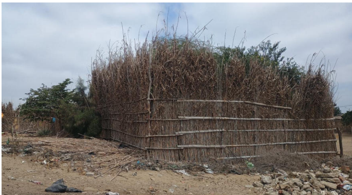
FOTO 04: VISTA DE DETALLE DE CORRAL DE UNA VIVIENDA ALEDAÑA AL SITIO ARQUEOLOGICO LOMA DE LOS CASTILLOS-CATACAOS