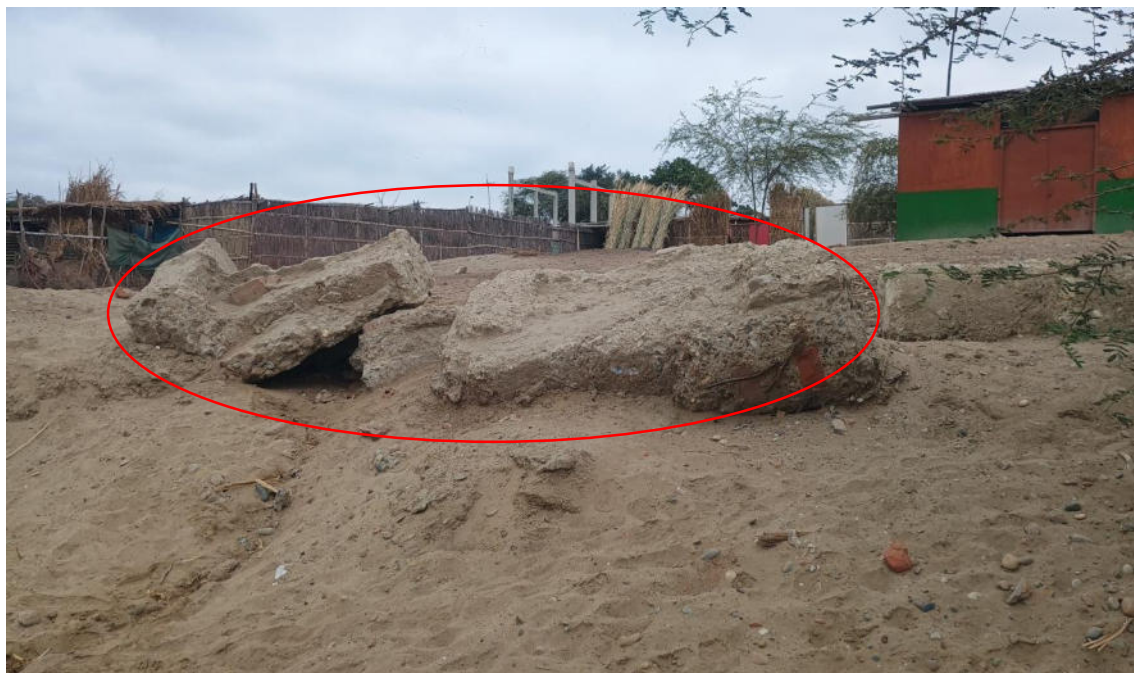
FOTO 03: VISTA DE DESMONTE DE LADRILLOS Y CEMENTO DENTRO DEL SITIO ARQUEOLOGICO LOMA DE LOS CASTILLOS-CATACAOS

DIRECCIÓN DESCONCENTRADA DE CULTURA PIURA