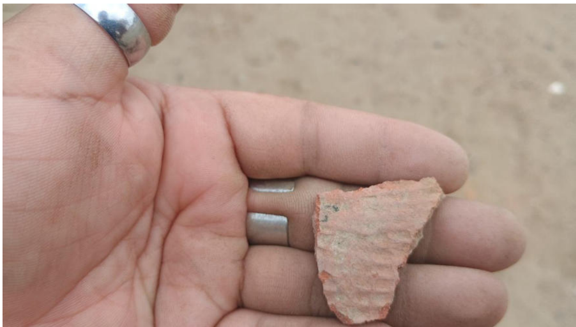
FOTO 15: VISTA DE DETALLE DE FRAGMENTO DE CERÁMICA CON LA TÉCNICA DE RETICULADO EN EL SITIO ARQUEOLÓGICO OMA DE LOS CASTILLOS-CATACAOS

DIRECCIÓN DESCONCENTRADA DE CULTURA PIURA