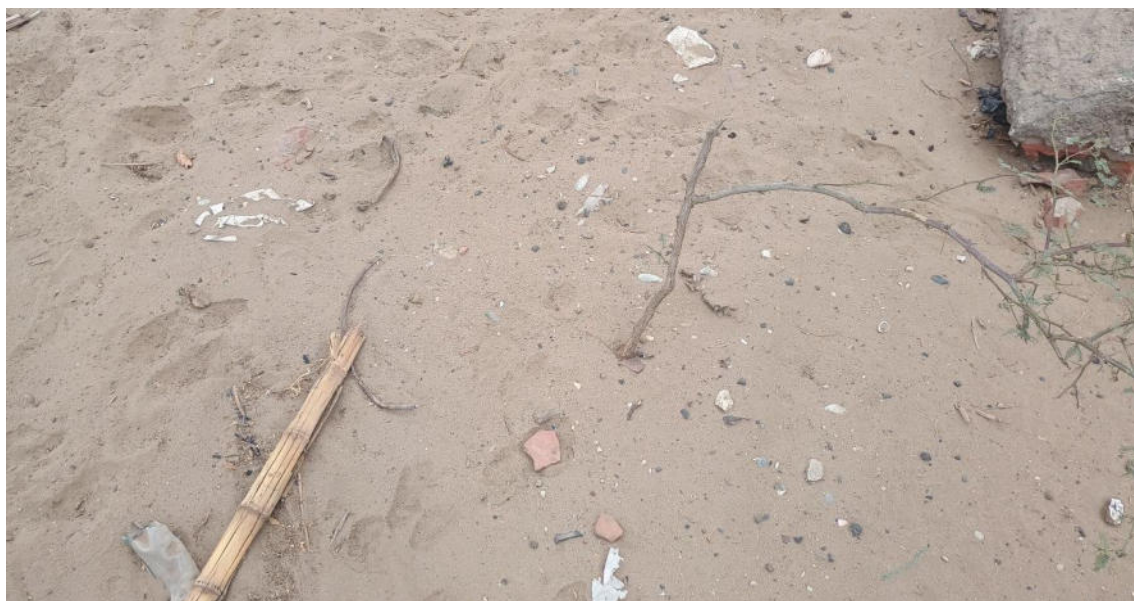
FOTO 12: VISTA DE DETALLE DE RESTOS DE FRAGMENTERÍA DE CERÁMICA Y RESTOS MALACOLÓGICOS EN EL SITIO ARQUEOLÓGICO LOMA DE LOS CASTILLOS-CATACAOS