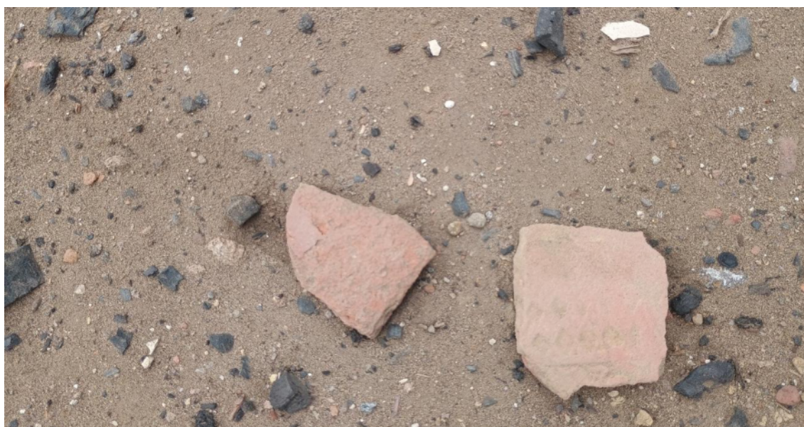
FOTO 10: VISTA DE DETALLE DE RESTOS DE FRAGMENTERÍA DE CERÁMICA EN EL SITIO ARQUEOLÓGICO LOMA DE LOS CASTILLOS-CATACAOS