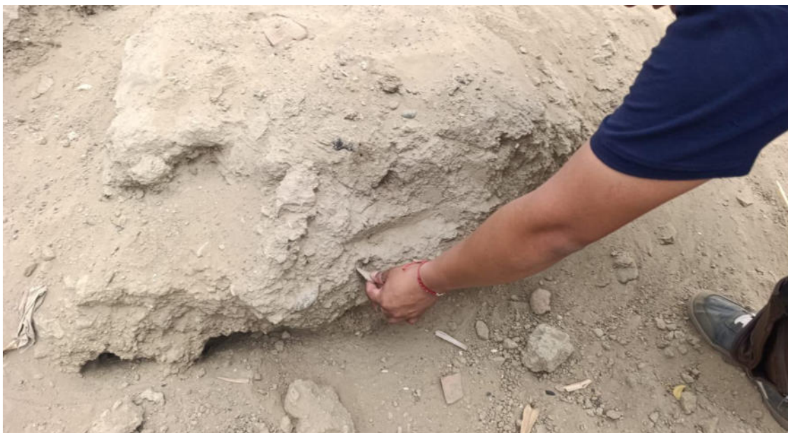
FOTO 07: VISTA DE DETALLE DE MATERIAL ARQUEOLÓGICO EN EL SITIO ARQUEOLOGICO LOMA DE LOS CASTILLOS-CATACAOS

DIRECCIÓN DESCONCENTRADA DE CULTURA PIURA