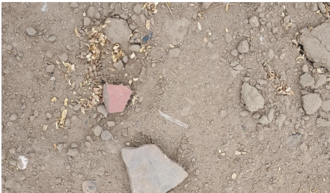
FOTO 09: VISTA DE DETALLE DE RESTOS DE FRAGMENTERÍA DE CERÁMICA Y RETOS MALACOLÓGICOS EN EL SITIO ARQUEOLÓGICO LOMA DE LOS CASTILLOS-CATACAOS