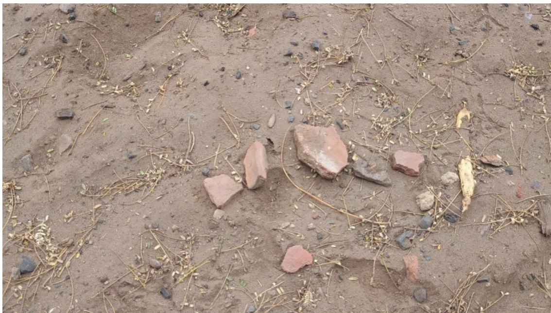
FOTO 13: VISTA DE DETALLE DE RESTOS DE FRAGMENTERÍA DE CERÁMICA EN EL SITIO ARQUEOLÓGICO LOMA DE LOS CASTILLOS-CATACAOS