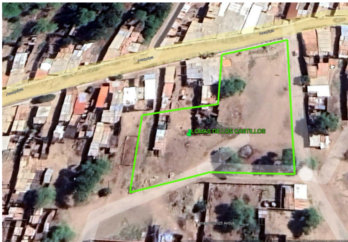
Imagen 01: CAPTURA DE PANTALLA DEL GOOGLE EARTH, INDICADO LA PROPUESTA DE POLÍGONO DEL SITIO ARQUEOLÓGICO LOMA DE LOS CASTILLOS-CATACAOS