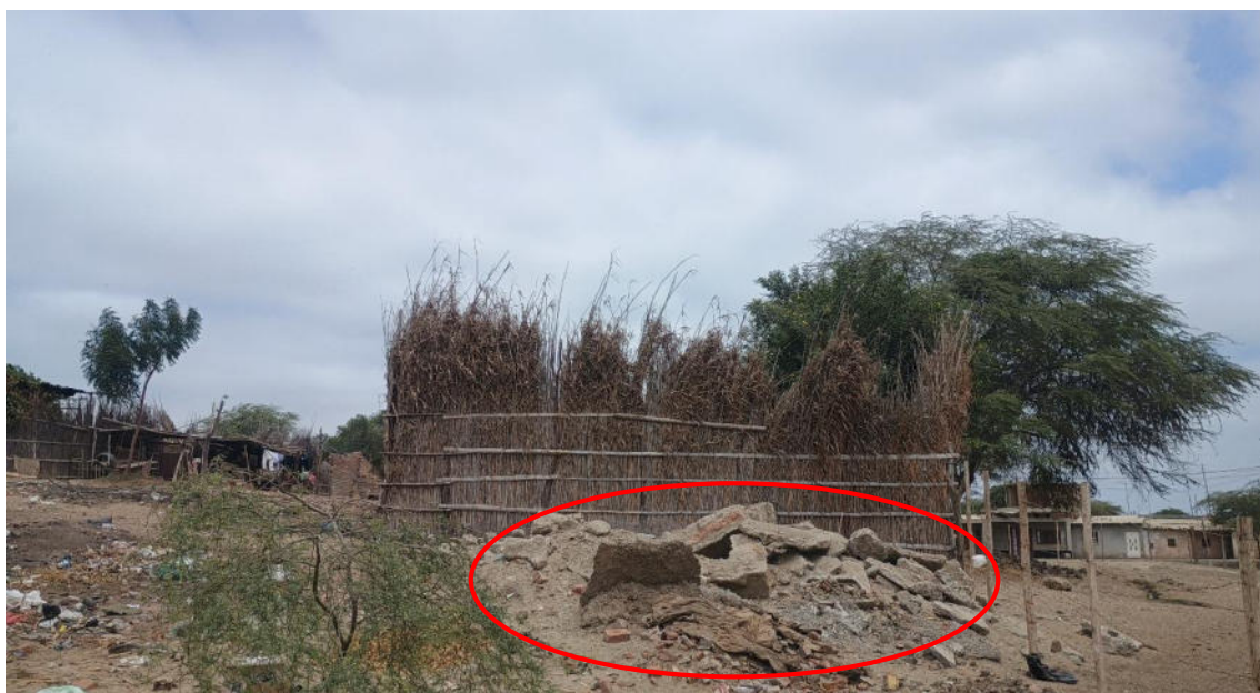
FOTO 06: VISTA DE DESMONTE DE LADRILLOS Y CEMENTO DENTRO DEL SITIO ARQUEOLOGICO LOMA DE LOS CASTILLOS-CATACAOS