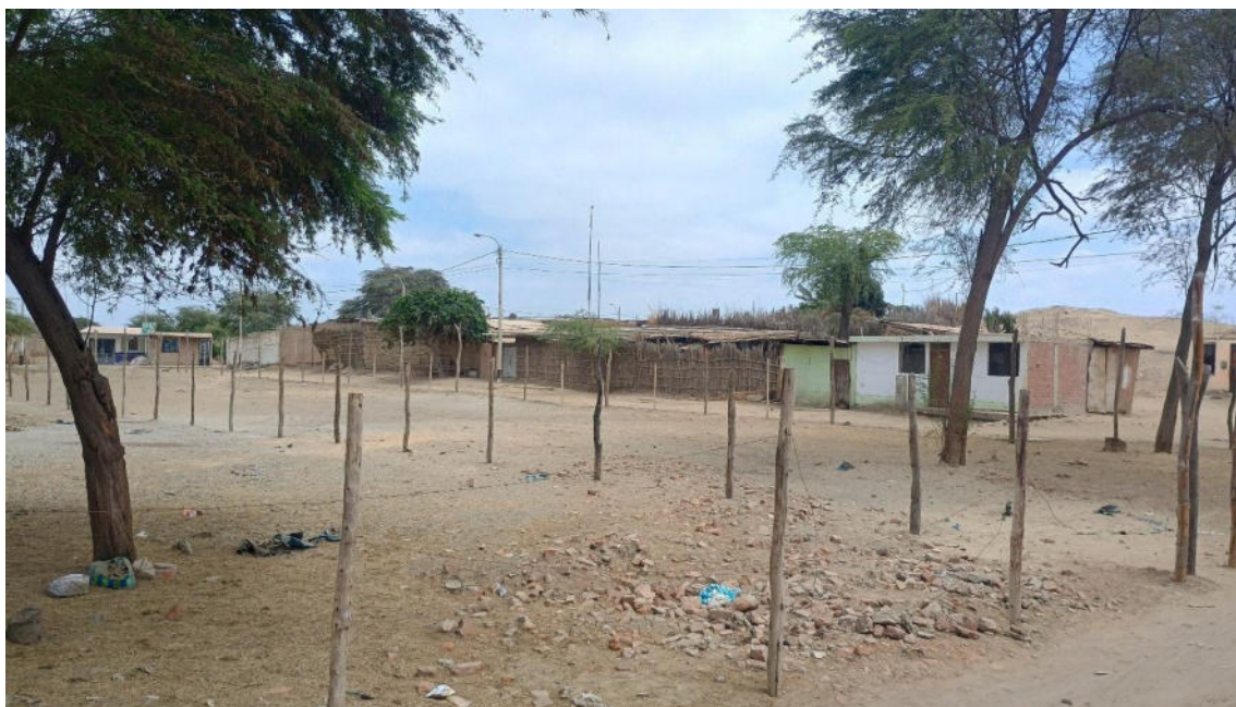
FOTO 02: VISTA DE CERCOS DE PALOS CON PÚAS EN LA EXPLANADA DEL SITIO ARQUEOLOGICO LOMA DE LOS CASTILLOS-CATACAOS