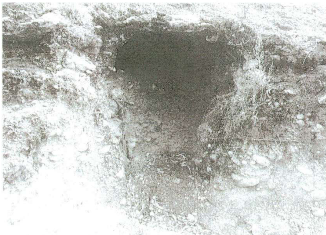
Foto. 11: vista de la excavación privada. Donde se ha expuesto una pequeña cueva profunda, posible área funeraria "afectación 3" (inspección 08/11/2024).

Lic. Arq. Juan Víctor Barrial Quispe COARPE N° 042241