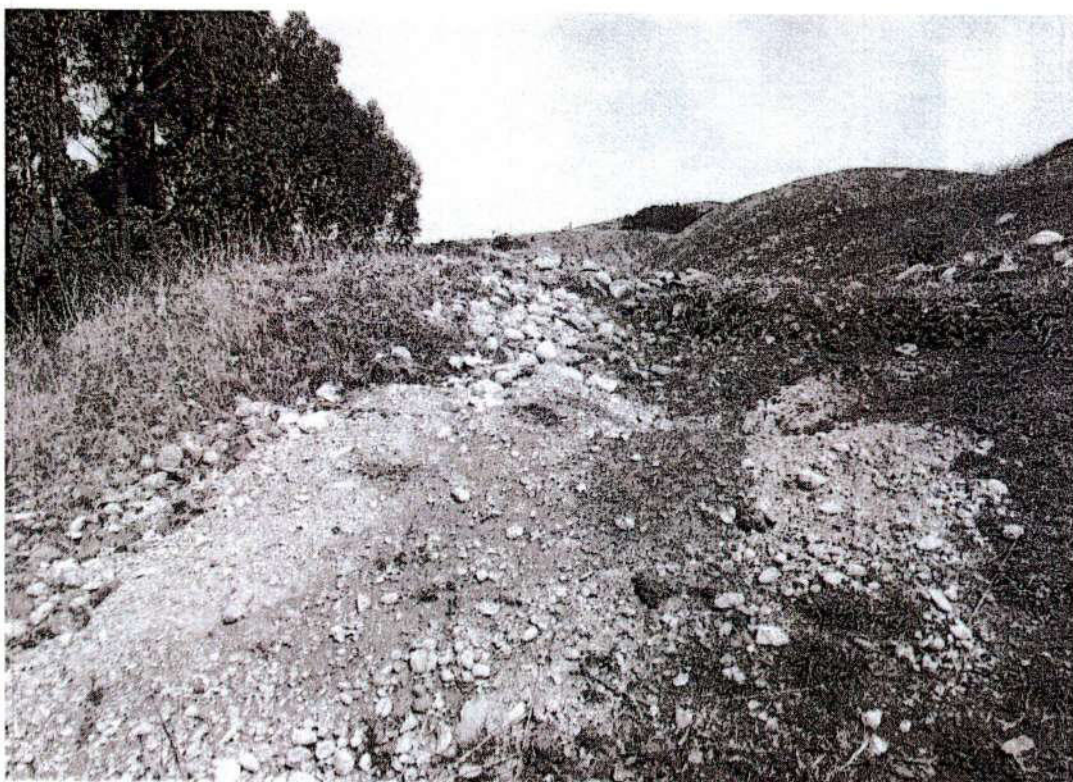
Foto. 5: vista del desmonte de la excavación ubicado al interior del sitio arqueológico de Puyhuan. "afectación 2" (inspección 08/11/2024).

[Handwritten signature] Lic. Arq. Juan Víctor Barrial Quispe COARPE N° 042241