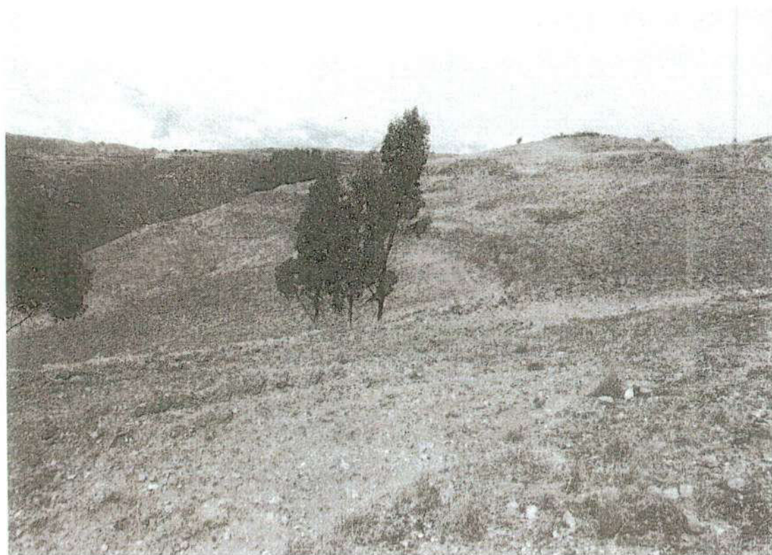
Foto. 23: vista de áreas de cultivo las cuales se extienden al área nuclear del sitio arqueológico de Puyhuan. (inspección 08/11/2024).

Lic. Arq. J. Víctor Barral Quispe COARPE N° 042241