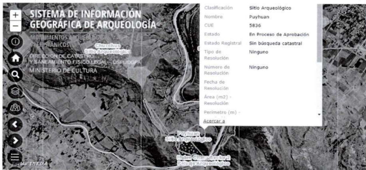
Foto 1. Vista panorámica satelital del sitio arqueológico de Puyhuan.

Las fotos deberán mostrar lo indicado en la valoración cultural (debe observarse de manera evidente la condición de sitio arqueológico del bien)