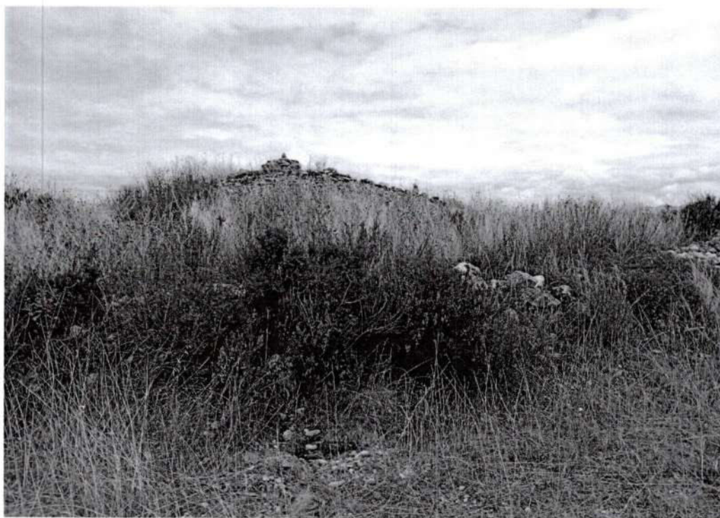
Foto 9. Vista panorámica del cima de la colina del sitio arqueológico de Puyhuan, (Inspección 13/10/2025).

Wilber Jaime Ore Berrocal WILBER JAIME ORE BERROCAL COARPE N° 042885