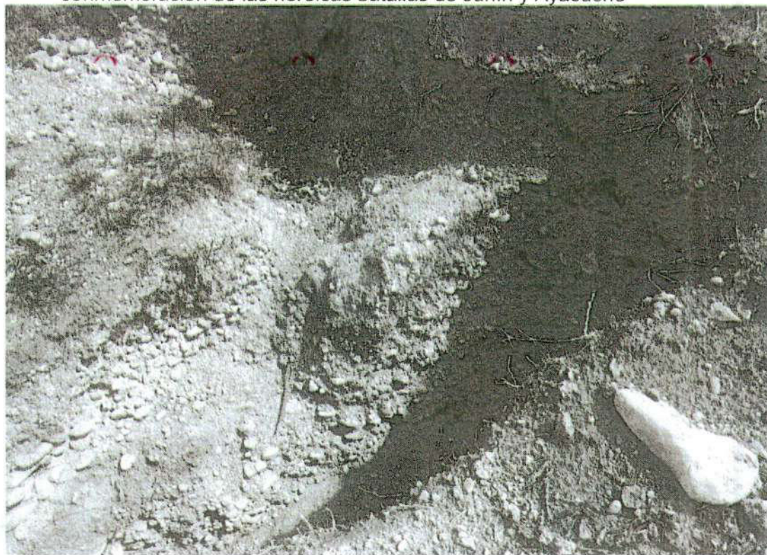
Foto. 10: vista de la excavación privada. Donde se evidencia el perfil con evidencias culturales "afectación 3" (inspección 08/11/2024).

"Año del Bicentenario, de la consolidación de nuestra Independencia, y de la conmemoración de las heroicas batallas de Junín y Ayacucho"