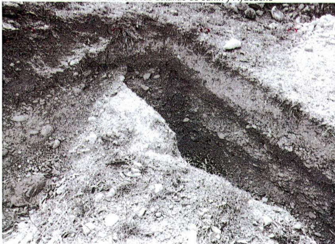
Foto. 8: vista de la excavación ubicado al lado norte de la plataforma central donde se evidencia el perfil de la capa estratigráfica. Con resto de material cultural "afectación 3" (inspección 08/11/2024).

"Año del Bicentenario, de la consolidación de nuestra Independencia, y de la conmemoración de las heroicas batallas de Junín y Ayacucho"