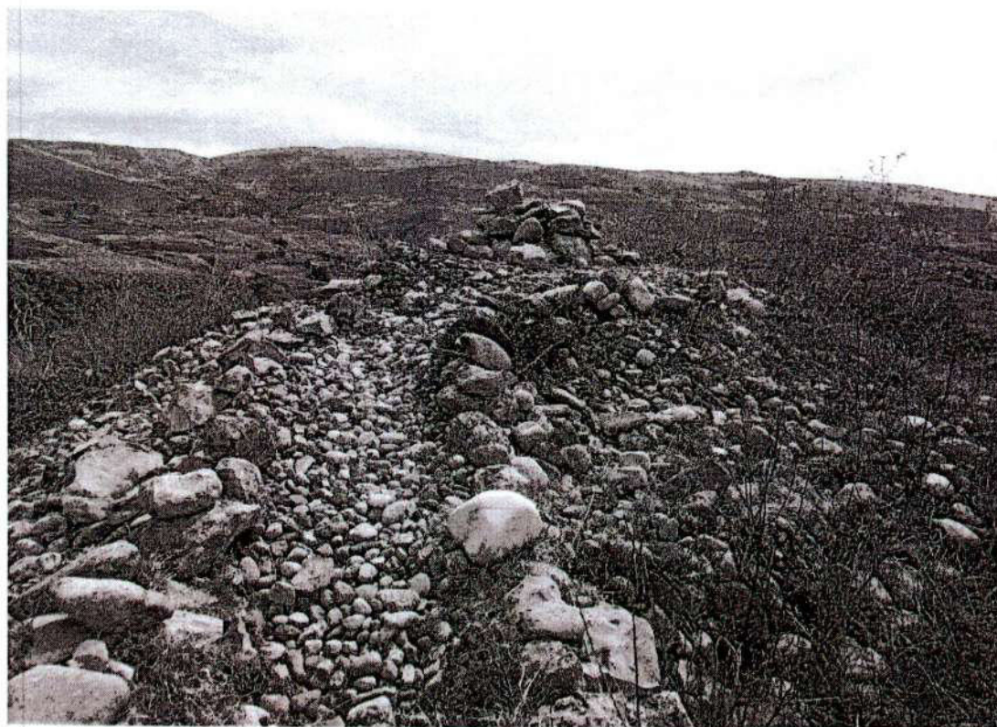
Foto. 17: vista de la plataforma central ubicado en el sitio arqueológico de Puyhuan (inspección 08/11/2024).