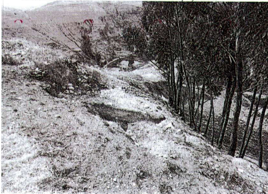
Foto. 16: vista de la excavación privada. Donde se ha expuesto y destruido el muro de la plataforma "afectación 3" (inspección 08/11/2024).

"Año del Bicentenario, de la consolidación de nuestra Independencia, y de la conmemoración de las heroicas batallas de Junín y Ayacucho"