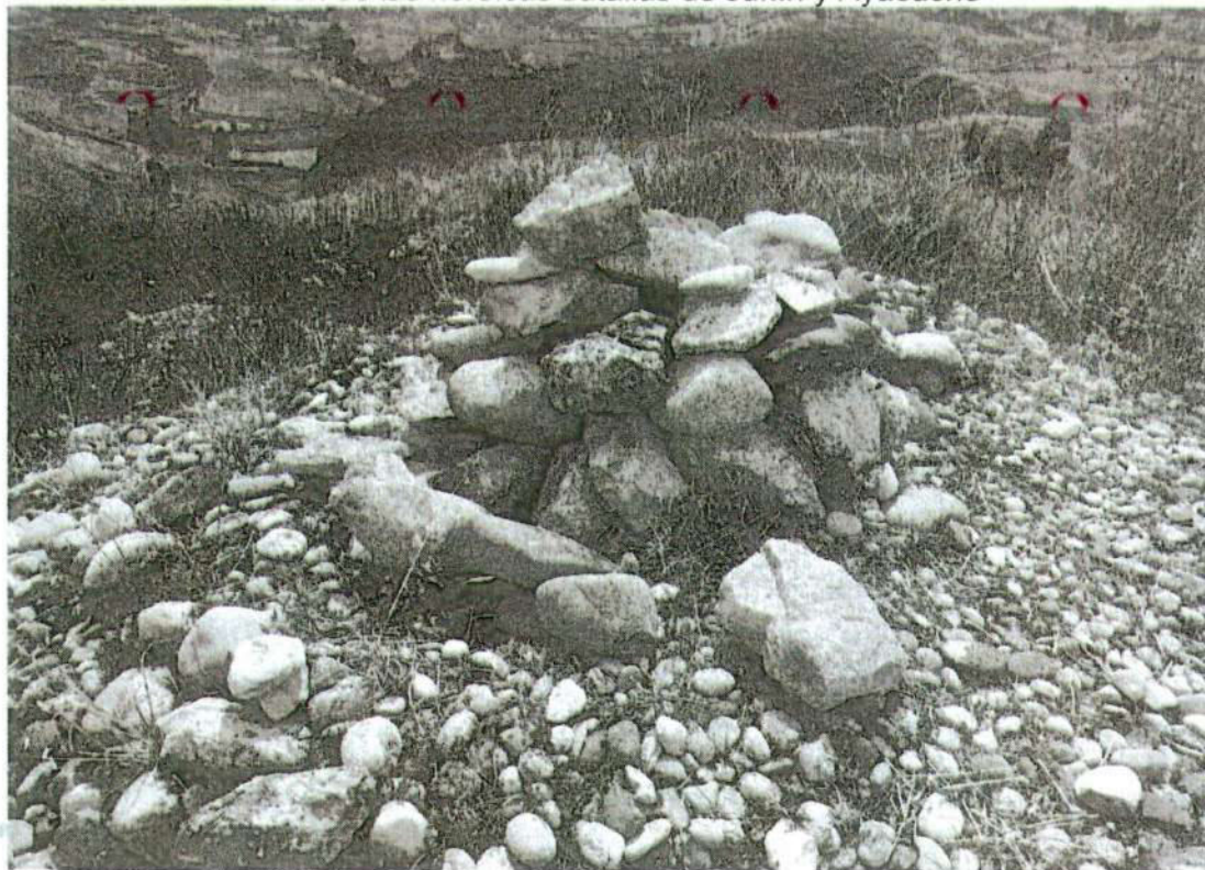
Foto. 18: vista de la plataforma central ubicado en el sitio arqueológico de Puyhuan (inspección 08/11/2024).

"Año del Bicentenario, de la consolidación de nuestra Independencia, y de la conmemoración de las heroicas batallas de Junín y Ayacucho"