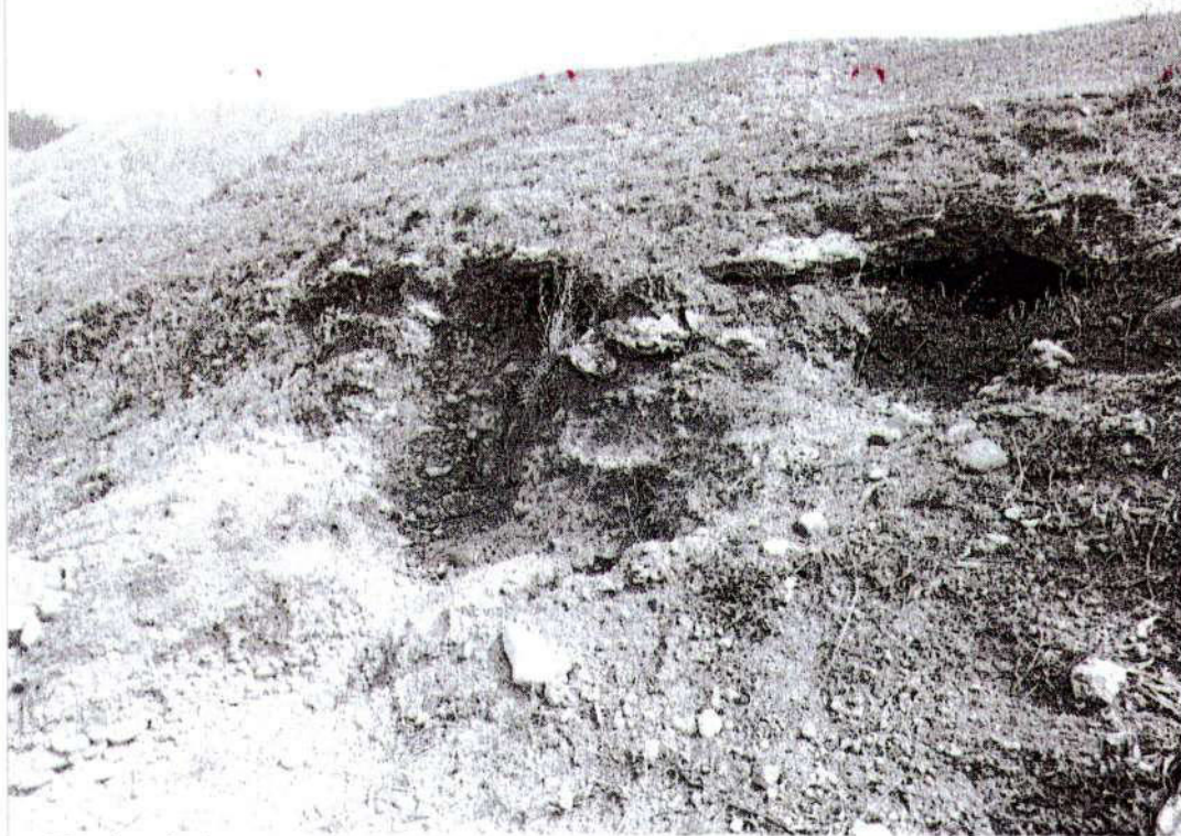
Foto. 12: vista de la excavación privada. Donde se ha expuesto dos pequeñas cuevas, posible área funeraria "afectación 3" (inspección 08/11/2024).

"Año del Bicentenario, de la consolidación de nuestra Independencia, y de la conmemoración de las heroicas batallas de Junín y Ayacucho"