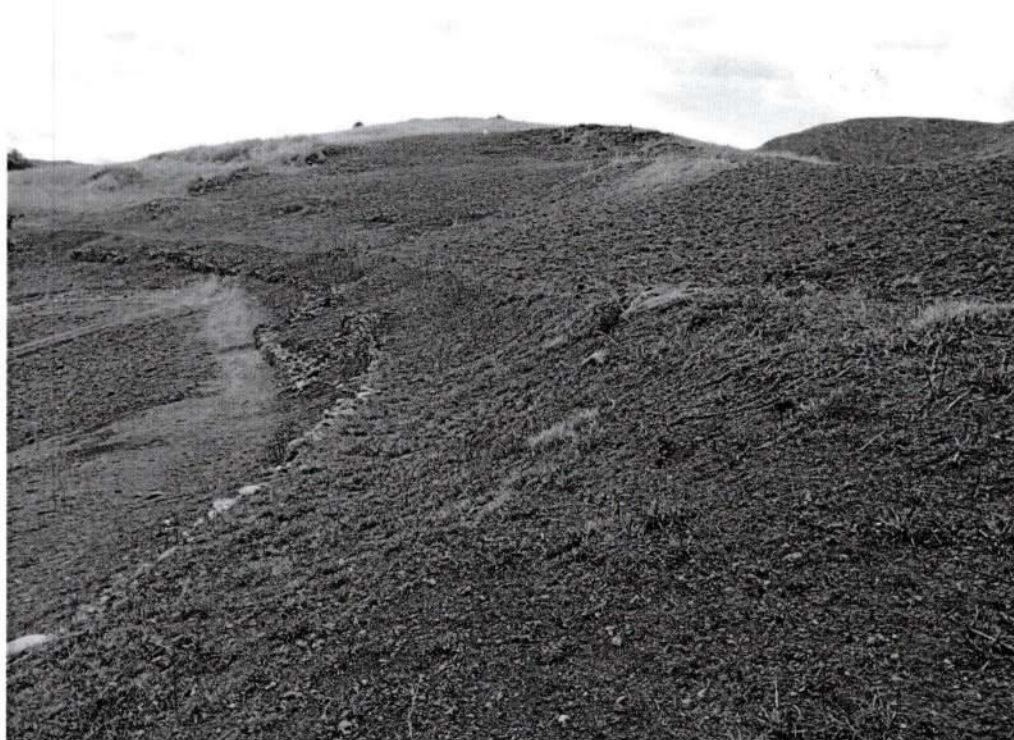
Foto 13. Vista panorámica de la terraza en el sitio arqueológico de Puyhuan (inspección. 13/10/2025).