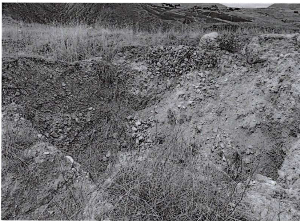
Foto 8, vista de la séptima afectación por excavación profunda realizado con maquinaria pesada en el sitio arqueológico de Puyhuan (inspección 13/10/2025).

Dirección General de Defensa del Patrimonio Cultural