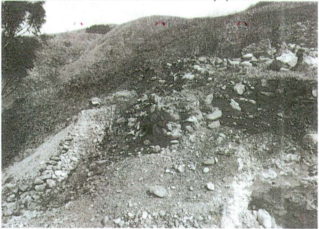
Foto. 14: vista de la excavación privada. Donde se ha expuesto y destruido el muro de la plataforma "afectación 3" (inspección 08/11/2024).

"Año del Bicentenario, de la consolidación de nuestra Independencia, y de la conmemoración de las heroicas batallas de Junín y Ayacucho"