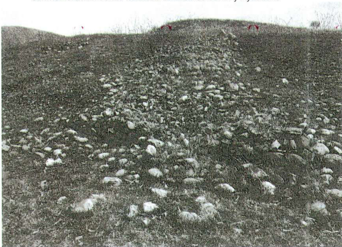
Foto. 22: vista del colapso de muros de la plataforma la cual se encuentra en mal estado de conservación. (inspección 08/11/2024).

"Año del Bicentenario, de la consolidación de nuestra Independencia, y de la conmemoración de las heroicas batallas de Junín y Ayacucho"