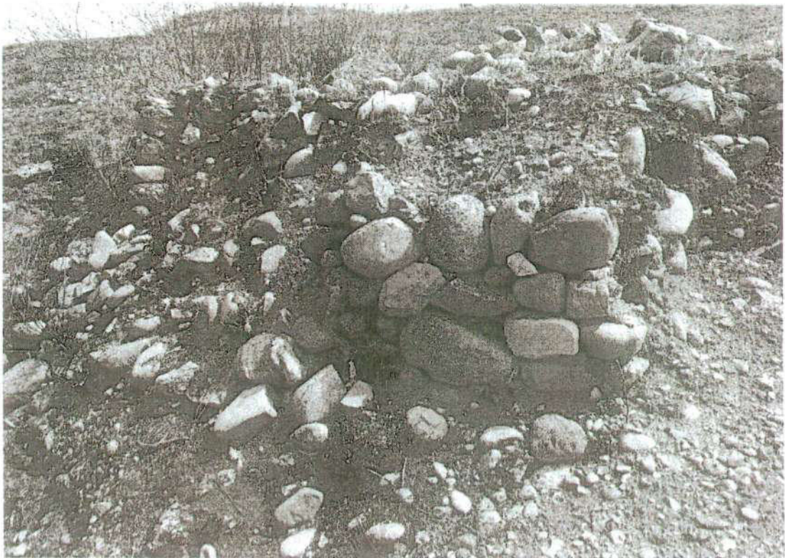
Foto. 15: vista donde se ha expuesto el muro de la plataforma "afectación 3" (inspección 08/11/2024).