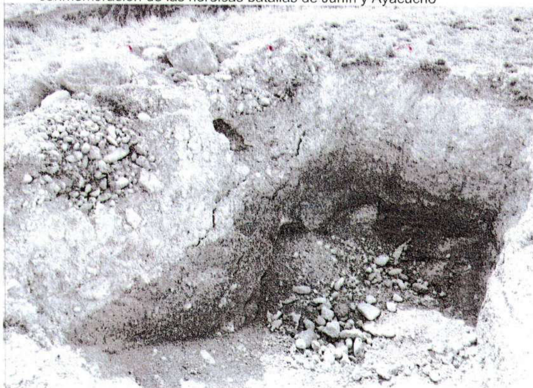
Foto. 4: vista de la excavación profunda con maquinaria pesada donde en el perfil oeste se evidencia montículo de piedras canto rodado. "afectación 1" (inspección 08/11/2024).

"Año del Bicentenario, de la consolidación de nuestra Independencia, y de la conmemoración de las heroicas batallas de Junín y Ayacucho"