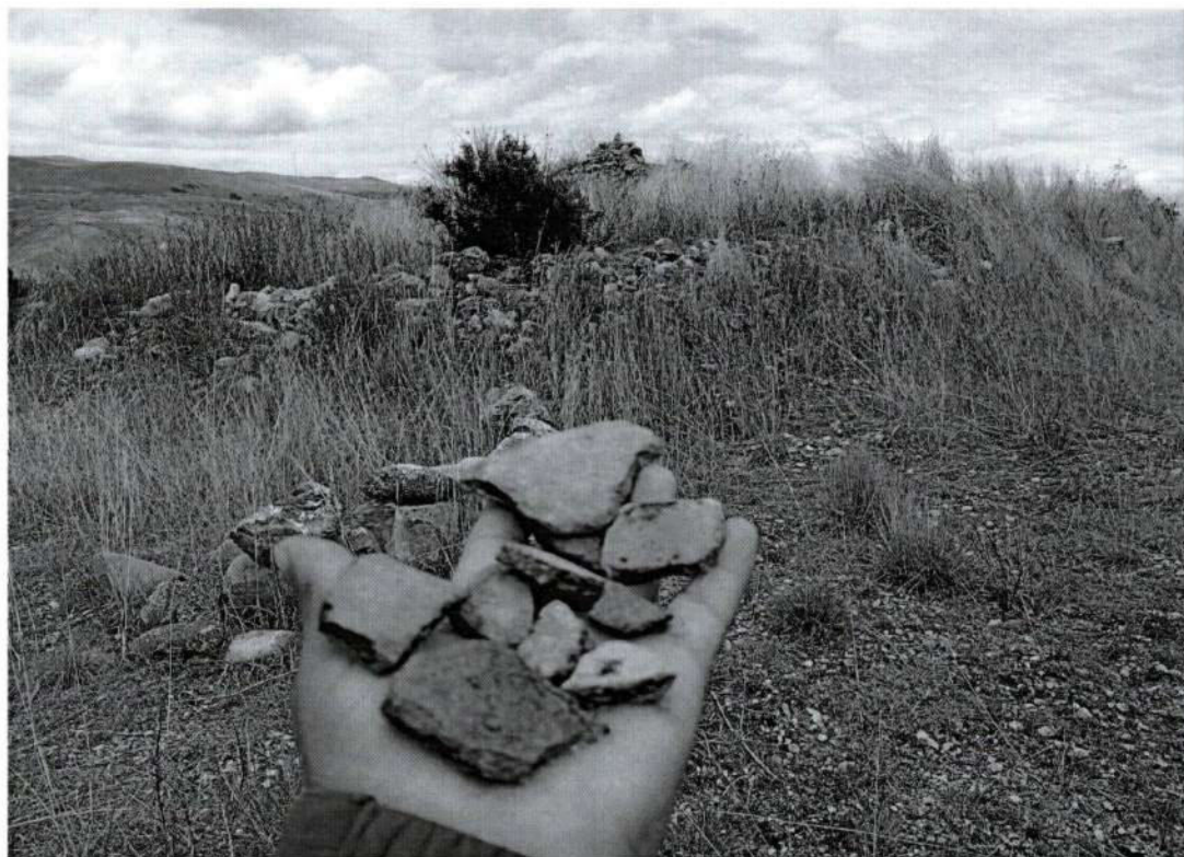
Foto 10. Evidencias culturales (cerámica) en el sitio arqueológico de Puyhuan (Inspección 13/10/2025).

Dirección General de Defensa del Patrimonio Cultural