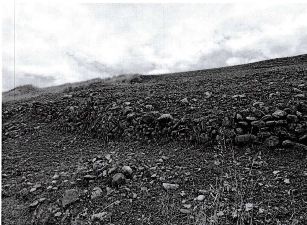
Foto 12, vista en detalle de las terrazas en colapso, del sitio arqueológico de Puyhuan (inspección. 13/10/2025).

Dirección General de Defensa del Patrimonio Cultural