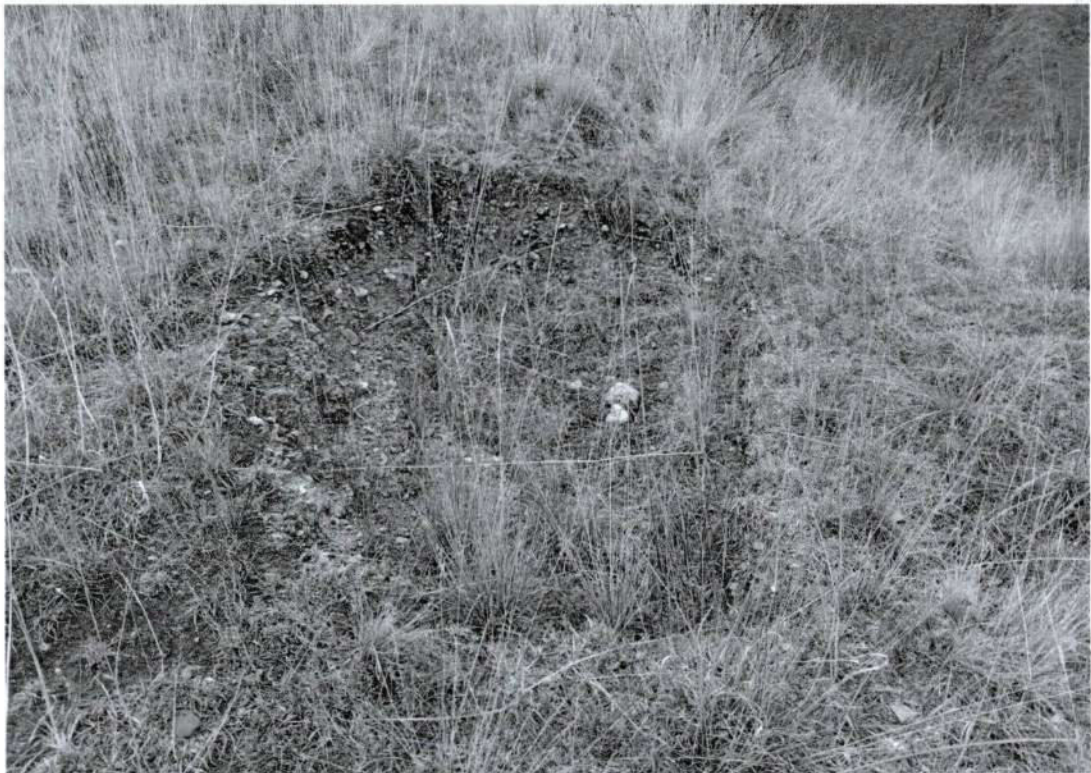
Foto 3. Vista de una segunda afectación al sitio arqueológico de Puyhuan con evidencia de excavación clandestina "huaqueo" (Inspección 13/10/2025).