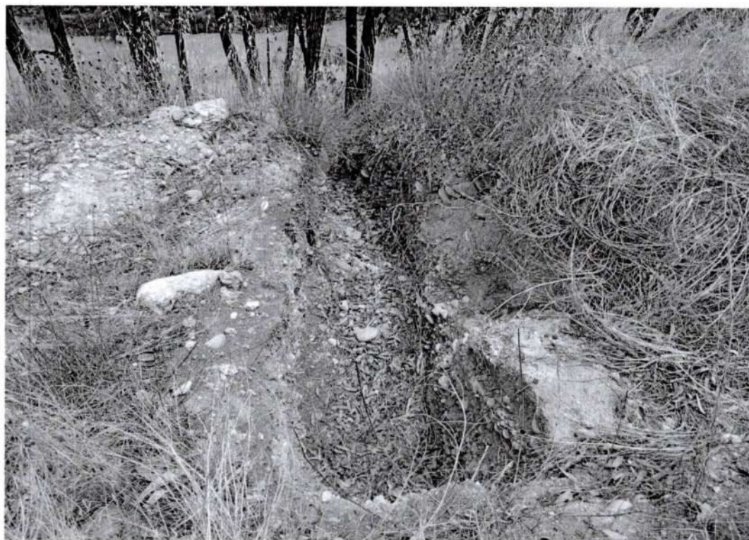
Foto 5. Vista de una cuarta afectación por excavación clandestina "huaqueo" (Inspección 13/10/2025).