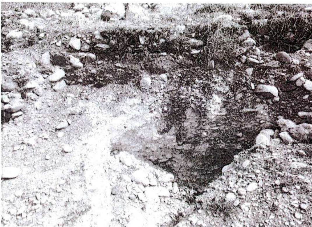
Foto. 13: vista de la excavación privada. Donde se ha expuesto y destruido el muro de la plataforma "afectación 3" (inspección 08/11/2024).