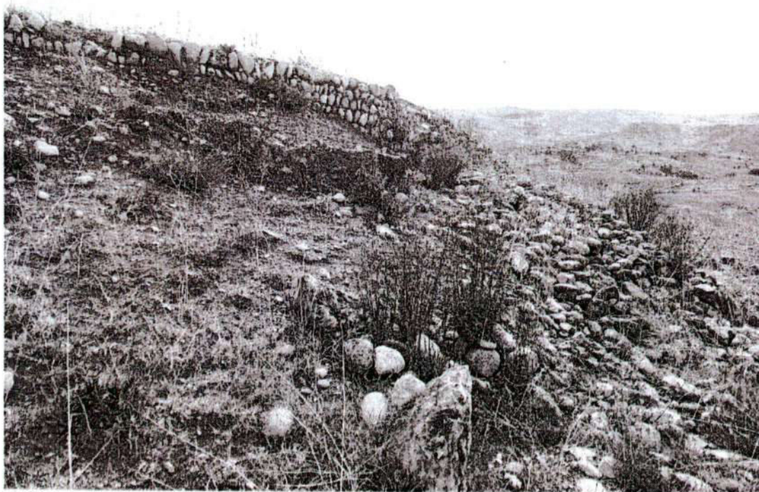
Foto. 21: vista del muro de la plataforma en regular estado de conservación, así mismo se evidencia montículo de piedras producto de colapso de muro. (inspección 08/11/2024).