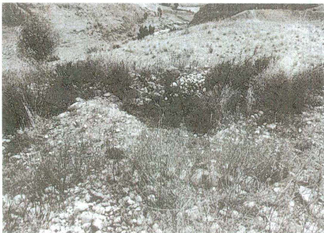
Foto. 19: vista de la excavación clandestina "huaqueo" ubicado junto a la plataforma central, "afectación 4" (inspección 08/11/2024).

Lic. Arqigo. Juan Víctor Barrial Quispe COARPE N° 042243