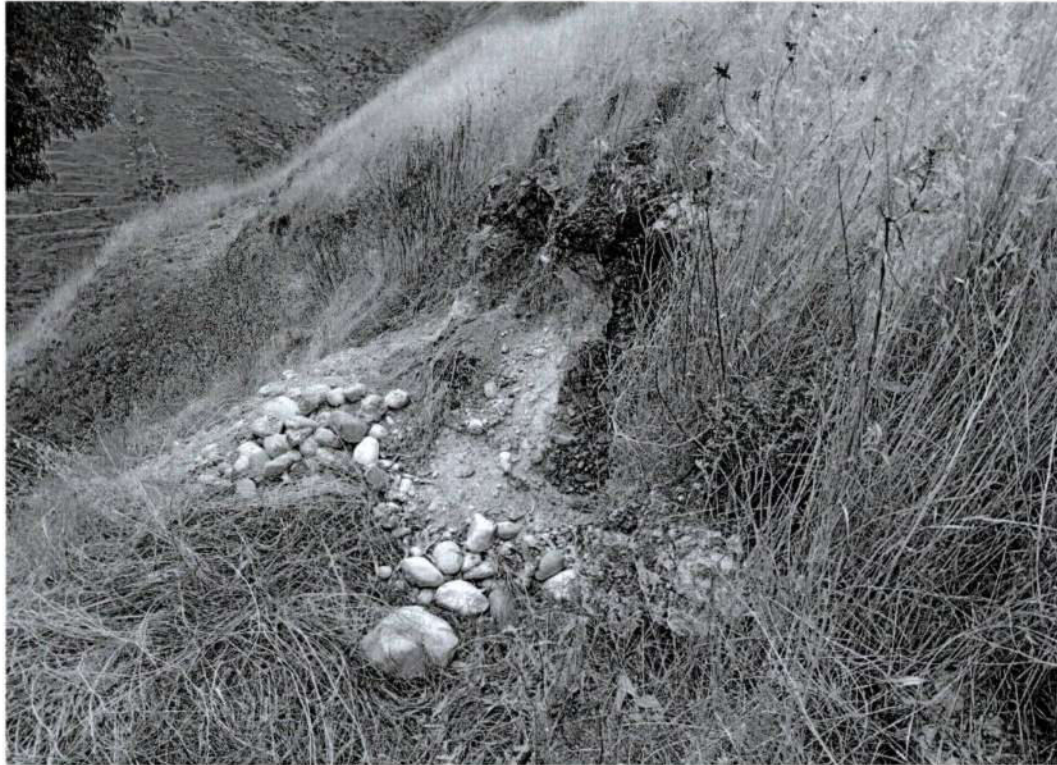
Foto 6. Vista de una quinta afectación por excavaciones clandestinas "huaqueo" (Inspección 13/10/2025).