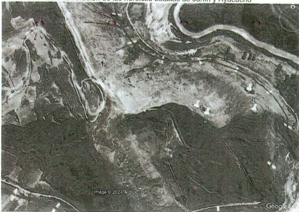
Imagen 2.- Vista del sitio arqueológico de Puyhuan donde se ubican las áreas afectadas al interior del polígono de delimitación. (fuente Google earth).

"Año del Bicentenario, de la consolidación de nuestra Independencia, y de la conmemoración de las heroicas batallas de Junín y Ayacucho"