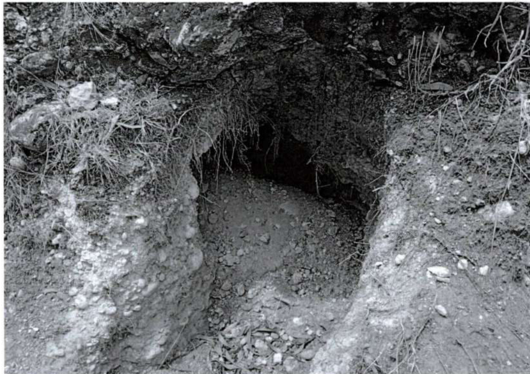
Foto 7. Vista de una sexta afectación por excavación clandestina en el sitio arqueológico de Puyhuan (inspección, 13/10/2025)