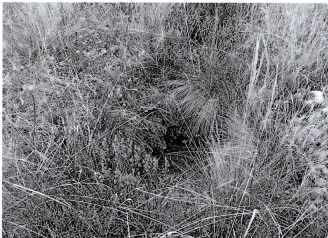
Foto 4. Vista de una tercera afectación por excavación clandestina "huaqueo" (Inspección 13-10-2025).