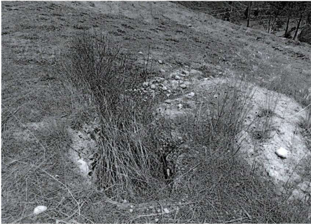
Foto 2. Vista de primera afectación por excavaciones clandestinas (Inspección 13/10/2025).