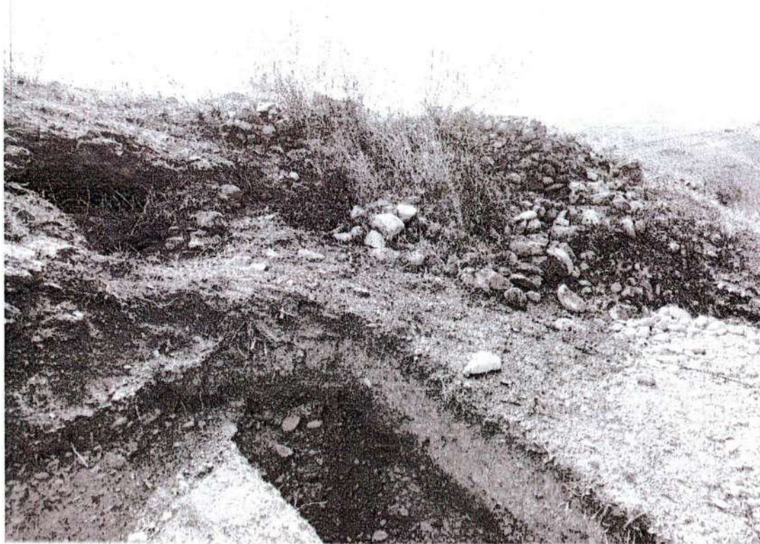
Foto. 9: vista de la excavación privada. Junto a un montículo de piedras las cuales son colapsos de muro de plataforma "afectación 3" (inspección 08/11/2024).

[Handwritten signature] Lic. Arq. Víctor Barral Quispe COARPE N° 042241