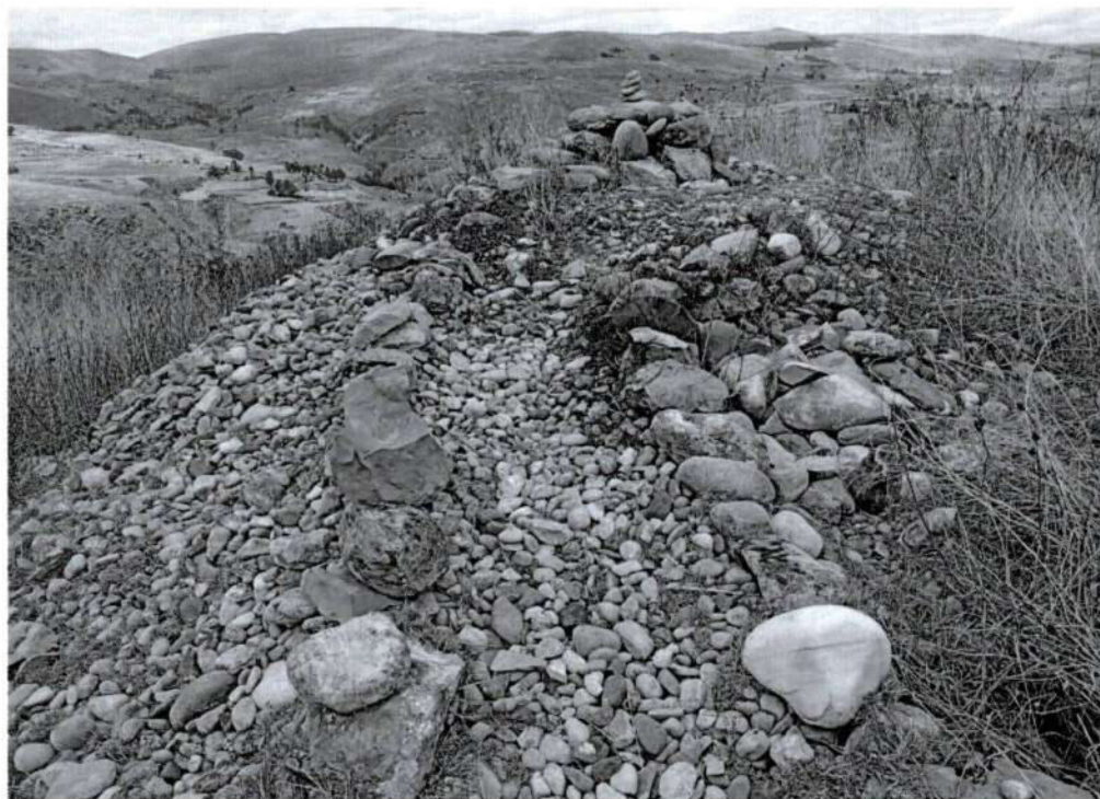
Foto 14, vista en detalle del cima de la colina del sitio arqueológico de Puyhuan, con evidencia de montículo de piedra. (inspección. 13/10/2025)