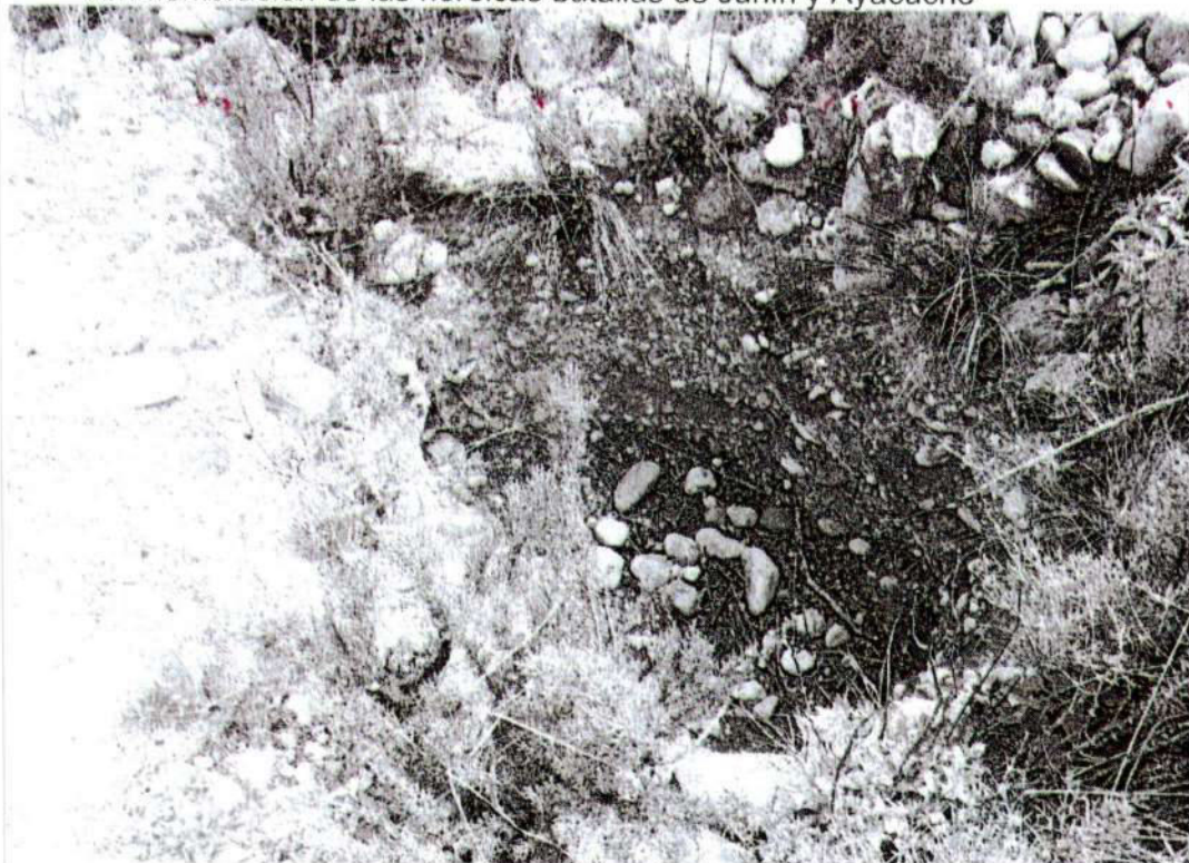
Foto. 20: vista de la excavación clandestina "huaquero" ubicado junto a la plataforma central, "afectación 4" (inspección 08/11/2024).

"Año del Bicentenario, de la consolidación de nuestra Independencia, y de la conmemoración de las heroicas batallas de Junín y Ayacucho"