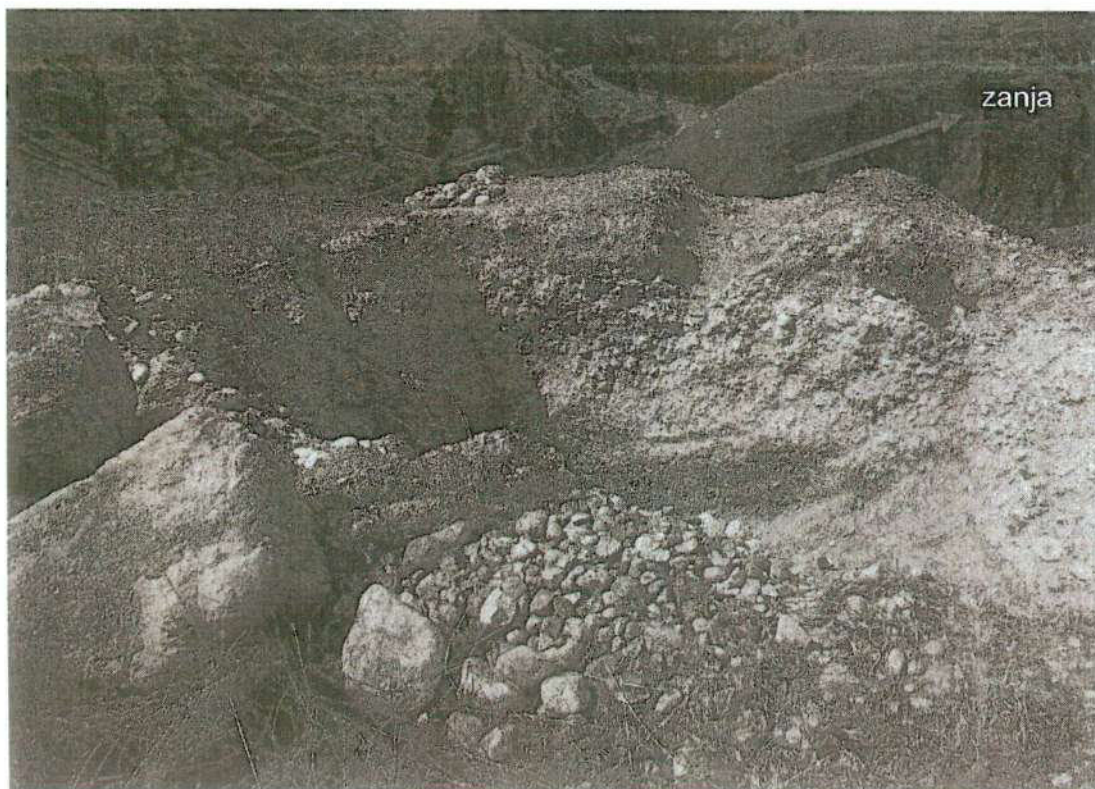
Foto. 3: vista de la excavación profunda con maquinaria pesada donde se evidencia una zanja para posible conducción de agua. "afectación 1" (inspección 08/11/2024).

Luc Arqolo, Juan Victor Barrial Quispe COARPE N° 042241