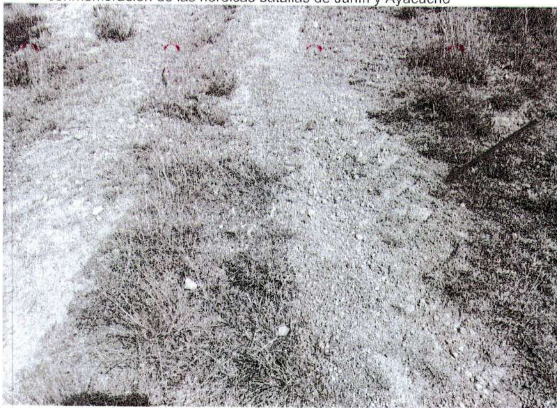
Foto. 24: vista del ingreso de vehículo pesado (tractor) al área intangible del sitio arqueológico de Puyhuan. (inspección 08/11/2024).

"Año del Bicentenario, de la consolidación de nuestra Independencia, y de la conmemoración de las heroicas batallas de Junín y Ayacucho"