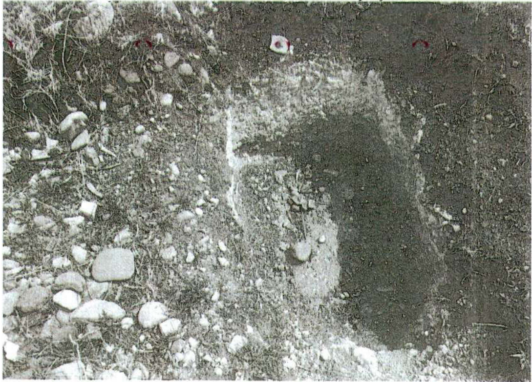
Foto. 6: vista de la excavación con remoción de tierra ubicado al interior del sitio arqueológico de Puyhuan. "afectación 2" (inspección 08/11/2024).

"Año del Bicentenario, de la consolidación de nuestra Independencia, y de la conmemoración de las heroicas batallas de Junín y Ayacucho"