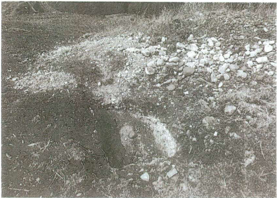
Foto. 7: vista del desmonte de la excavación junto a piedras sueltas de posible muro de contención. "afectación 2" (inspección 08/11/2024).