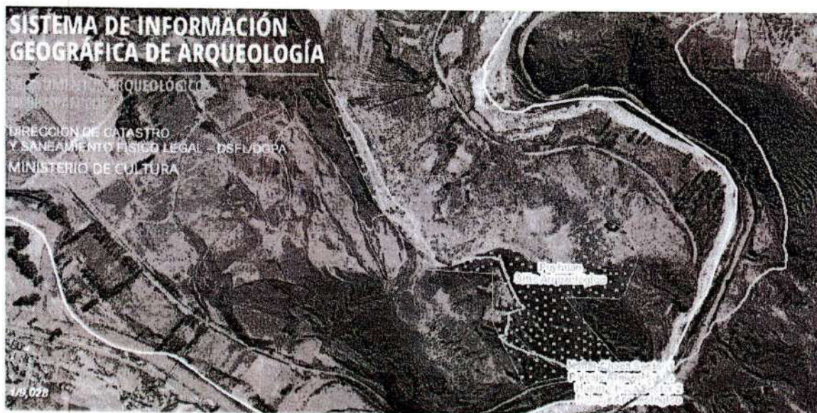
Imagen 1.- Vista del sitio arqueológico de Puyhuan, ubicado en el SIGDA del ministerio de cultura (Fuente: SIGDA Ministerio de Cultura del Perú).