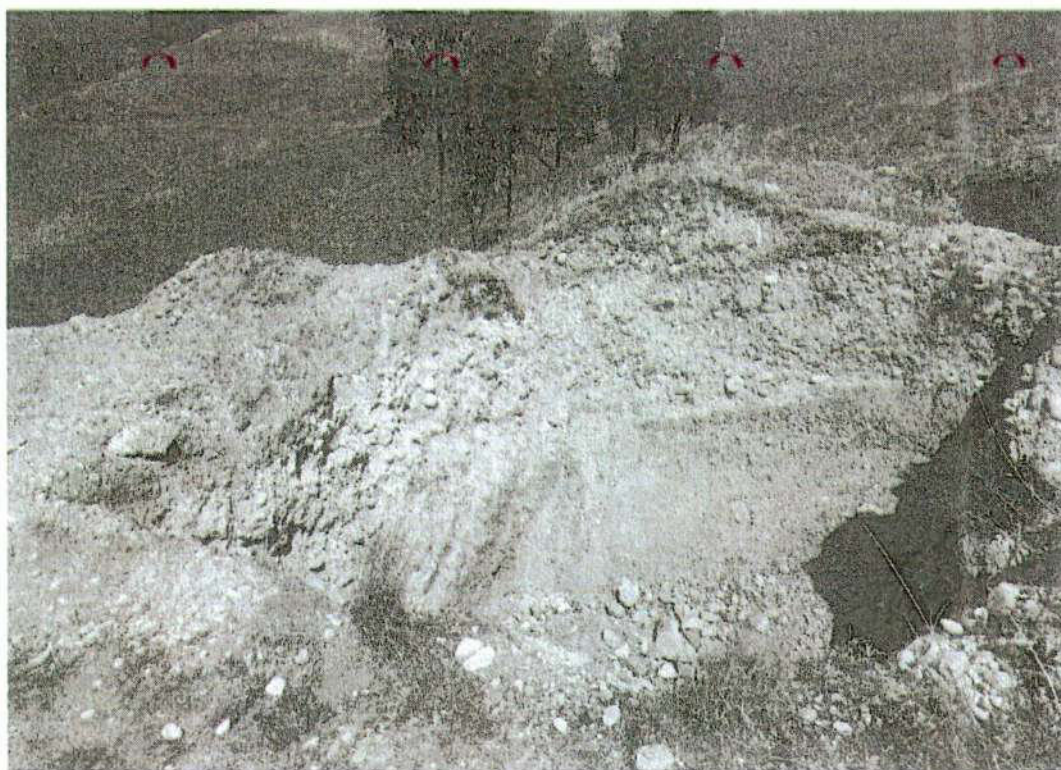
Foto. 2: vista de la excavación profunda con maquinaria pesada al interior del sitio arqueológico de Puyhuan. "afectación 1" (inspección 08/11/2024).

"Año del Bicentenario, de la consolidación de nuestra Independencia, y de la conmemoración de las heroicas batallas de Junín y Ayacucho"