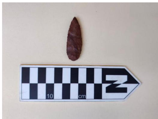
Imagen 05. Vista de punta de proyectil