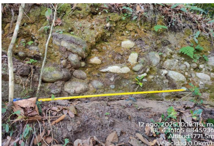
Imagen 03. Vista de muro de plataforma de montículo del sector 1 del sitio arqueológico de Pampachica.