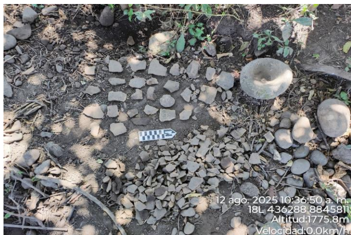
Imagen 04: Vista de material disturbado del sector 2 del sitio arqueológico de Pampachica.