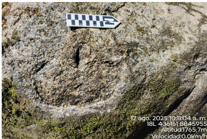
Imagen 01. Vista de petroglifo en sector 1 del sitio arqueológico de Pampachica.