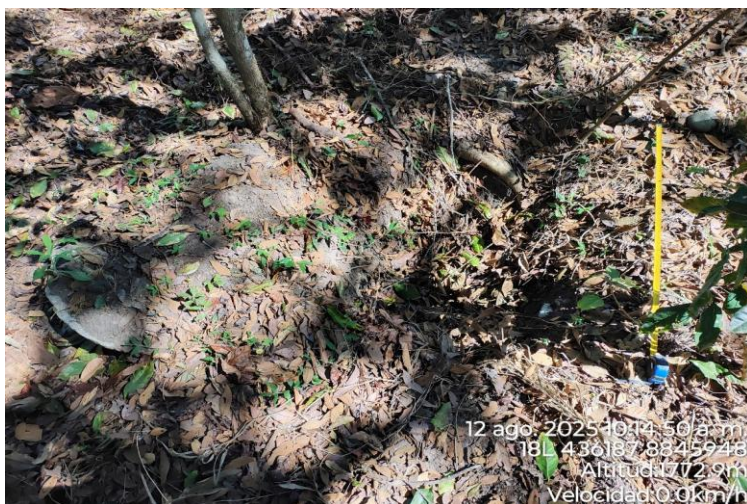
Imagen 02. Vista de huaqueo en el sector 1 del sitio arqueológico de Pampachica