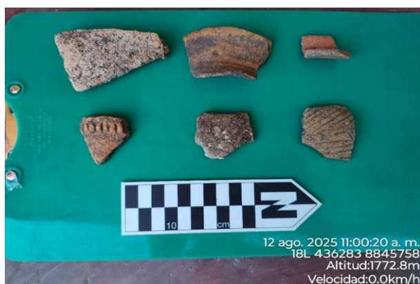
Imagen 06. vista de fragmentería cerámica disturbada encontrada en el área huaqueada