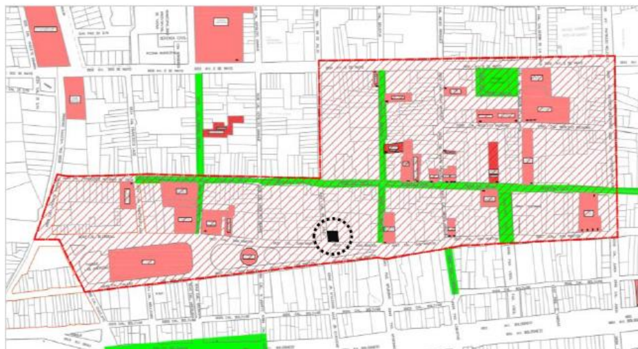
Imagen N° 1: ubicación del bien materia de análisis

Detalle: Resolución Viceministerial N° 138-2014-VMPCIC-MC – Ubicación del inmueble en relación a la zona monumental de Tacna.