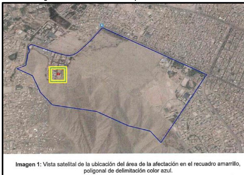
Figura N° 1 – Ubicación de la presunta alteración