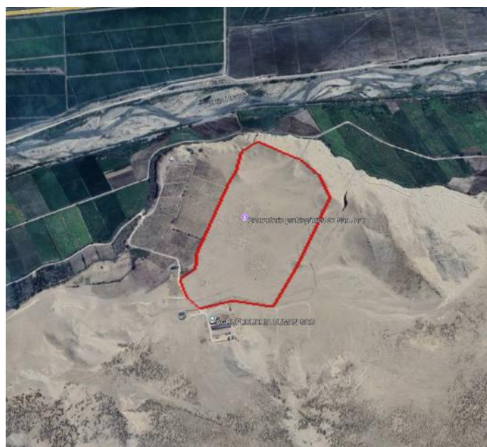
Imagen 1.- Polígono de delimitación de Cementerio de San Juan.

De acuerdo Informe de Inspección N°008-2025-LAMS/DCS/DGDP/VMPCIC/MC, se accede al sitio arqueológico por la vía Huaura-Sayán, hasta el desvío al centro poblado Huacán, para luego seguir por una vía carrozable hacia la agropecuaria DUMAN S.A. El sitio arqueológico “se trata de un cementerio del [período] Intermedio Tardío, con estructuras funerarias de planta rectangular. El material constructivo son adobes y tapial en la base del sitio arqueológico (...)”. También se reportó gran cantidad de fragmentos de vasijas de cerámica, textiles y restos óseos. Destaca la presencia de cerámica del estilo Chancay.