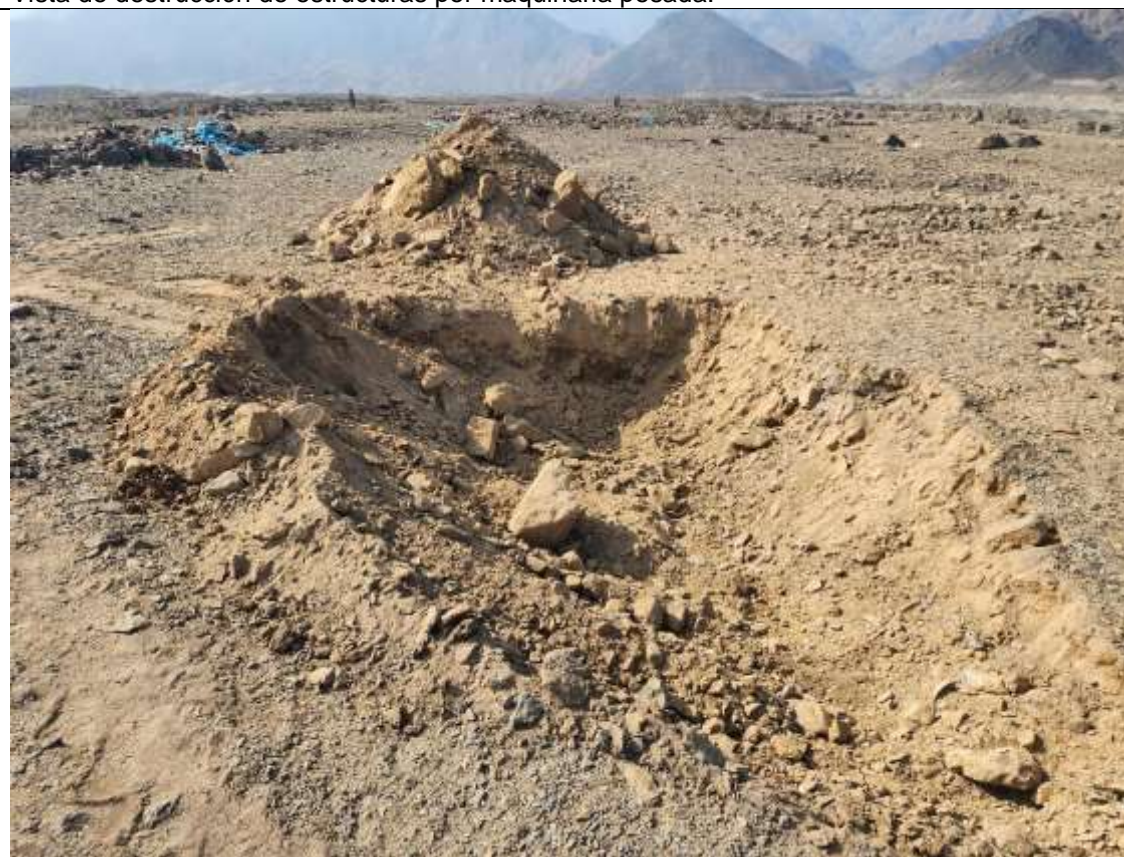
Elementos líticos que componen estructuras arqueológicas destruidos por tránsito de maquinaria pesada.