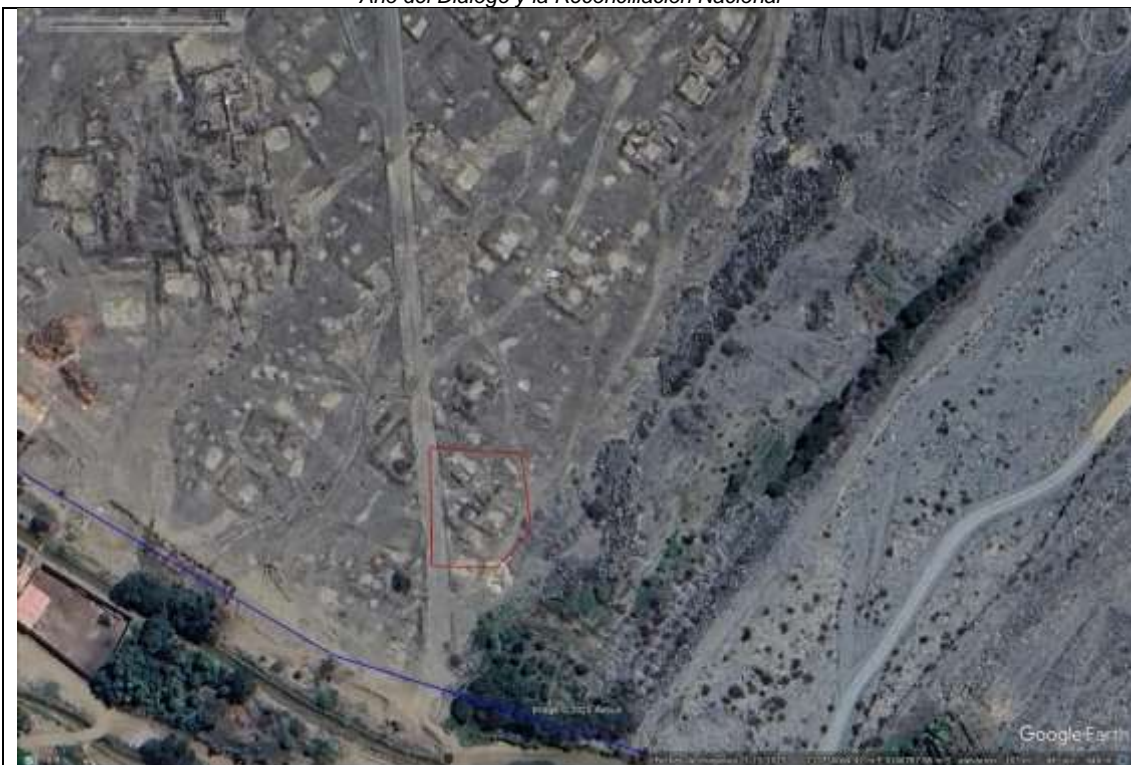
Vista de detalle del área afectada dentro de la poligonal de sitio arqueológico Galindo.

"Decenio de la Igualdad de Oportunidades para mujeres y hombres" "Año del Diálogo y la Reconciliación Nacional"