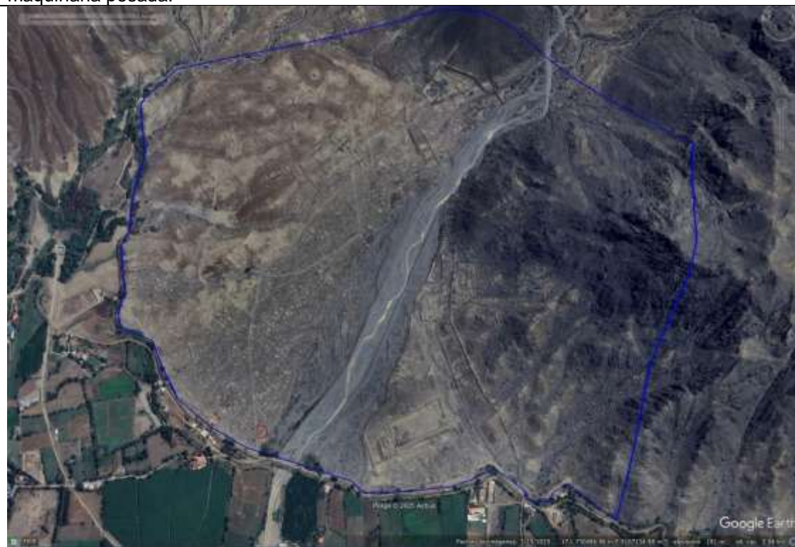
Vista de del polígono de delimitación.