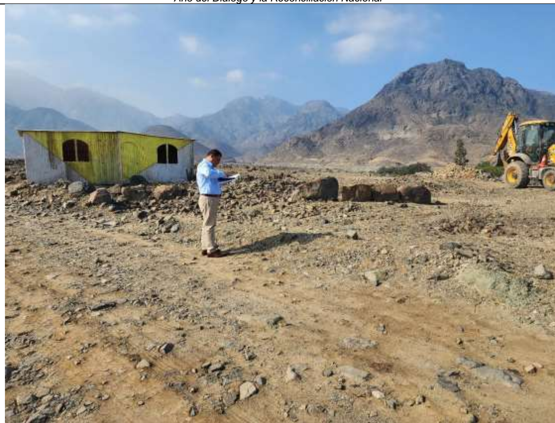
Vista de destrucción de estructuras por maquinaria pesada.

"Decenio de la Igualdad de Oportunidades para mujeres y hombres" "Año del Diálogo y la Reconciliación Nacional"