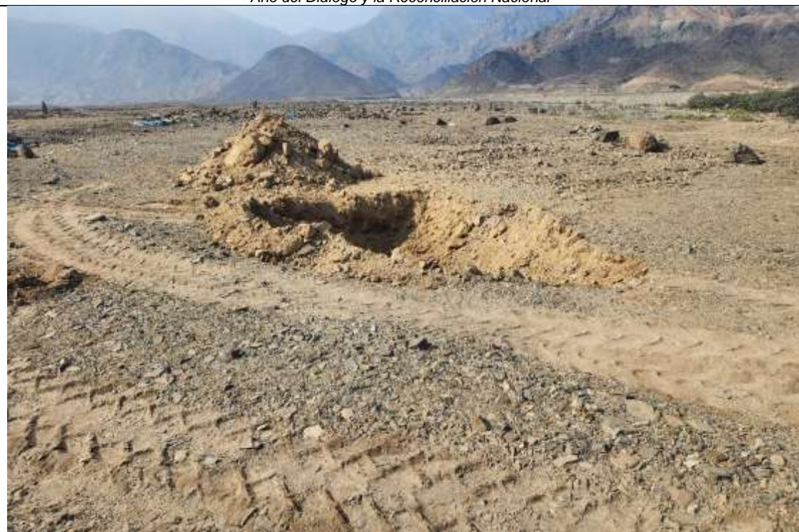
Vista panorámica del área intangible conformante del sitio arqueológico Galindo con maquinaria pesada.

"Decenio de la Igualdad de Oportunidades para mujeres y hombres" "Año del Diálogo y la Reconciliación Nacional"