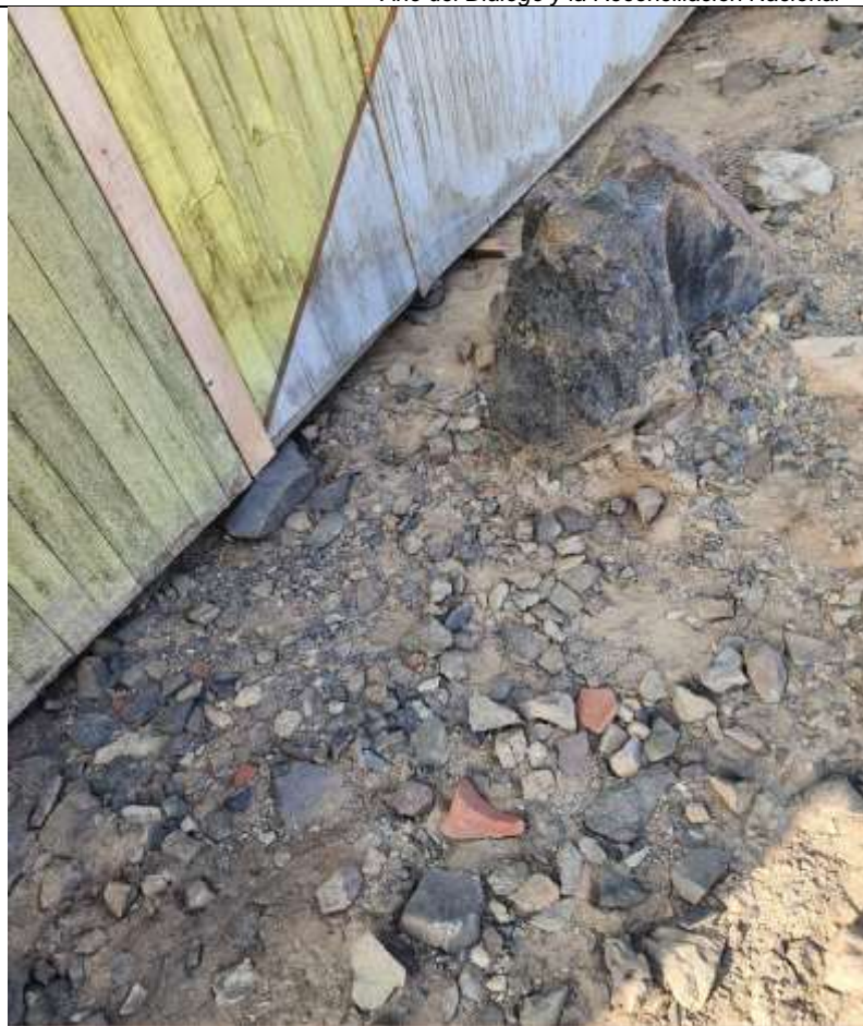
Detalle de fragmentos de cerámica, dentro del Sitio Arqueológico Galindo, al pie de caseta de madera

"Decenio de la Igualdad de Oportunidades para mujeres y hombres" "Año del Diálogo y la Reconciliación Nacional"