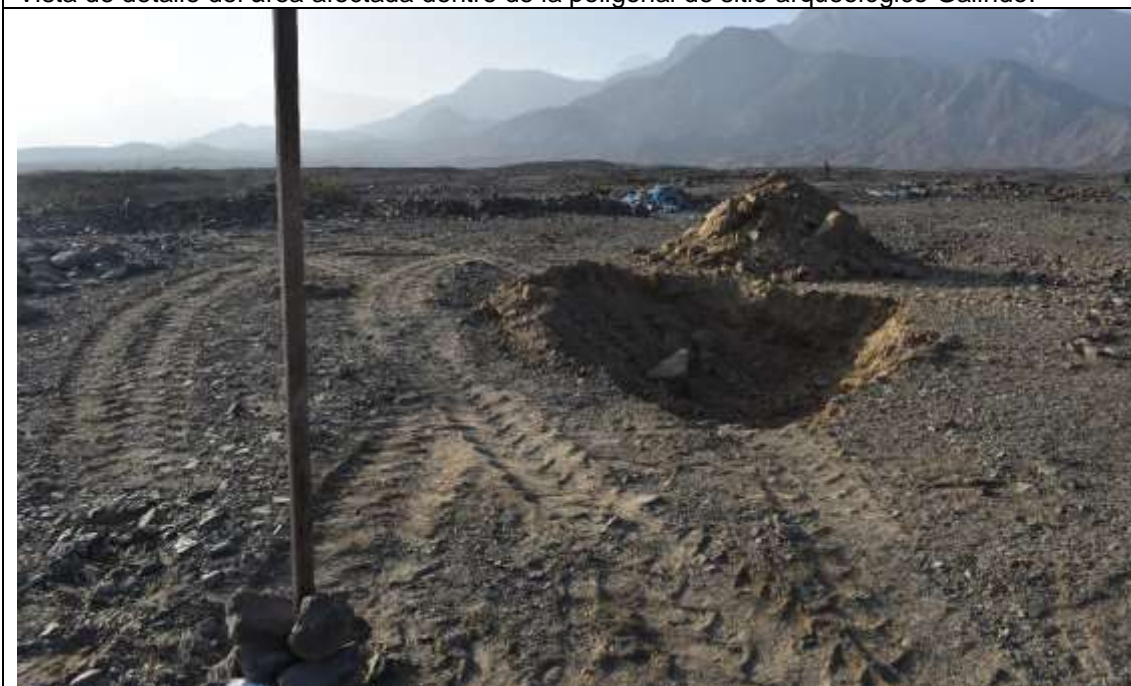
Palos de madera y excavaciones recientes en el sitio arqueológico Galindo