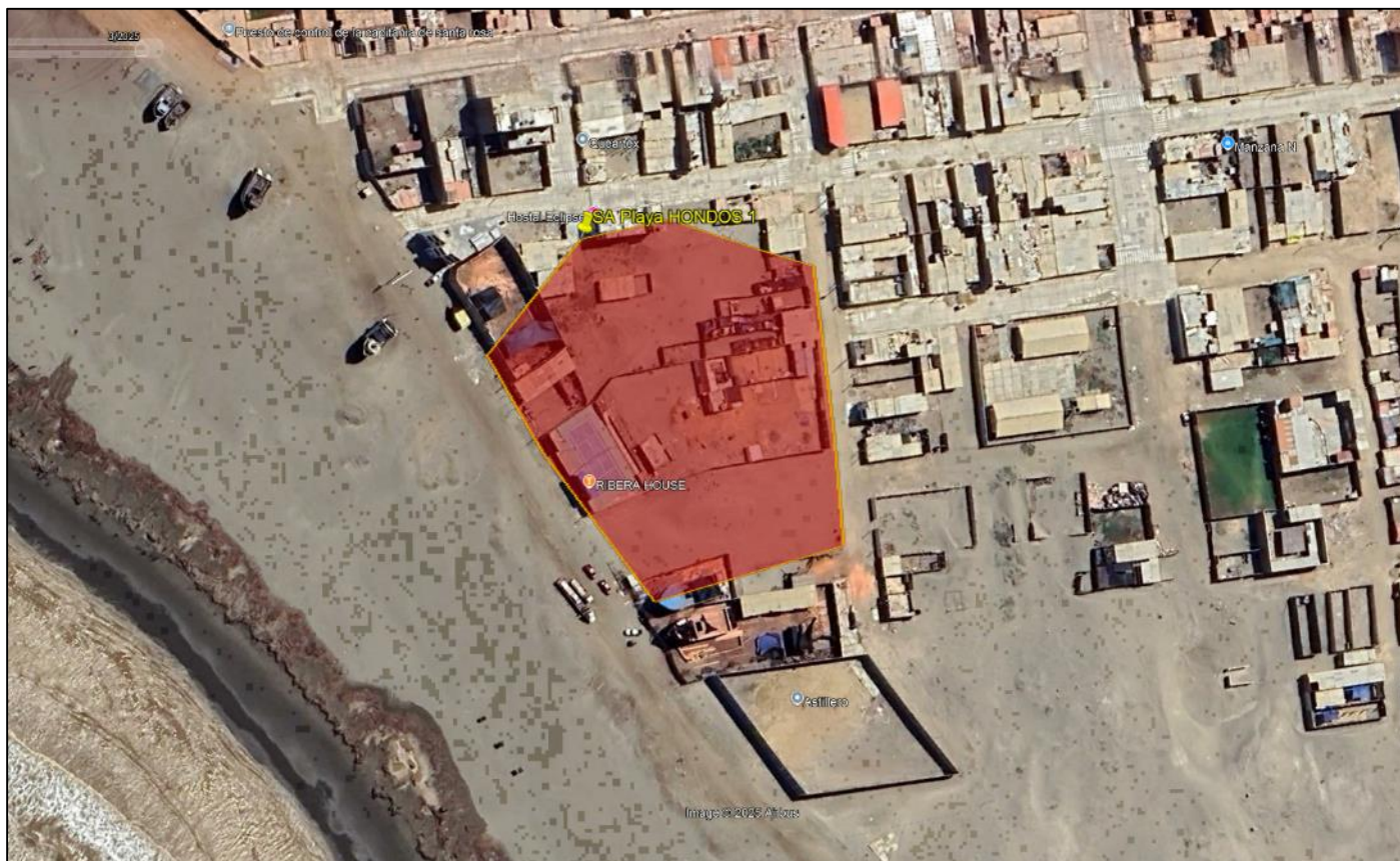
IMAGEN N°02: fotografía del lado suroeste de montículo prehispánico de Playa Hondos 1.

IMAGEN N°01: imagen tomada del S.I.G.D.A indicando el polígono (color amarillo) del sitio arqueológico Playa Hondos 1.