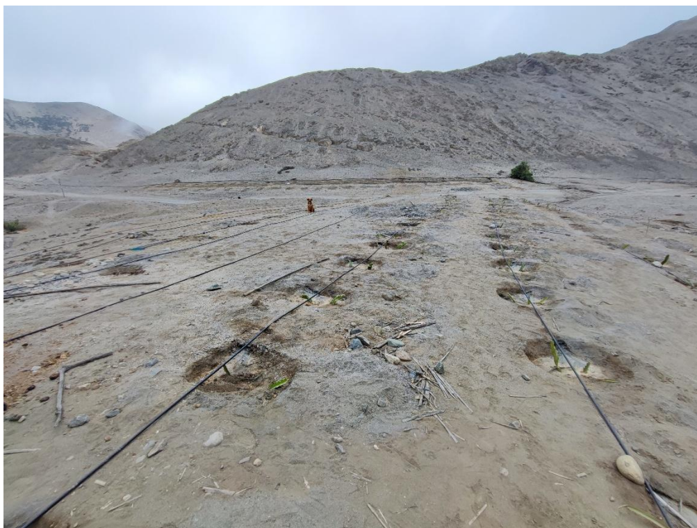
Sitio Arqueológico Quelca. Ampliación de área agrícola mediante hoyos generados para el sembrado de tunas e irrigado mediante sistema tecnificado