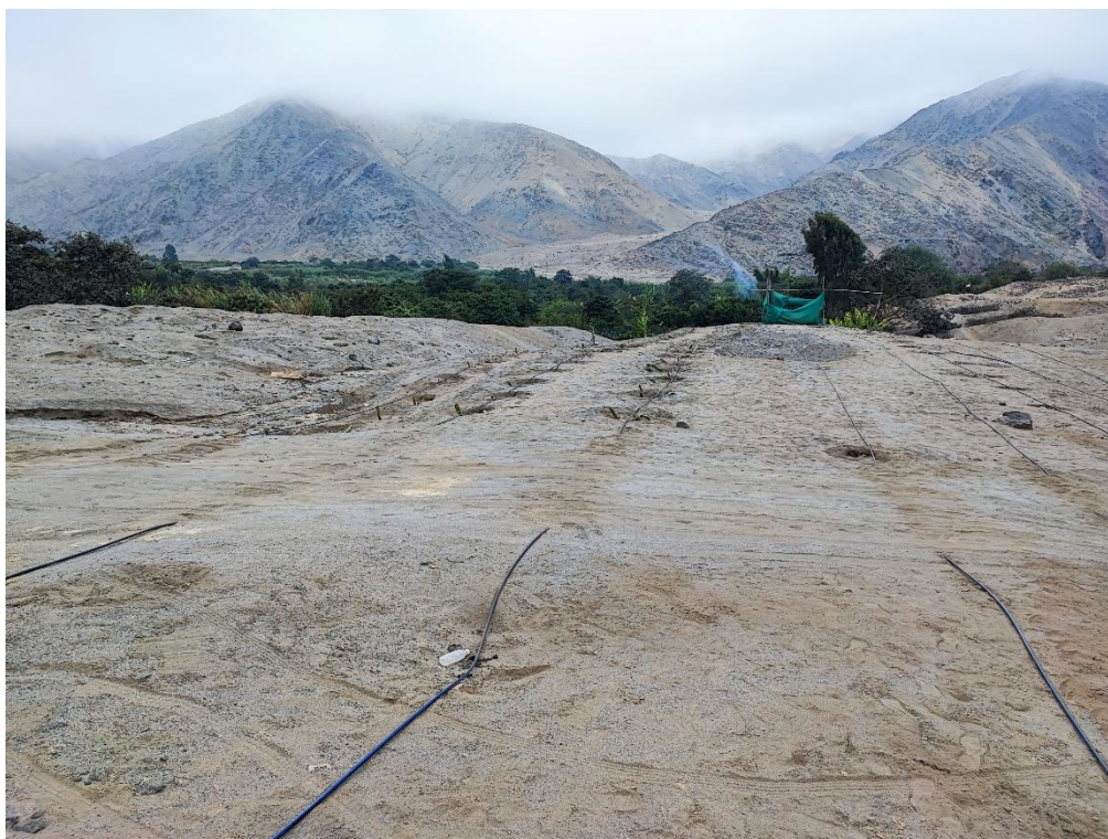
Sitio Arqueológico Quelca. Ampliación de área agrícola mediante hoyos generados para el sembrado de tunas e irrigado mediante sistema tecnificado.