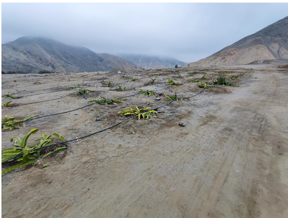
Sitio Arqueológico Quelca. Ampliación de área agrícola mediante hoyos generados para el sembrado de tunas e irrigado mediante sistema tecnificado