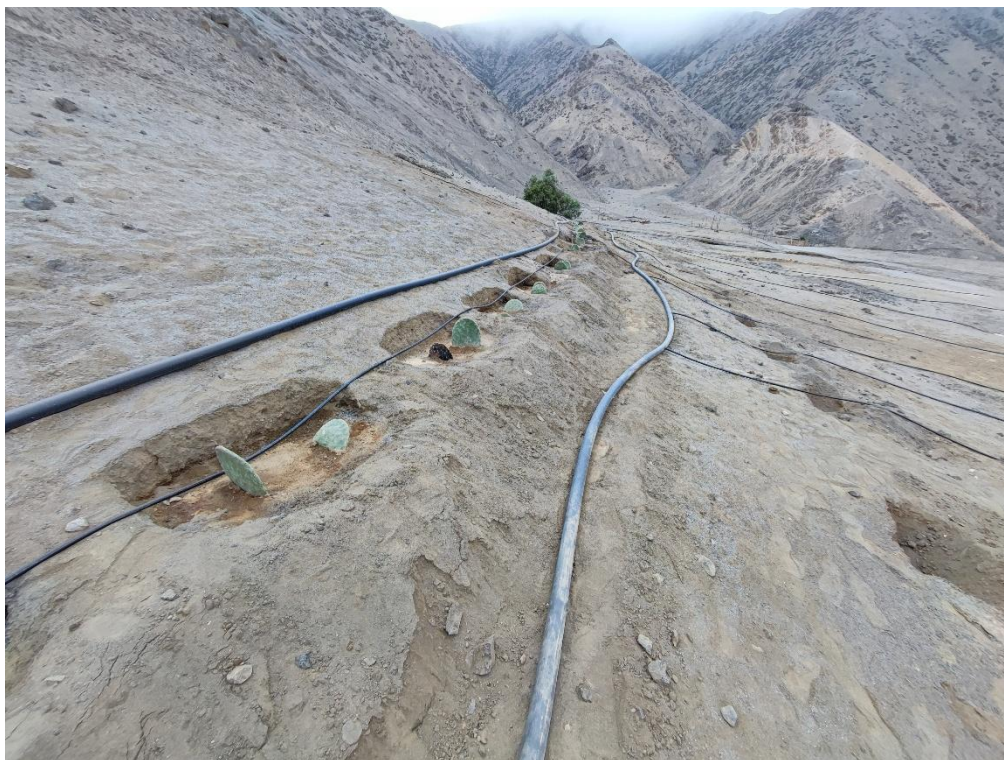
Sitio Arqueológico Quelca. Hoyos generados para el sembrado de tunas e irrigado mediante sistema tecnificado.

Las fotos deberán mostrar lo indicado en la valoración cultural (debe observarse de manera evidente la condición de sitio arqueológico del bien):