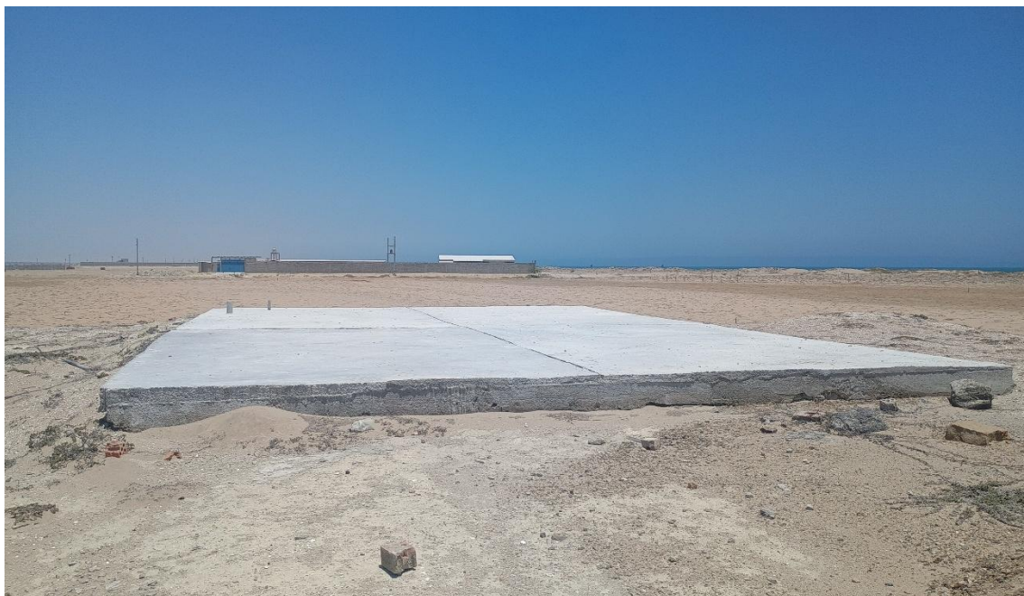
FOTO 01: VISTA DE DETALLE DE LOZA DE CEMENTO SOBRE LA LOMA EN EL SITIO ARQUEOLOGICO CONCHALES DE MATA CABALLO-SECHURA