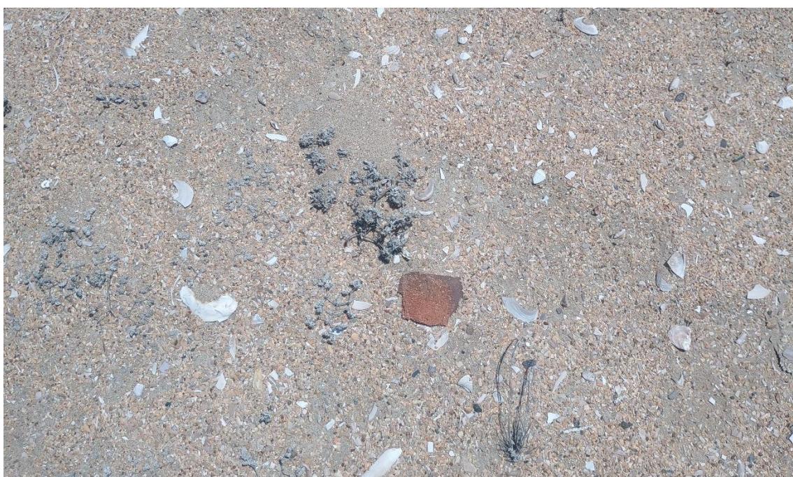
FOTO 06: VISTA DE DETALLE DE RESTOS MALACOLÓGICOS Y FRAGMENTERÍA DE CERÁMICA EN EL SITIO ARQUEOLÓGICO CONCHALES DE MATA CABALLO-SECHURA