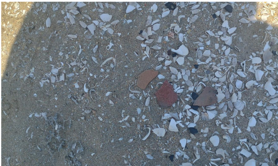
FOTO 05: VISTA DE DETALLE DE RESTOS MALACOLÓGICOS Y FRAGMENTERÍA DE CERÁMICA EN EL SITIO ARQUEOLÓGICO CONCHALES DE MATA CABALLO-SECHURA