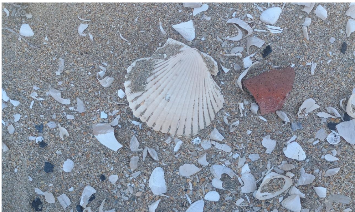
FOTO 07: VISTA DE DETALLE DE RESTOS MALACOLÓGICOS Y FRAGMENTERÍA DE CERÁMICA EN EL SITIO ARQUEOLÓGICO CONCHALES DE MATA CABALLO-SECHURA