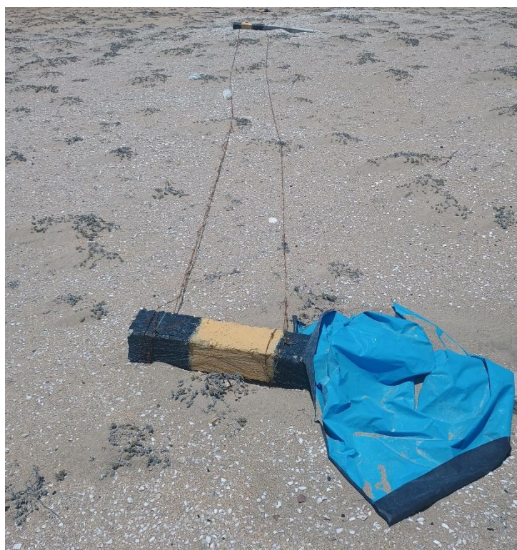
FOTO 04: VISTA DE DETALLE DE CERCO DE ALAMBRE CON HITOS DE CEMENTO EN EL SITIO ARQUEOLÓGICO CONCHALES DE MATA CABALLO-SECHURA