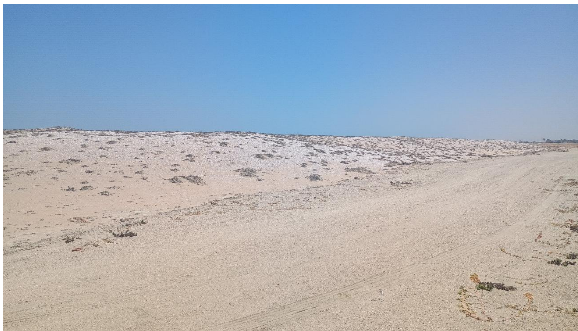
FOTO 02: VISTA DE DETALLE TROCHA CARROZABLE ALEDAÑO AL SITIO ARQUEOLOGICO CONCHALES DE MATA CABALLO-SECHURA