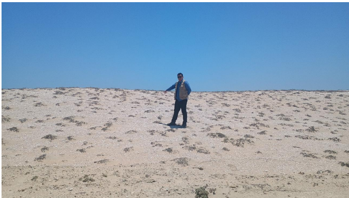
FOTO 09: VISTA DE LA INSPECCIÓN OCULAR EN EL SITIO ARQUEOLÓGICO CONCHALES DE MATA CABALLO-SECHURA

DIRECCIÓN DESCONCENTRADA DE CULTURA PIURA