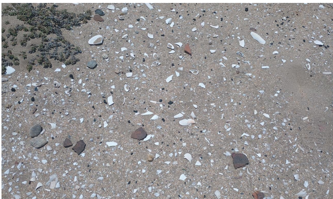
FOTO 08: VISTA DE DETALLE DE RESTOS MALACOLÓGICOS Y FRAGMENTERÍA DE CERÁMICA EN EL SITIO ARQUEOLÓGICO CONCHALES DE MATA CABALLO-SECHURA