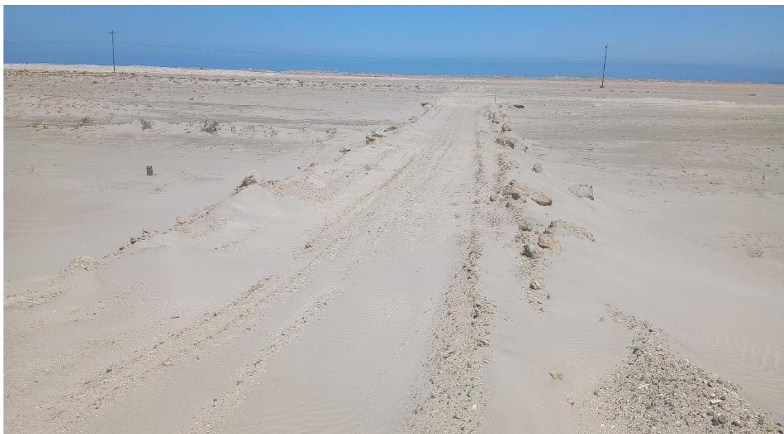
FOTO 03: VISTA DE DETALLE TROCHA CARROZABLE ALEDAÑO AL SITIO ARQUEOLOGICO CONCHALES DE MATA CABALLO-SECHURA

DIRECCIÓN DESCONCENTRADA DE CULTURA PIURA