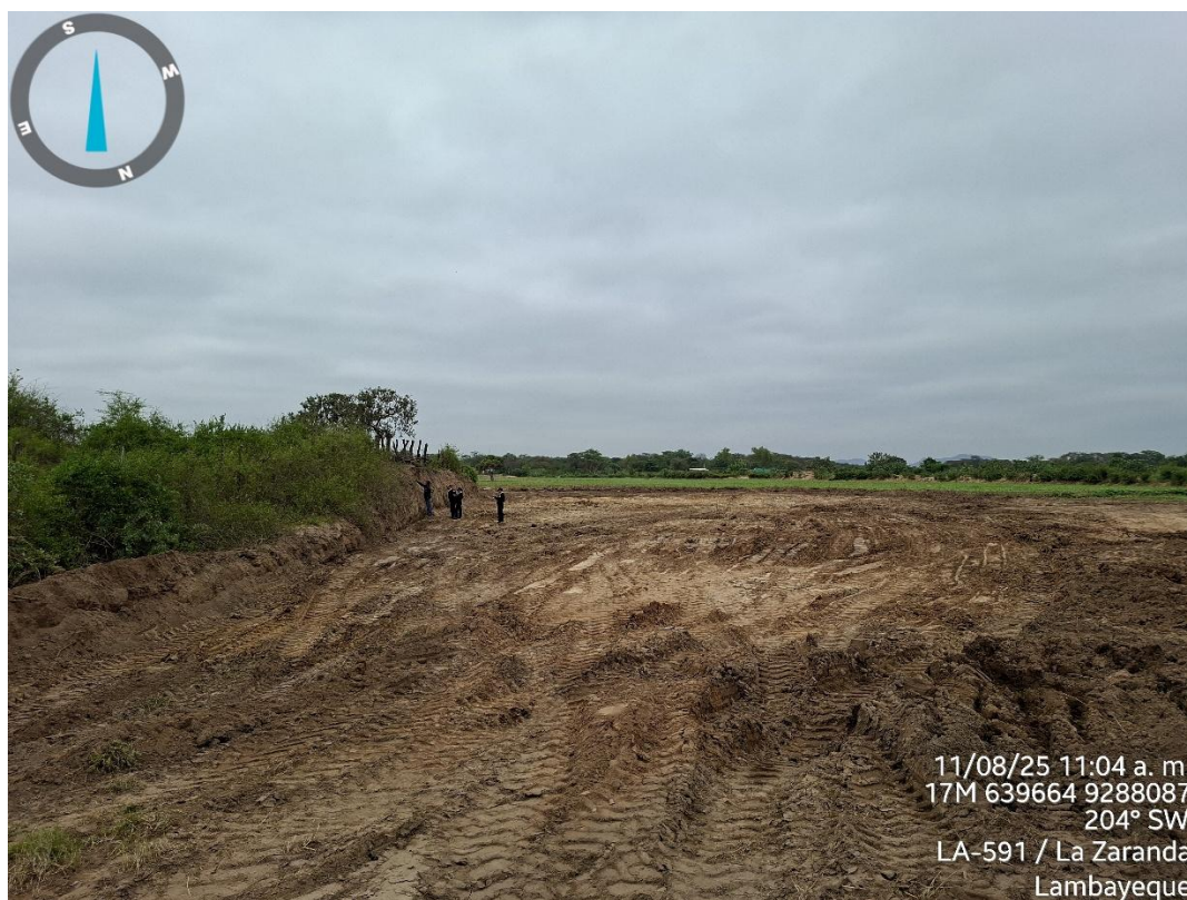
IMAGEN N° 6: Evidencia de las huellas de la maquinaria pesada usada para la nivelación del terreno y el perfilado del montículo.