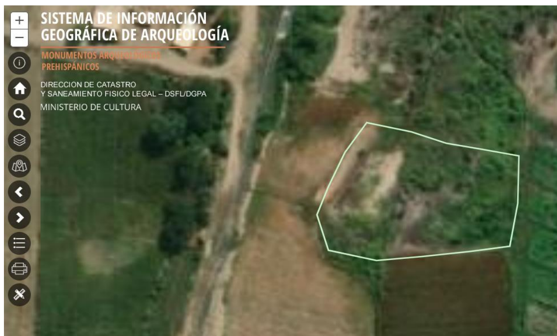
IMAGEN N° 1: Imagen tomada del S.I.G.D.A indicando la propuesta del polígono (color blanco) del sitio arqueológico Huaca Relaiza.