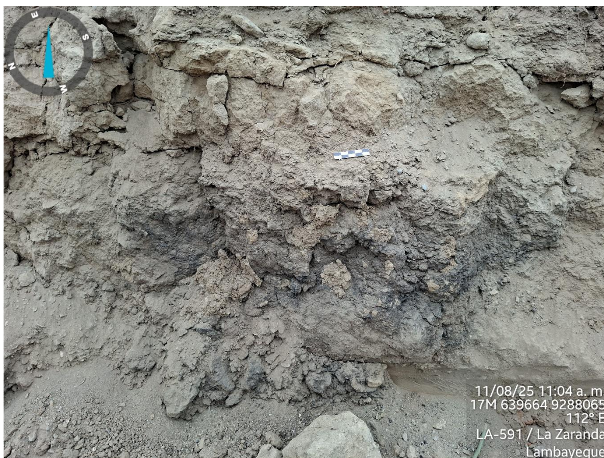
IMAGEN N° 4: Presencia de quema en el perfil del montículo.