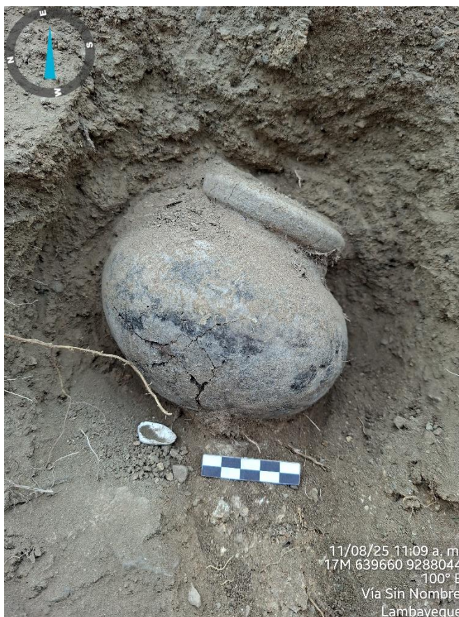
IMAGEN N° 5: Cerámica completa, correspondiente a una olla que se encontraba en el perfil del montículo, fue rescatada y llevada al Museo Nacional de Sicán.

"Decenio de la Igualdad de Oportunidades para Mujeres y Hombres" "Año de la recuperación y consolidación de la economía peruana"