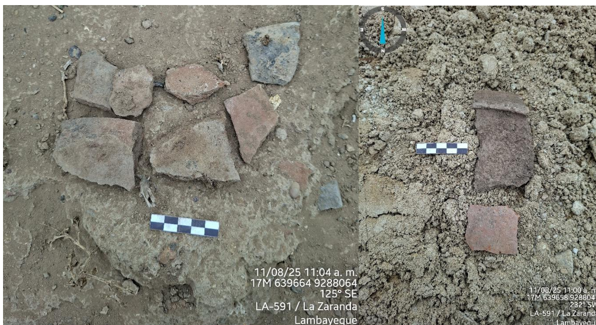
IMAGEN N° 3: Evidencia de la presencia de cerámica en superficie.

"Decenio de la Igualdad de Oportunidades para Mujeres y Hombres" "Año de la recuperación y consolidación de la economía peruana"