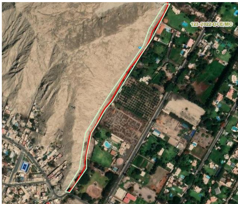
Imagen 1.- Poligonal de delimitación de protección provisional del Paisaje Arqueológico Camino Inca Tramo Xauxa – Pachacamac, sub tramo Sisicaya – Pachacamac

pérdida o deterioro total o parcial de dicho bien cultural. Tomando en cuenta los argumentos citados en la Directiva N° 003-2018- VMPCIC/MC y los factores de deterioro del monumento expuestos en el Informe de Inspección N°006-2024-DFA/DCS/DGDP/VMPCIC/MC, se considera que la solicitud de protección provisional cumple con los requisitos técnicos necesarios para determinar la medida.