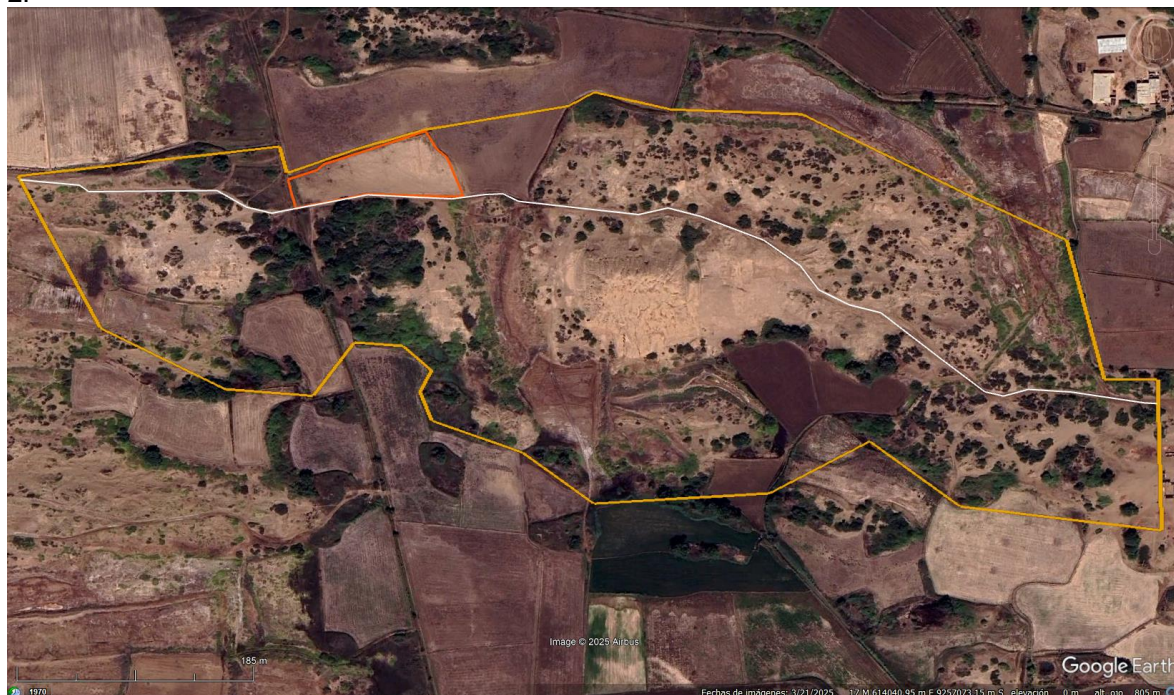
IMAGEN N°01: fotografía satelital tomada del software Google Earth, mostrando el polígono del BIP (color amarillo); además, afectaciones al interior del BIP, polígono naranja caso 1 y trazo blanco caso 2.