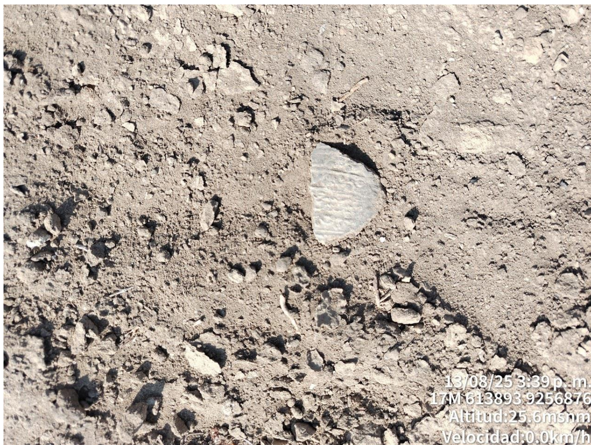
IMAGEN N°05: fotografía de la parte inicial de la afectación 2. Nótese la adaptación del terreno para la trocha carrozable.

IMAGEN N°04: fotografía del fragmento de cerámica en superficie del área nivelada.