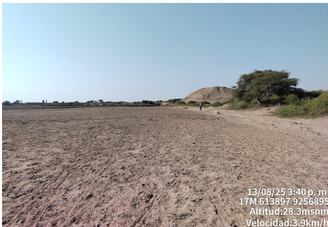
IMAGEN N°03: fotografía de la afectación 1, producida en el lado suroeste del BIP. Nótese la nivelación del área para fines agrícolas.

IMAGEN N°02: fotografía de la afectación 1, producida en el lado suroeste del BIP. Nótese la nivelación del área muy próxima a la zona monumental.