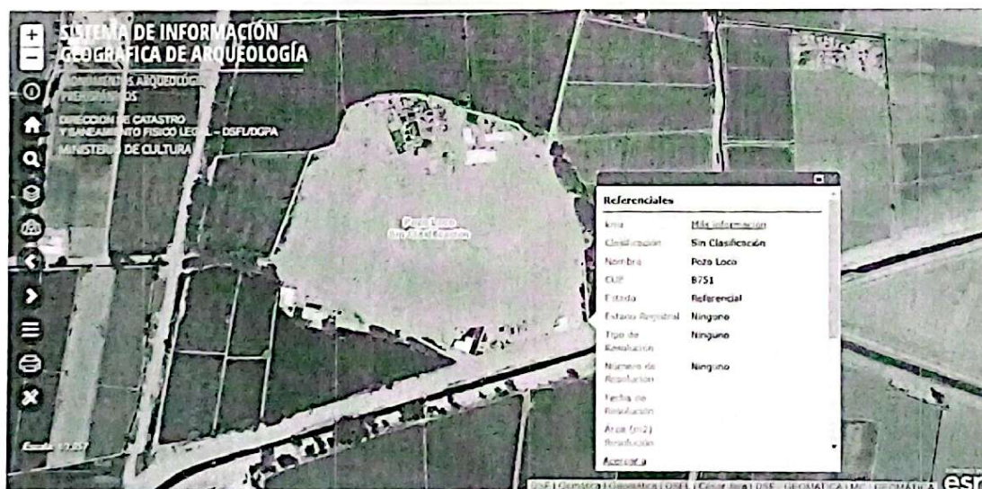
IMAGEN N°01: IMAGEN TOMADA DEL S.I.G.D.A. DEL SITIO ARQUEOLÓGICO HUACA POZO LOCO O CERDÁN, LA VICTORIA, CHICLAYO.