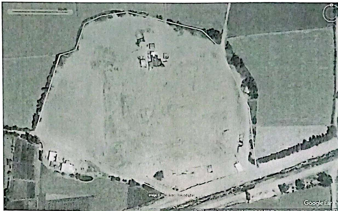
IMAGEN N°03: IMAGEN SATELITAL DEL GOOGLE EARTH DE FECHA FEBRERO DEL 2024, QUE MUESTRA EL AVANCE DE LAS CONSTRUCCIONES AL INTERIOR DE LA POLIGONAL DEL SITIO ARQUEOLÓGICO HUACA POZO LOCO O CERDÁN.

IMAGEN N°02: IMAGEN SATELITAL DEL GOOGLE EARTH DE FECHA NOVIEMBRE DEL 2013, SE MUESTRAN LAS PRIMERAS CONSTRUCCIONES PRECARIAS EN EL EXTREMO NORTE, SUR Y SURESTE AL INTERIOR DE LA POLIGONAL DEL SITIO ARQUEOLÓGICO HUACA POZO LOCO O CERDÁN.