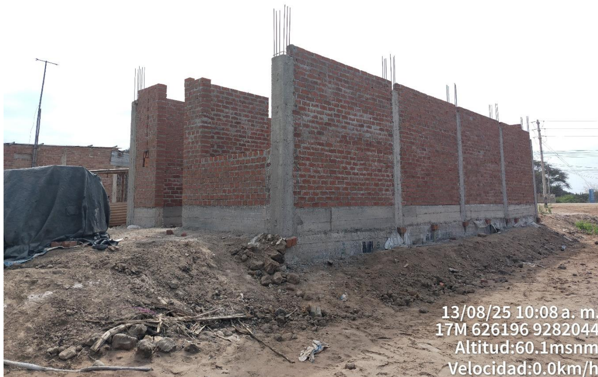
IMAGEN N°05: vista del lado este de la afectación, por asentamiento de estructura de material noble al interior del BIP.

IMAGEN N°04: vista mostrando la afectación del sitio arqueológico, por asentamiento de estructura de material noble al interior del BIP.