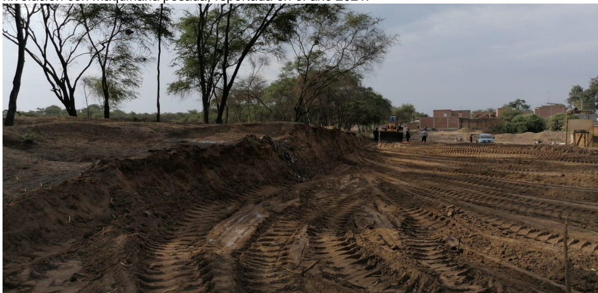
IMAGEN N°03: vista actual mostrando el área reportada en el año 2021.

IMAGEN N°02: vista mostrando la afectación del sitio arqueológico, excavación, remoción y nivelación con maquinaria pesada, reportada en el año 2021.