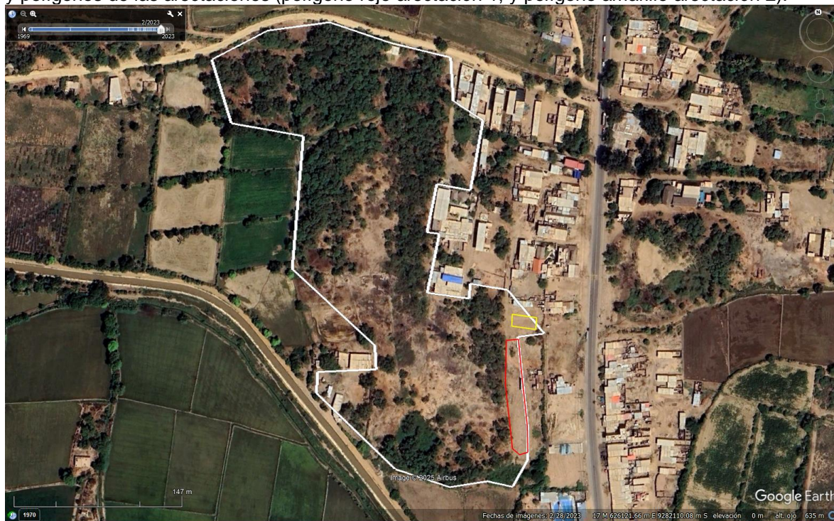
IMAGEN N°01: fotografía satelital tomada del software Google Earth, mostrando la ubicación del BIP y polígonos de las afectaciones (polígono rojo afectación 1, y polígono amarillo afectación 2).