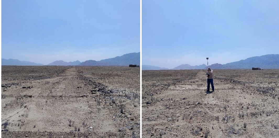
Vista de las huellas de la maquinaria pesada.