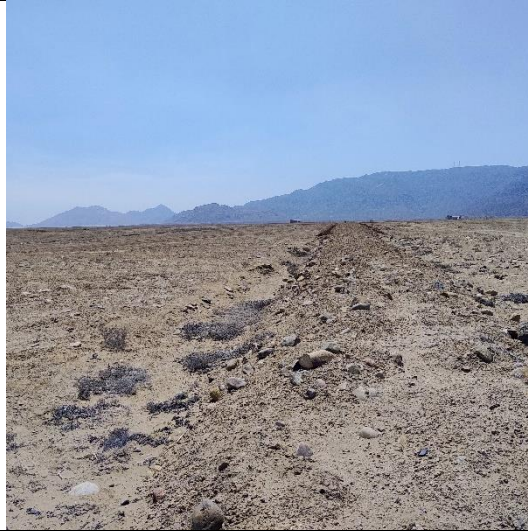
Material removido con abundante material cultural el superficie.