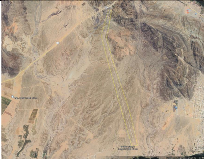
Vista del asentamiento humano ubicado hacia el lado este del polígono.