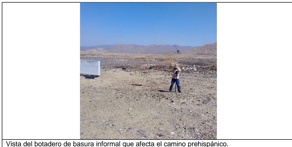
Vista del botadero de basura informal que afecta el camino prehispánico.

Las fotos deberán mostrar lo indicado en la valoración cultural (debe observarse de manera evidente la condición de sitio arqueológico del bien):