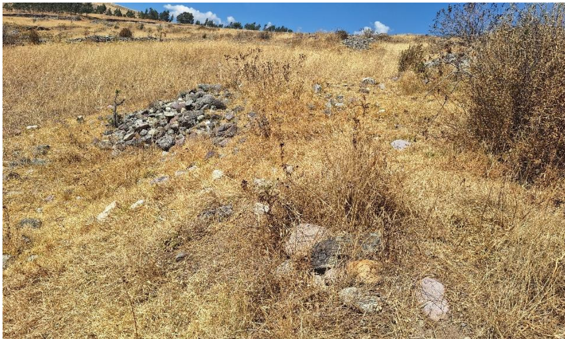
Foto 1. Evidencia de alineamiento de muros y montículo de piedras de muros colapsados.