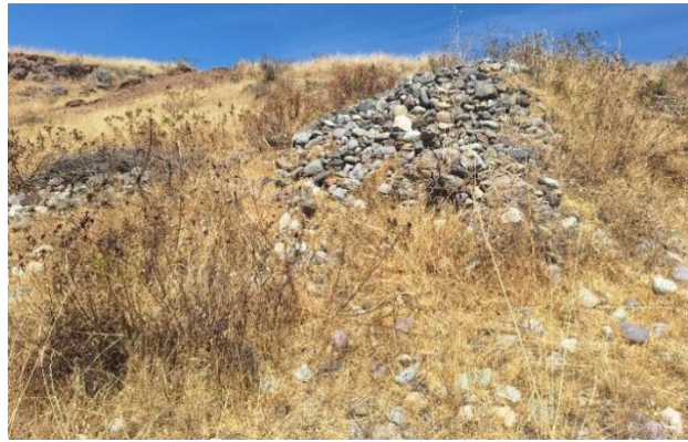
Foto 7y8. Evidencia de material lítico y montículo de piedras parte de estructuras arquitectónicas.