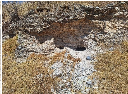
Foto 11y12. Huaqueo donde se evidencia material cultura y piedras tipo laja.