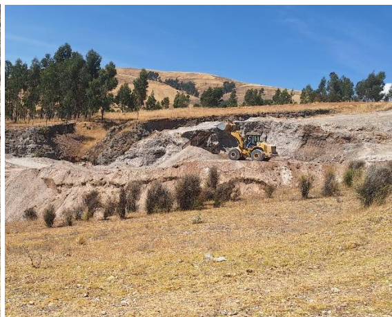
Foto 15y16. Evidencia de material cultural en las áreas donde se están realizando las actividades de excavación y remoción.