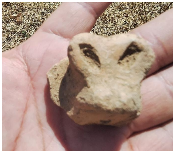
Foto 3y4. Evidencia de fragmentos de cerámica diagnóstica antropomorfo y zoomorfo ubicado.