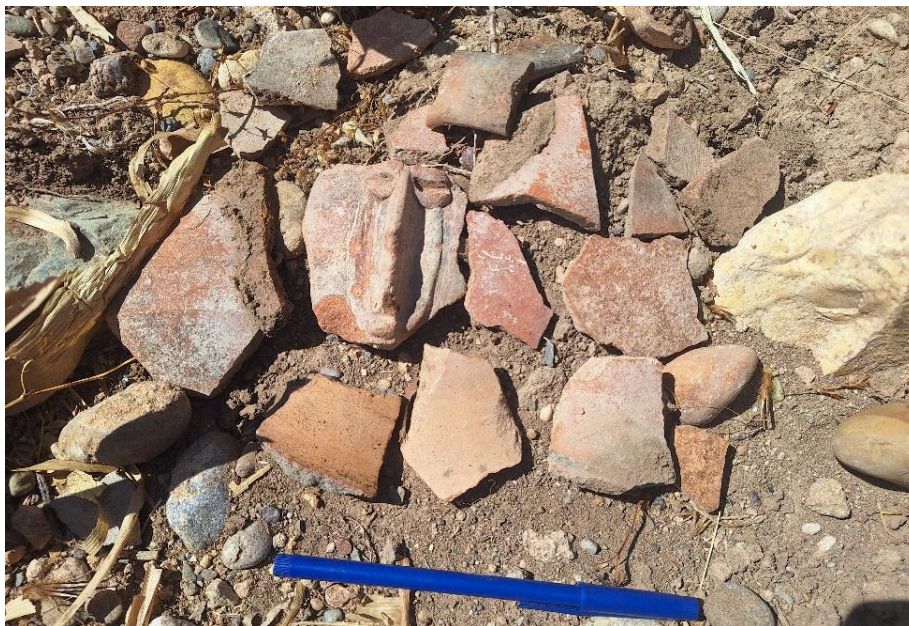
Foto 2. Evidencia de fragmentos de cerámica diagnóstica y no diagnóstica en el sitio arqueológico de Viñac.