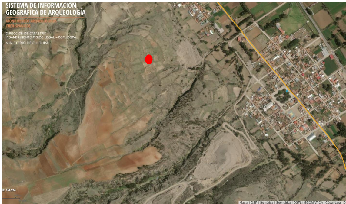
Imagen 1. Área de ubicación del sitio arqueológico Viñac.

Las fotos deberán mostrar lo indicado en la valoración cultural (debe observarse de manera evidente la condición de sitio arqueológico del bien):