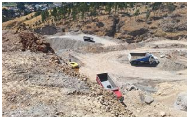
Foto 17y18. Evidencia de los trabajos realizados en la quebrada lado sur del sitio arqueológico Viñac.