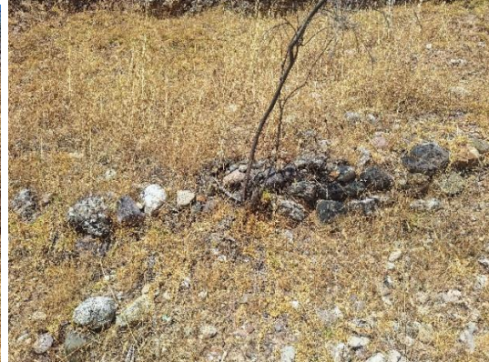
Foto 9y10. Evidencia de muros pertenecientes a estructuras arquitectónicas.