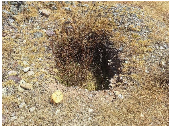
Foto 13y14. Evidencia de excavaciones clandestinas antiguas Huaqueo