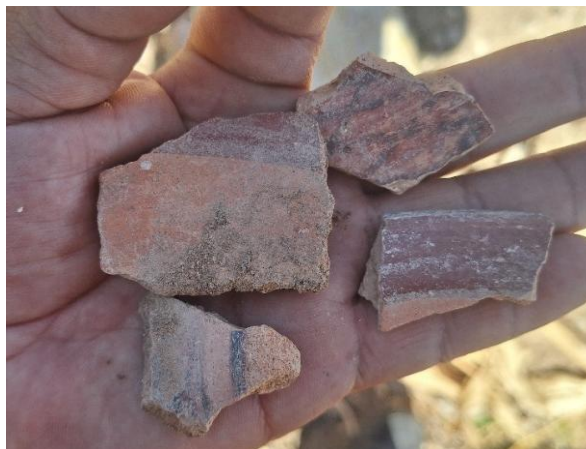
Foto 5y6. Evidencia de fragmentos de cerámica diagnóstica.