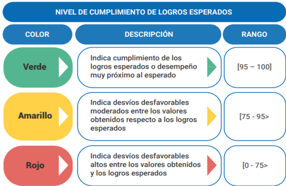
Gráfico 1. Semaforización del nivel de cumplimiento de logros esperados

Para el análisis de implementación de las AEI, se tomará la semaforización del nivel de cumplimiento de logros esperados establecida en la Guía para el seguimiento y evaluación de políticas nacionales y planes del Sinaplan 9 :