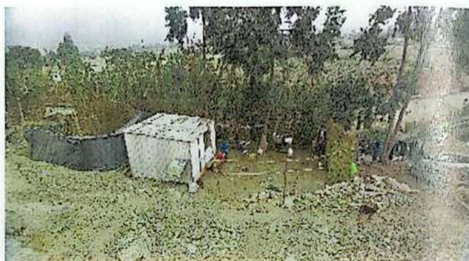
Foto 03: Vista de la vivienda precaria ubicada dentro de la poligonal del sitio Pan de Azúcar, 19.07.2022.