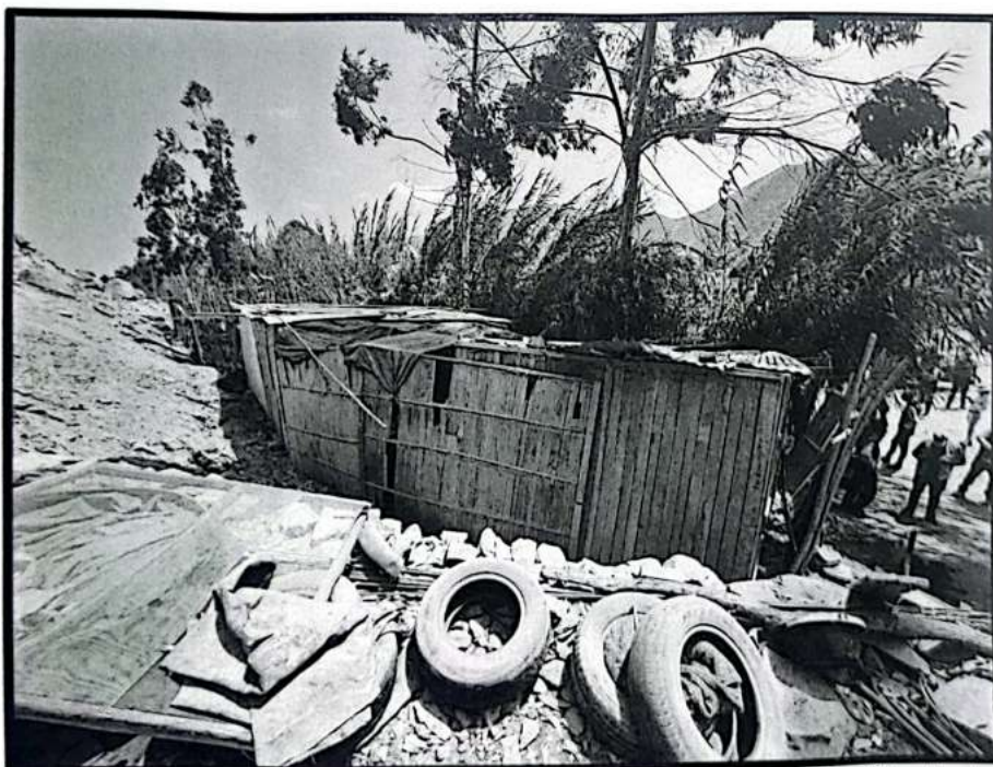
Imagen No 8: Sitio Arqueológico Pan de Azúcar. Fijese el asentamiento de la edificación de material precario ubicado al interior del area intangible.

"Decenio de la Igualdad de Oportunidades para Mujeres y Hombres" "Año de la recuperación y consolidación de la economía peruana"