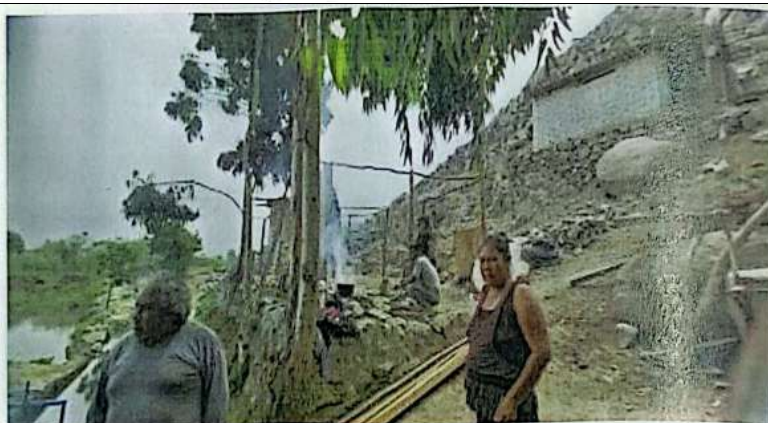
Foto 08: Vista de la estructura de material noble 2 ubicada en la parte superior del sitio arqueológico y la intervención al presunto infractor, en fecha 14.02.2023