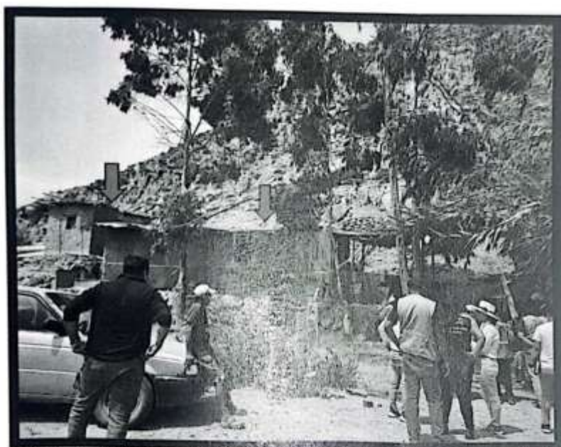
Imagen No 7: Sitio Arqueológico Pan de Azúcar. Véase el asentamiento de la edificación de material noble y precario, ubicado al interior del área intangible.