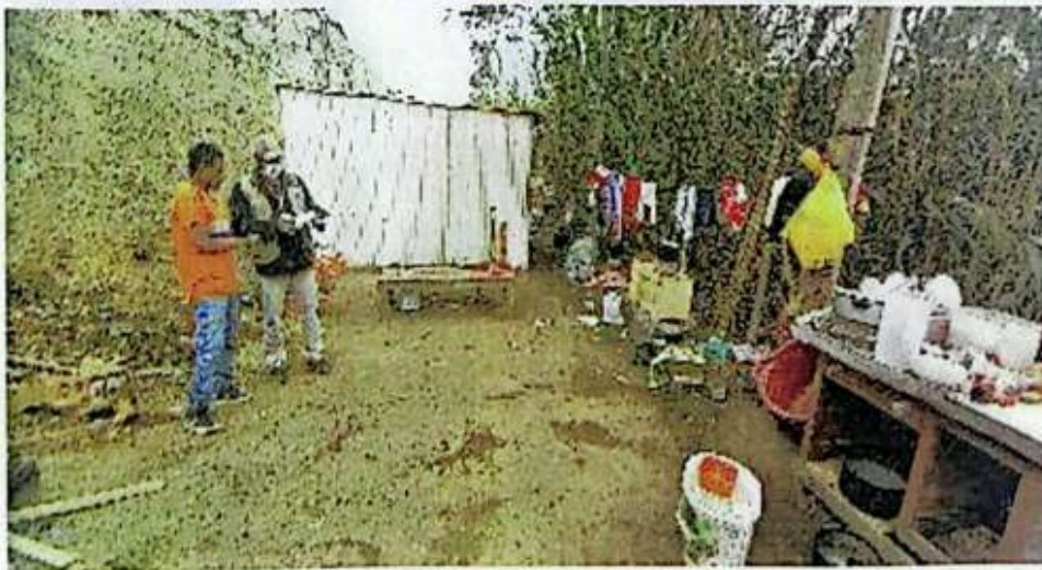
Foto 04: intervención al ocupante de la vivienda precaria. 16.08.2022