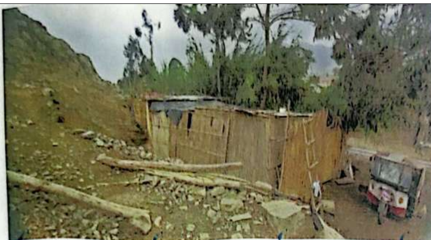
Foto 10: Vista del área materia de la denuncia, con estructuras precarias instaladas desde julio del 2022.