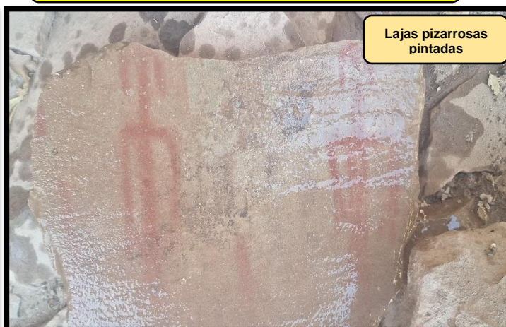
Foto N° 04: en el que se visualiza la representación de figuras antropomorfas.