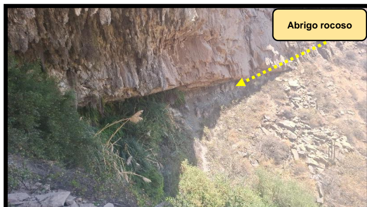
Foto N° 01: en el que se visualiza el abrigo rocoso materia de la presente evaluación.

Las fotos deberán mostrar lo indicado en la valoración cultural (debe observarse de manera evidente la condición de sitio arqueológico del bien):