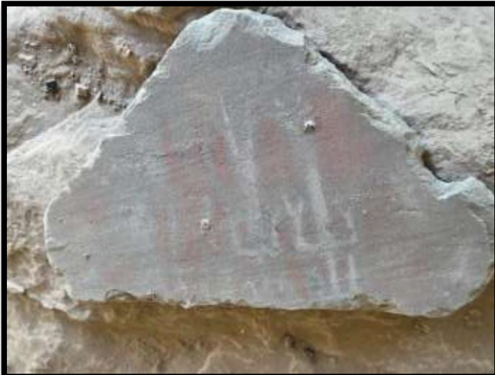
Foto N° 08: en el que se visualiza una laja con representación antropomorfas.