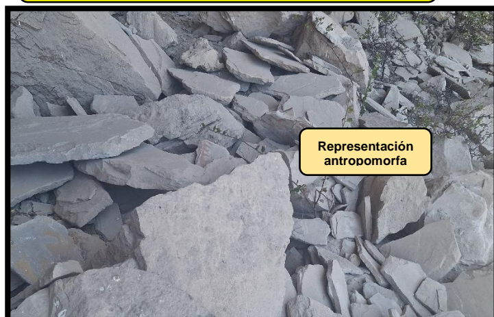
Foto N° 03: en el que se visualiza la acumulación de lajas pintadas con diferentes motivos.