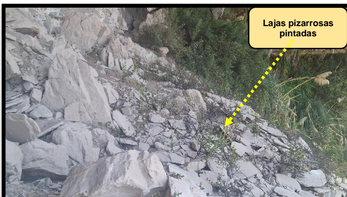
Foto N° 02: en el que se visualiza el conjunto de lajas pizarrosas los cuales se encuentran diseminados.