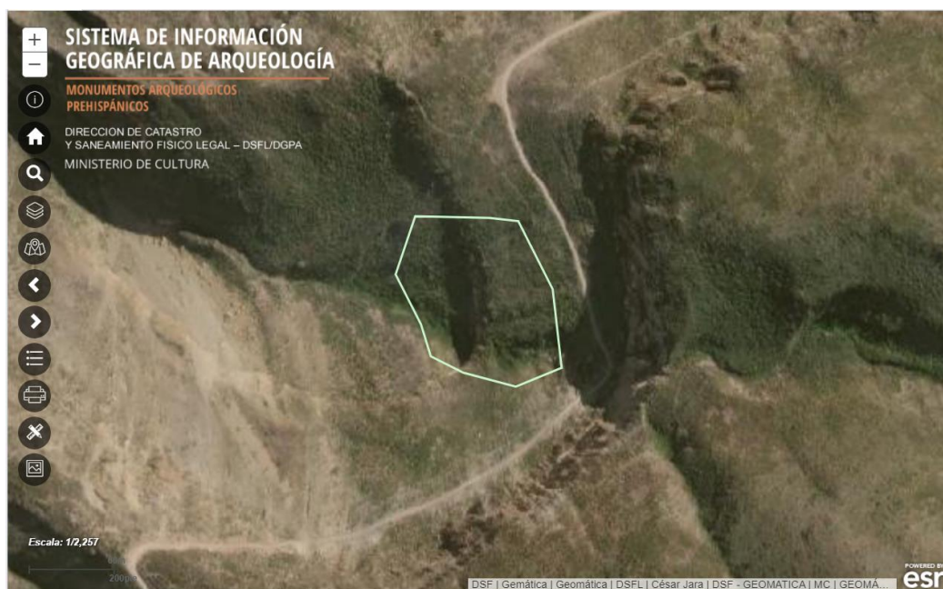
Imagen de satélite del SIGDA que muestra el ámbito solicitado para protección provisional del sitio arqueológico Guitarrayoq.