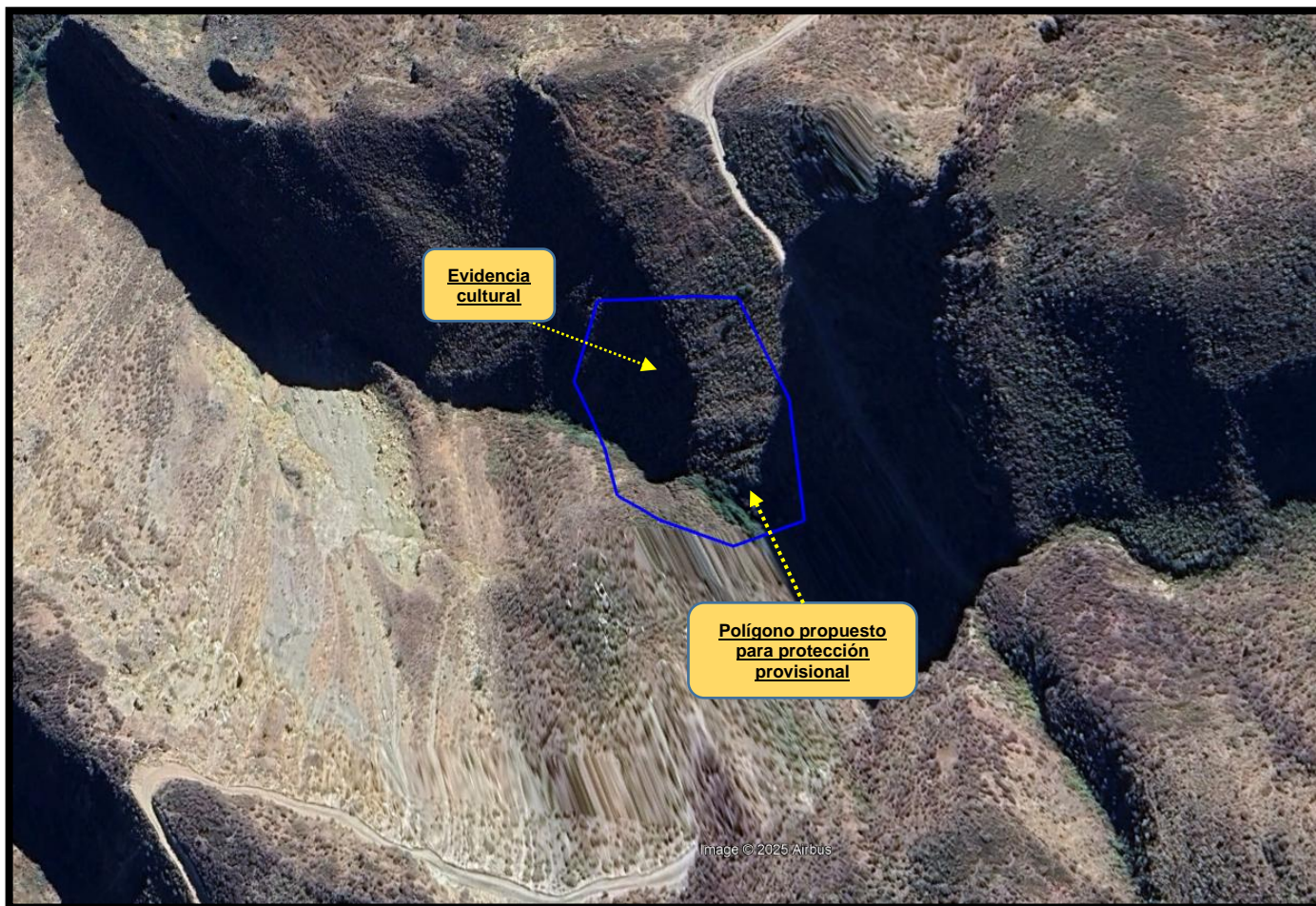
Imagen satelital N° 01, que muestra el polígono correspondiente a la propuesta de delimitación del Sitio Arqueológico "Guitarrayoq", para su protección provisional, verificando al interior del mismo, la evidencia cultural que viene siendo afectada por acciones antrópicas considerándose un peligro latente para este importante espacio.