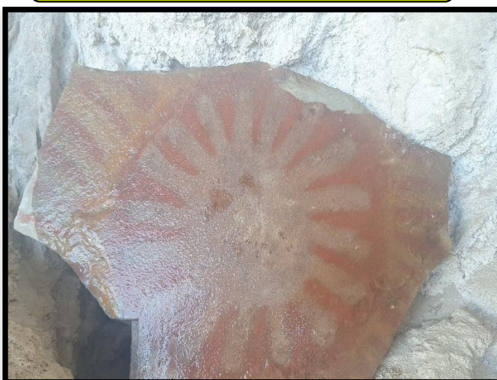
Foto N° 06: en el que se visualiza una laja con representación geométrica.