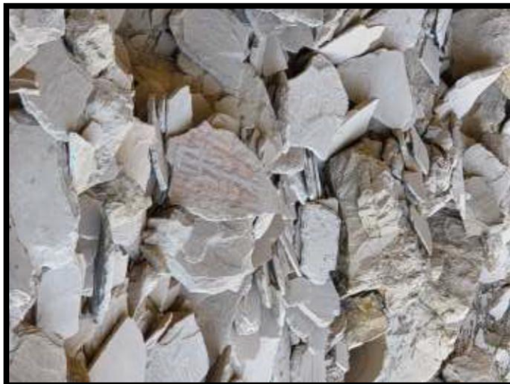
Foto N° 07: en el que se visualiza las representaciones antropomorfas.

"Año de la recuperación y consolidación de la economía peruana"