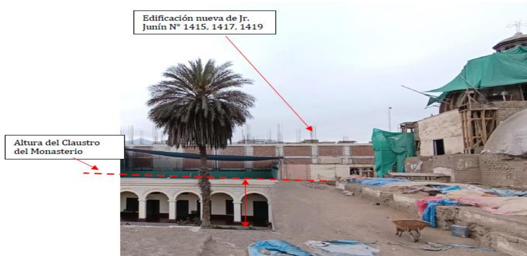
Imagen 2: Vista desde el techo del Claustro del Monasterio, donde se aprecia el exceso de la altura de edificación que perturba y trasgrede el valor de conjunto del mismo.

Imagen 1: Vista de la altura determinado del inmueble materia de estudio, en el cual se evidencia que su altura es casi igual al del Monumento colindante.