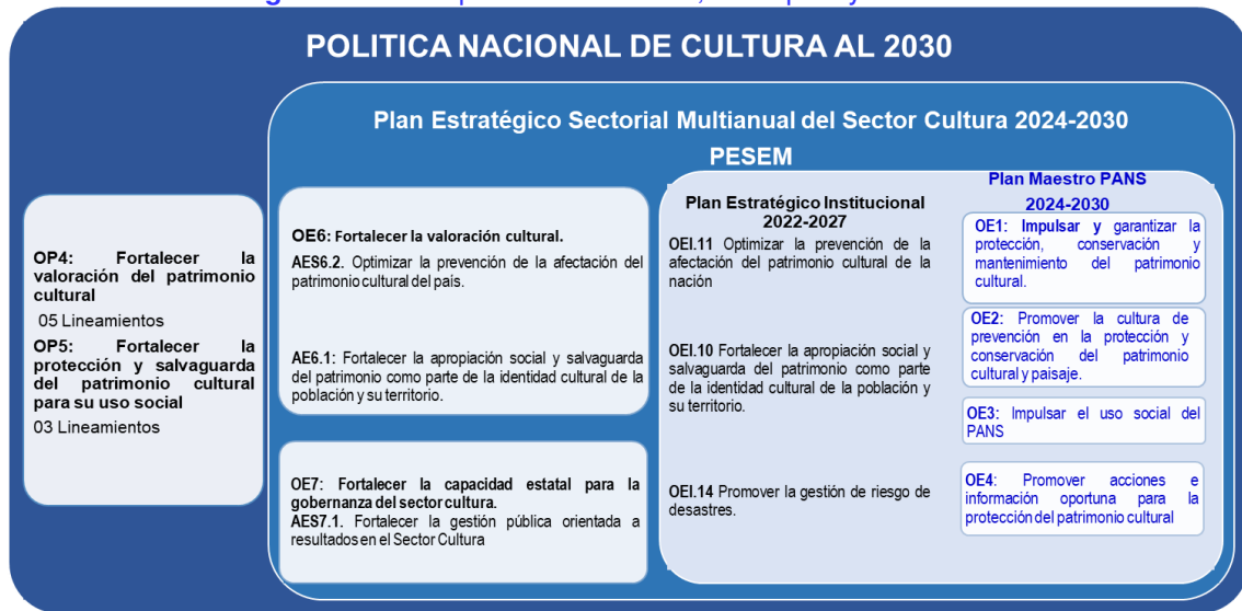
Imagen N° 01. Esquema de Políticas, Principios y Lineamientos