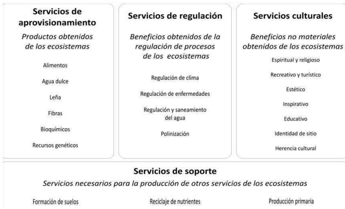
Cuadro N° 01: Servicios Ambientales