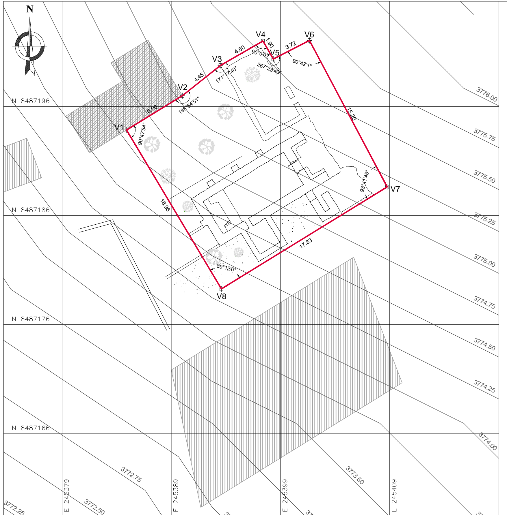
PLANO PERIMÉTRICO ESC: 1/200