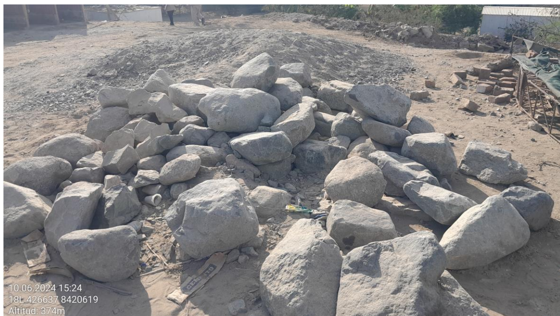
Imagen 04: vista panorámica de materiales de construcción.