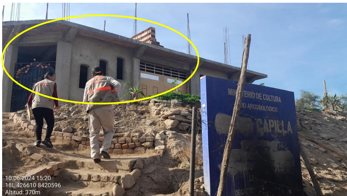
Imagen 01: vista panorámica del asentamiento y construcción de la iglesia evangélica de material noble a obra gruesa.