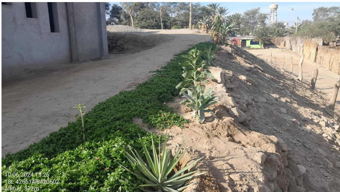
Imagen 05: vista panorámica de lado este del sitio, donde se observa a obra gruesa la construcción de la iglesia evangélica.

10.06.2024 15:26 18L 426614 8420602 Altitud: 372m