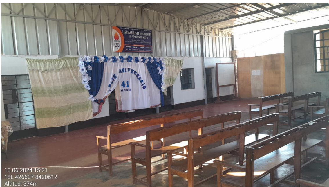
Imagen 10: interior de la iglesia evangélica construidas al interior del sitio arqueológico huaca Capilla.