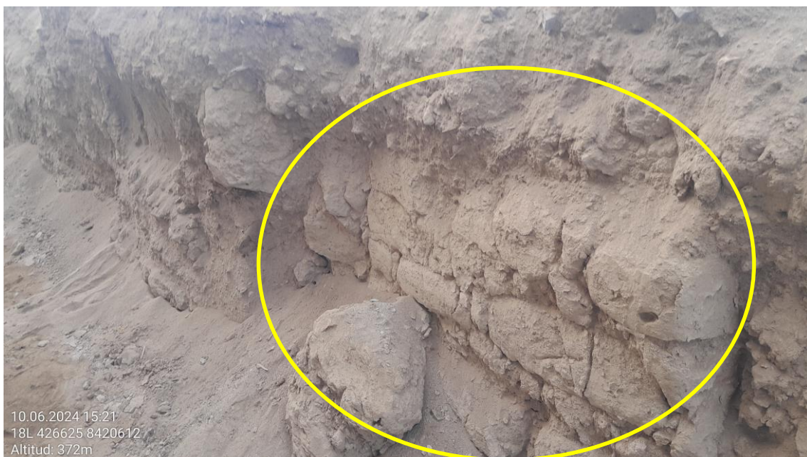
Imagen 09: vista a detalle de restos de adobe pertenecientes a las arquitecturas prehispánicas del bien cultural.

SUBDIRECCIÓN DE PATRIMONIO CULTURAL E INDUSTRIAS CULTURALES E INTERCULTURALIDAD DE LA