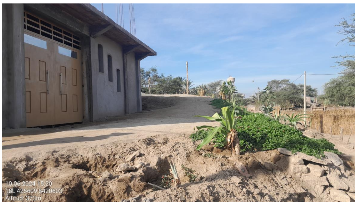
Imagen 02: vista a detalle cómo se aplanó la huaca para construir la vivienda y asimismo plantar flores ornamentales al interior del Bien Inmueble Prehispánico.