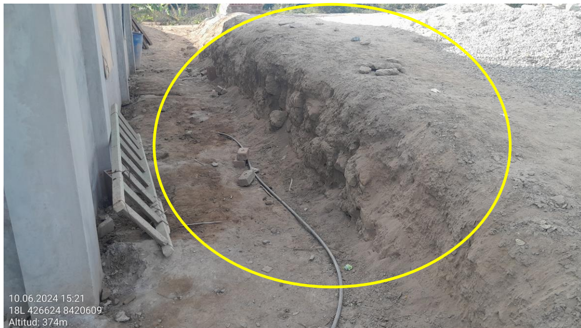
Imagen 08: vista panorámica de restos arquitectónicos expuestos producto de la excavación del suelo.