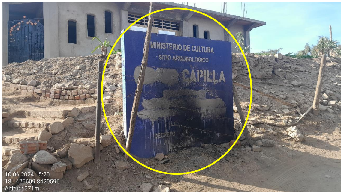
Imagen 07: vista panorámica del mural de información que indica la condición del sitio arqueológico, la misma que se observa la afectación al mural de señalización.

SUBDIRECCIÓN DE PATRIMONIO CULTURAL E INDUSTRIAS CULTURALES E INTERCULTURALIDAD DE LA