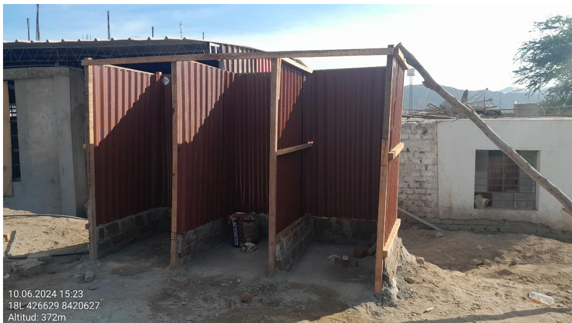
Imagen 03: vista panorámica de la construcción de servicios higiénicos de material noble y planchas de calamina de plástico.

SUBDIRECCIÓN DE PATRIMONIO CULTURAL E INDUSTRIAS CULTURALES E INTERCULTURALIDAD DE LA