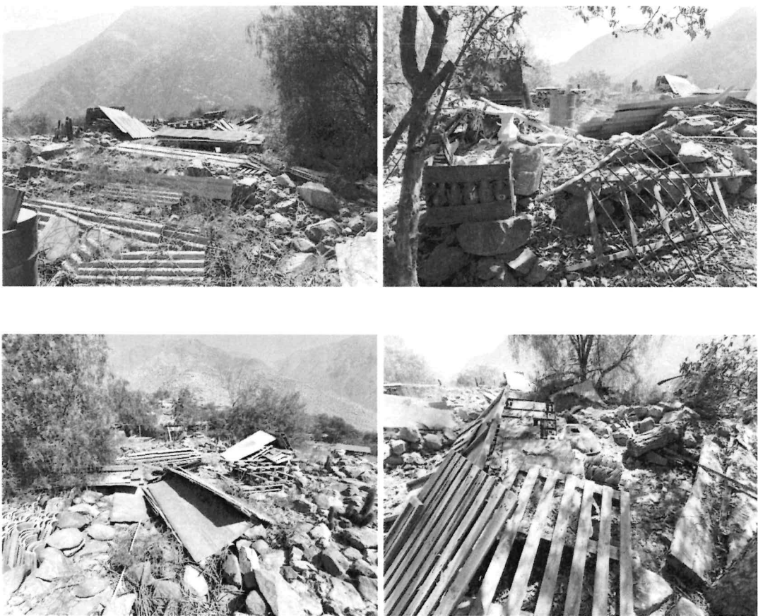
Imágenes tomadas en fecha del 02 de julio del 2024, en ellas se puede observar que al interior del sitio arqueológico se han depositado materiales en desuso, como son parihuelas de madera, fierros y botellas de vidrio.

A handwritten signature in black ink, located at the bottom left of the page.