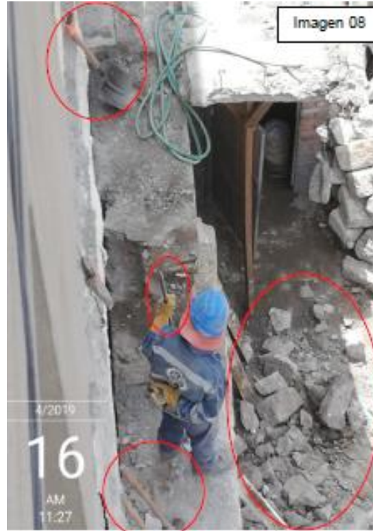
Imagen 08: del 16.04.19

2.41 Que, de otro lado, en cuanto a la afirmación referente a que el inmueble que arrienda el administrado, no tiene la envergadura de “casona”, cabe señalar que ello es irrelevante para la configuración de la infracción que le fue imputada, toda vez que ésta se refiere a la ejecución de una obra privada en un bien integrante del Patrimonio Cultural de la Nación, sin autorización del Ministerio de Cultura, en este caso, a la obra de demolición realizada al interior del inmueble que arrienda, el cual se emplaza y forma parte integrante del Ambiente Urbano Monumental de la calle Santa Marta y del perímetro protegido de la Zona Monumental de Arequipa, bienes integrantes del patrimonio cultural de la Nación, que han sido declarados como tales, mediante la Resolución Suprema N° 2900-1972-ED, de fecha 28 de diciembre de 1972, publicada en el diario oficial El Peruano el 23 de enero de 1973, resolución en cuya parte resolutive, se indica la exigencia de contar con la autorización correspondiente del INC (hoy Ministerio de Cultura) para la ejecución de cualquier obra dentro de su área declarada, en la cual se emplaza el inmueble sito en el Jr. Santa Marta N° 204 del distrito, provincia y departamento de Arequipa, de acuerdo a los siguientes fragmentos de dicha resolución: